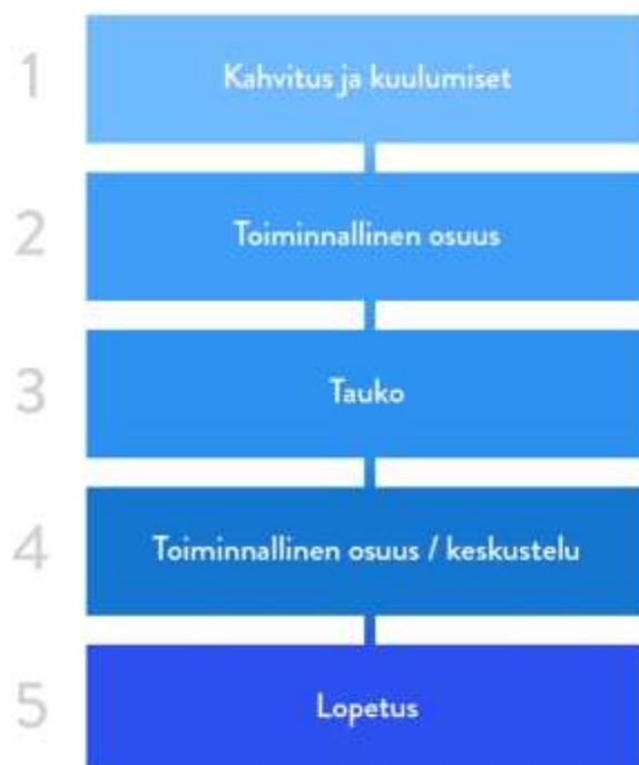
Kuvio 2 Toimintakertojen runko

Ryhmän teemojen lisäksi jokaiselle kerralle suunniteltiin alustava toimintarunko kahvi- ja välitaukoineen (Kuvio 1). Vaikka suunnitteluvaiheessa budjetti opinnäytetyötä varten oli täysi nolla, toiminnan edetessä saatiin tietää J-Napin kustantavan jokaiselle ryhmäkerralle kahvit ja pientä välipalaa. Myös tila ryhmätoiminnalle järjestyi J-Napin kautta. Varsinaiseen toimintaan J-Napilta ei kuitenkaan tullut rahoitusta, eikä opinnäytetyön tekijät kokeneet että rahallista tukea olisi pitänyt yrittää saada muuta kautta. Toiminnassa käytetyissä materiaaleissa, kuten peleissä, lomakkeissa ja esitteissä hyödynnettiin pääsääntöisesti tekijöiden omia resursseja sekä kotoa löytyviä tavaroita. Ainoastaan liikunta-viikolle tarvittavat patjat lainattiin eräältä Jyväskylän kaupungin terveysasemalta J-Napin työntekijän yhteistyökuvioiden ansiosta. Myös muut yhteistyökumppaneilta saadut hyödyt olivat täysin aineettomia, kuten liikunta-viikon ohjaus, eivätkä edellyttäneet opinnäytetyön osaltakaan rahallista panostusta.