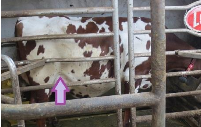
Kuva 3 Potkimisen estämiseksi voi nostaa kädellä nahkapoimua ylös nuolen osoittamasta paikasta

Jos rapsuttelu ei auta, voi kokeilla jotain seuraavista, kuten nostaa kädellä takajalan edessä olevaa nahkapoimua (kuva 3) samalla tyylillä kuin potkunestäjä tekisi, mutta voi laittaa potkunestäjän, jos ei halua laittaa kättä. Voi kokeilla myös nostaa lehmän häntä suoraan ylös ja pitää sitä selän päällä kaarella koko toimenpiteen ajan. (Ikkala.)