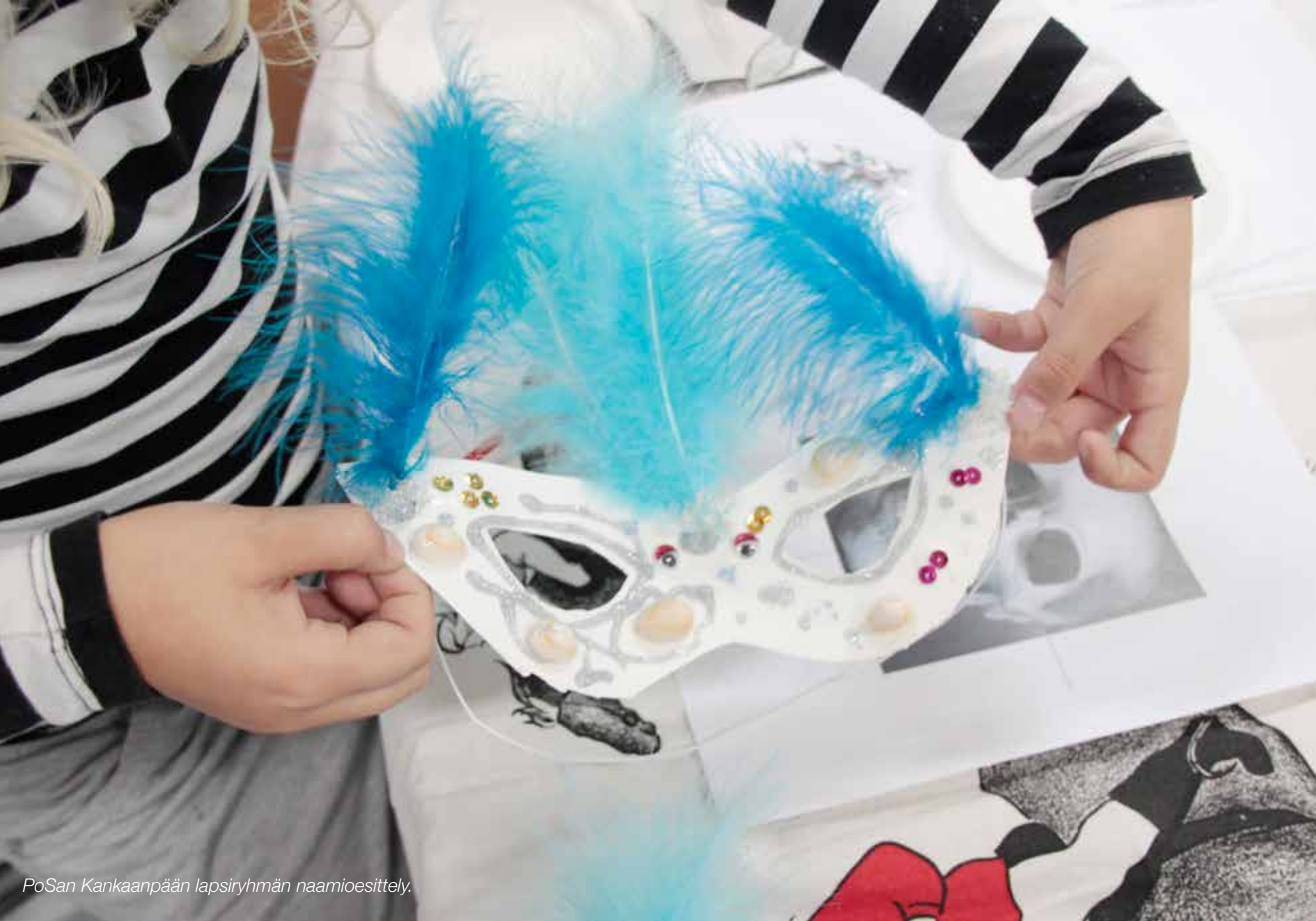
PoSan Kankaanpään lapsiryhmän naamioesittely.