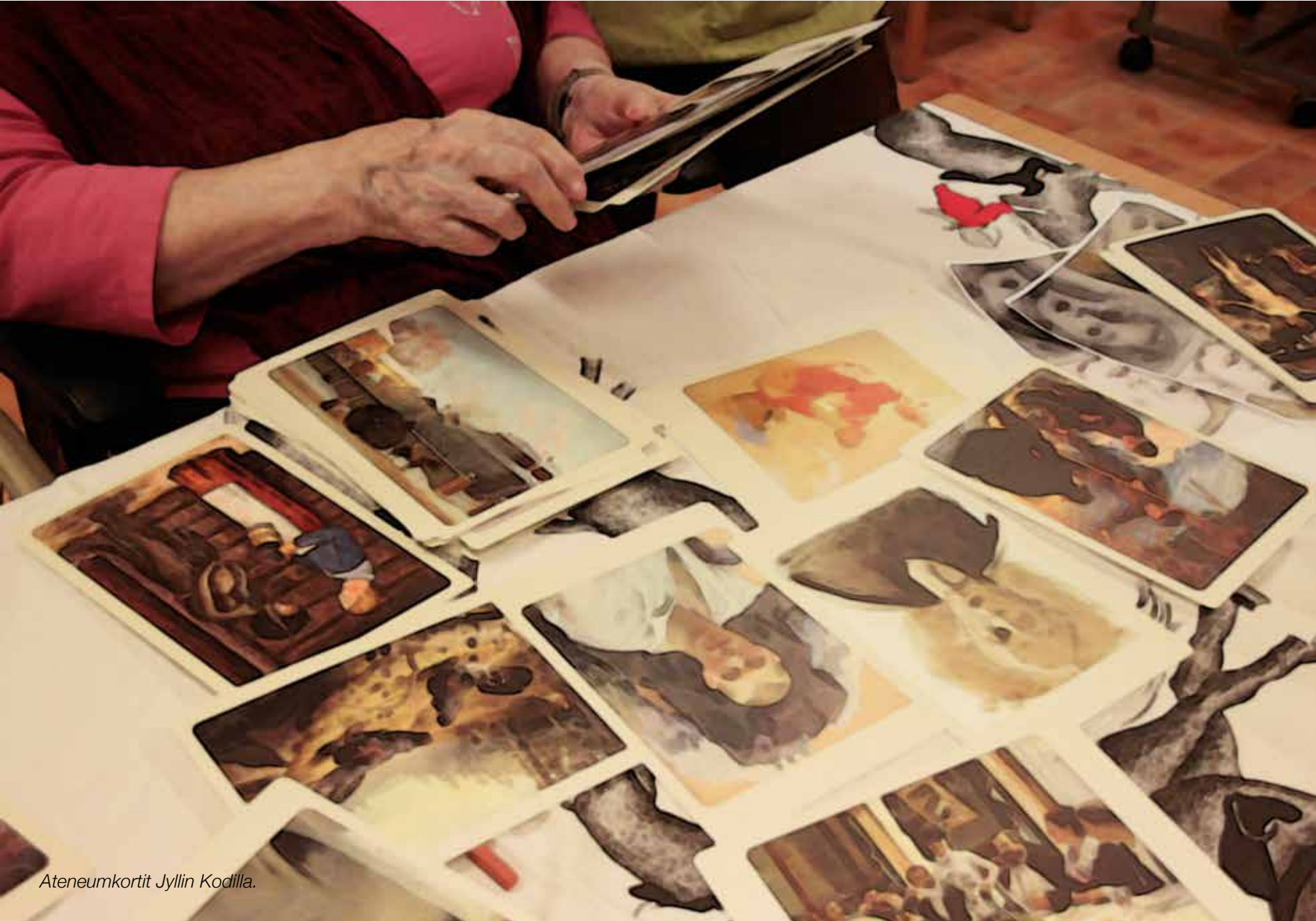
Ateneumkortit Jyllin Kodilla.