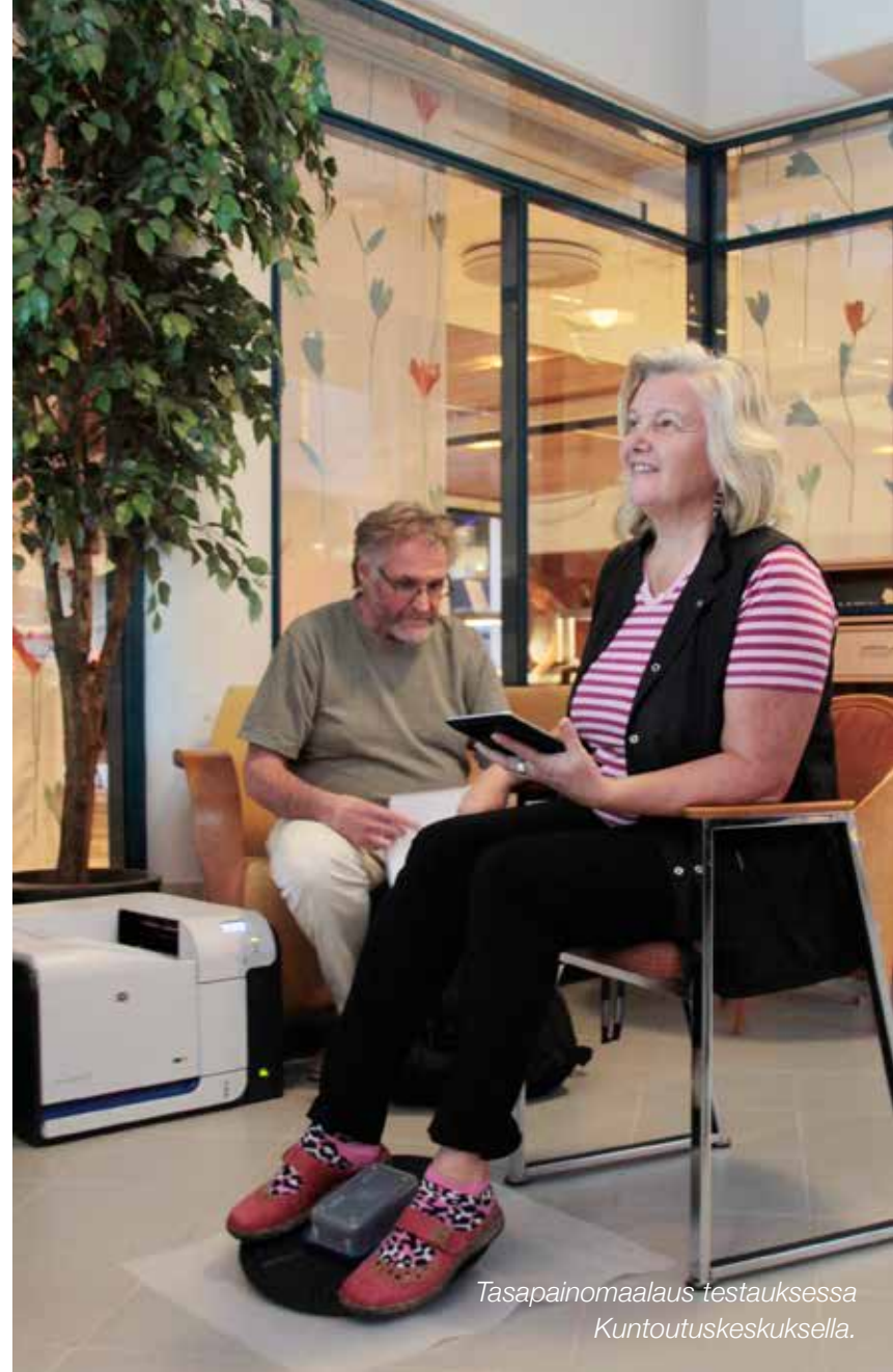
Tasapainomaalaus testauksessa Kuntoutuskeskuksella.