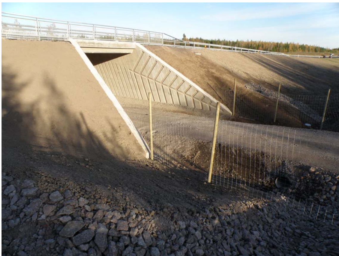
Kuva 9. Viimeistely siltapaikka (Tamio 2013.)