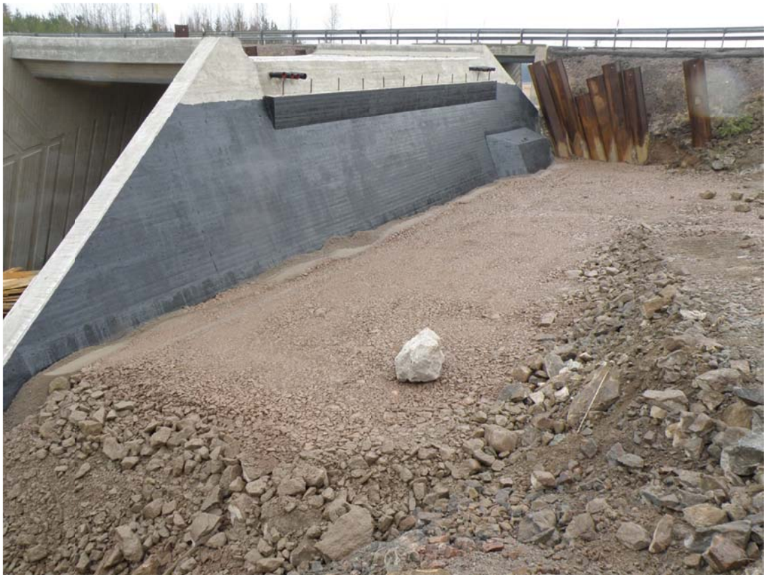
Kuva 2. Täyttökerros tiepenkereen päältä tehtynä (Tamio 2013.)

Sillan betonipintoja vasten käytettiin kalliomurskettä 0-56 ja bitumoituja betonipintoja vasten käytettiin kalliomurskettä 0-16, muu täyttö tehtiin 0-150 kalliomurskeesta ja louheesta. Täyttöä tehtiin noin puolen metrin kerroksina, vuorotellen sillan molemmissa päissä, koska haluttiin sillaan kohdis-