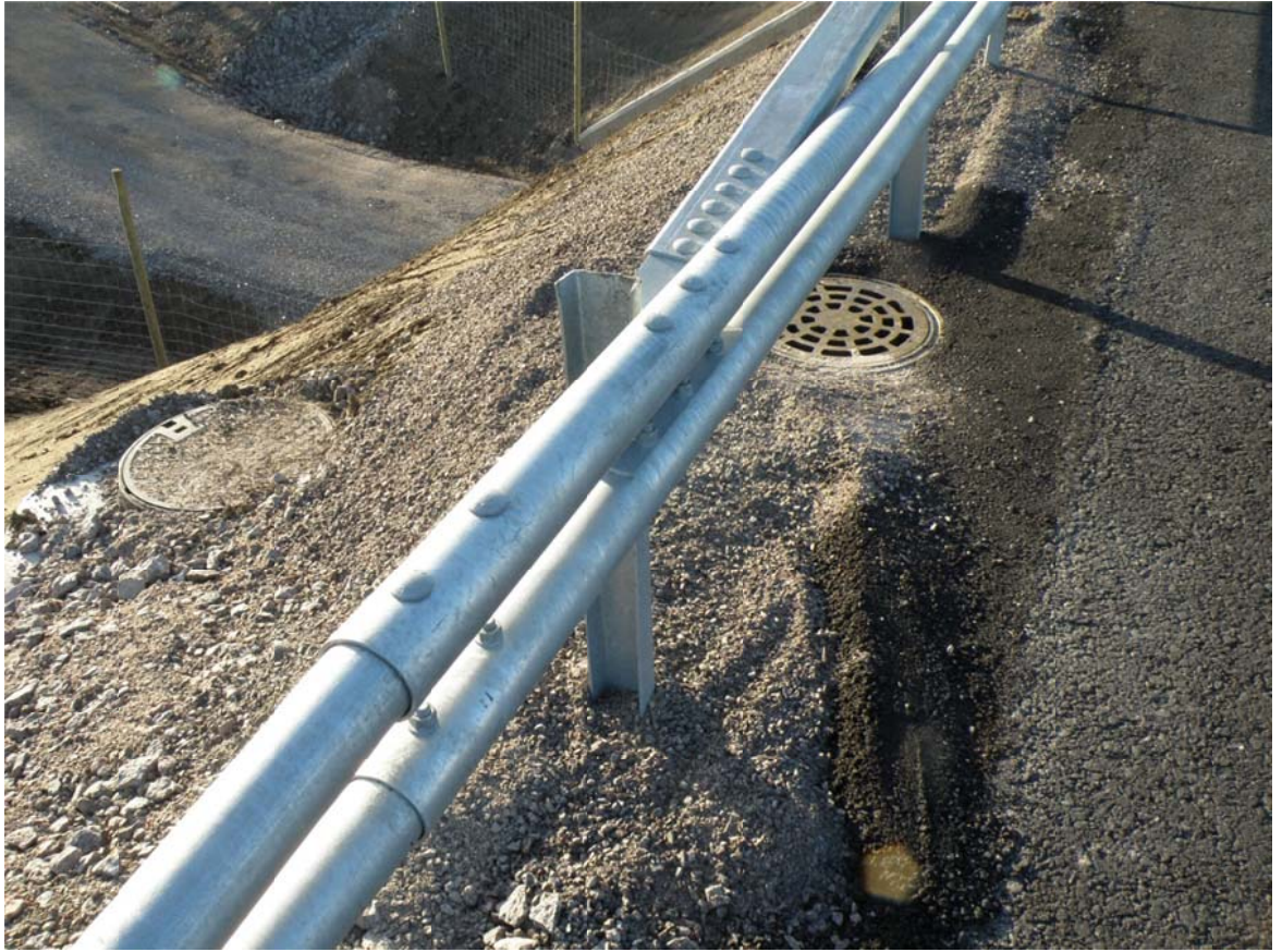
Kuva 8. Kaivot kaapeli ja kuivatus asennettuina (Tamio 2013.)