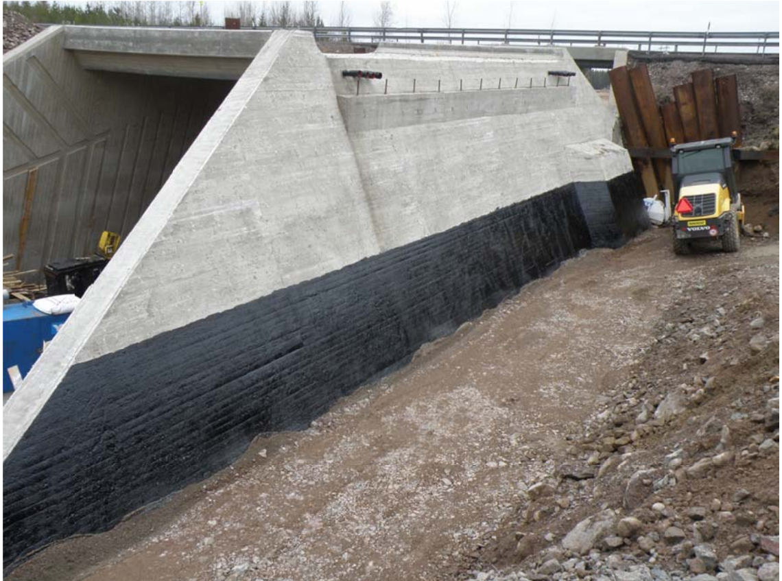
Kuva 1. Täyttökerros sillapaikan sivusta tehtynä (Tamio 2013.)