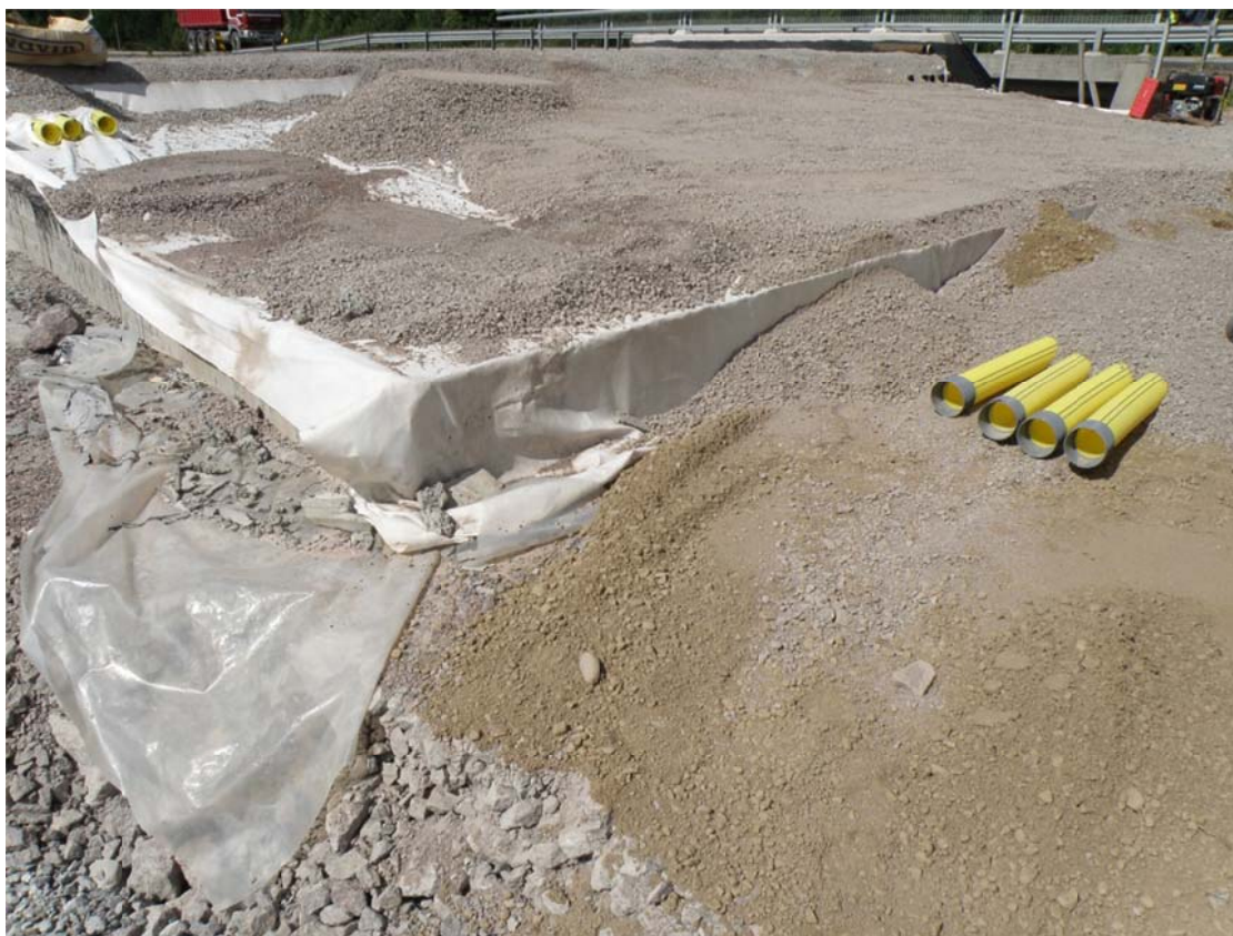
Kuva 6. Tierakenteen poikki tulevien putkien asennus menossa, kuvaaja tulevan kaapelikaivon kohdilla (Tamio 2013.)

Siirtymälaatan yläpuolisessa täytössä ensimmäisenä piti varmistaa etteivät asennettavat suojaputket sattuisi teräskaitteen tolpan kanssa samaan kohtaan, jolloin kaidetolppia lyöäessä tolppa rikkoisi täyttöönsä asennettuja putkia. Tolppien kahden metrin jaon perusteella määritettiin helpoiten toteutettavat paikat kaapelikaivoille ja suojaputkille. Jos putkia ei saada tarpeeksi kauaksi kaidetolppien paikoista, voidaan kaidetolpan kohdalle asentaa halkaisijaltaan hieman kaidetolppaa suurempi esim. rumpuputken pätkä, johon kaidetolppa myöhemmässä vaiheessa laitetaan ja täytetään murskeella. Näin suojaputkia voidaan turvallisesti viedä aivan kaidetolpan vierestä.