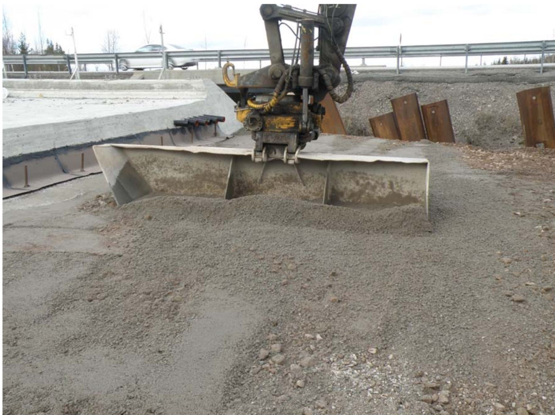
Kuva 3. Siirtymälaatan pohjan viimeistelyä (Tamio 2013.)