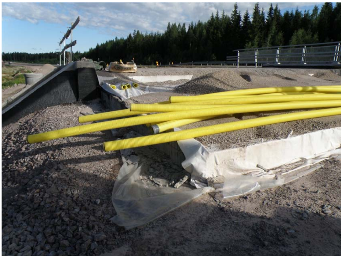
Kuva 5. Siltakannen läpi tulevat suojaputket (Tamio 2013.)

Kaikkiin siltoihin oli suunniteltu siltakannen läpi molempiin reunoihin neljästä kuuteen 110 mm:n suojaputkea tulevaisuuden varalle (kuva 5). Kannen jälkeen putket kääntyvät siirtymälaatan päällä penkereen luiskaan kaapelikaivoon. Lisäksi luiskissa olevien kaapelikaivojen välille tuli useita suojaputkia (kuva 6). Näin ollen siltapaikalla on varaukset kaapeleille sillan läpi molemmista reunoista sekä sillan molemmin puolin alitus moottoritien ajoradan ali.