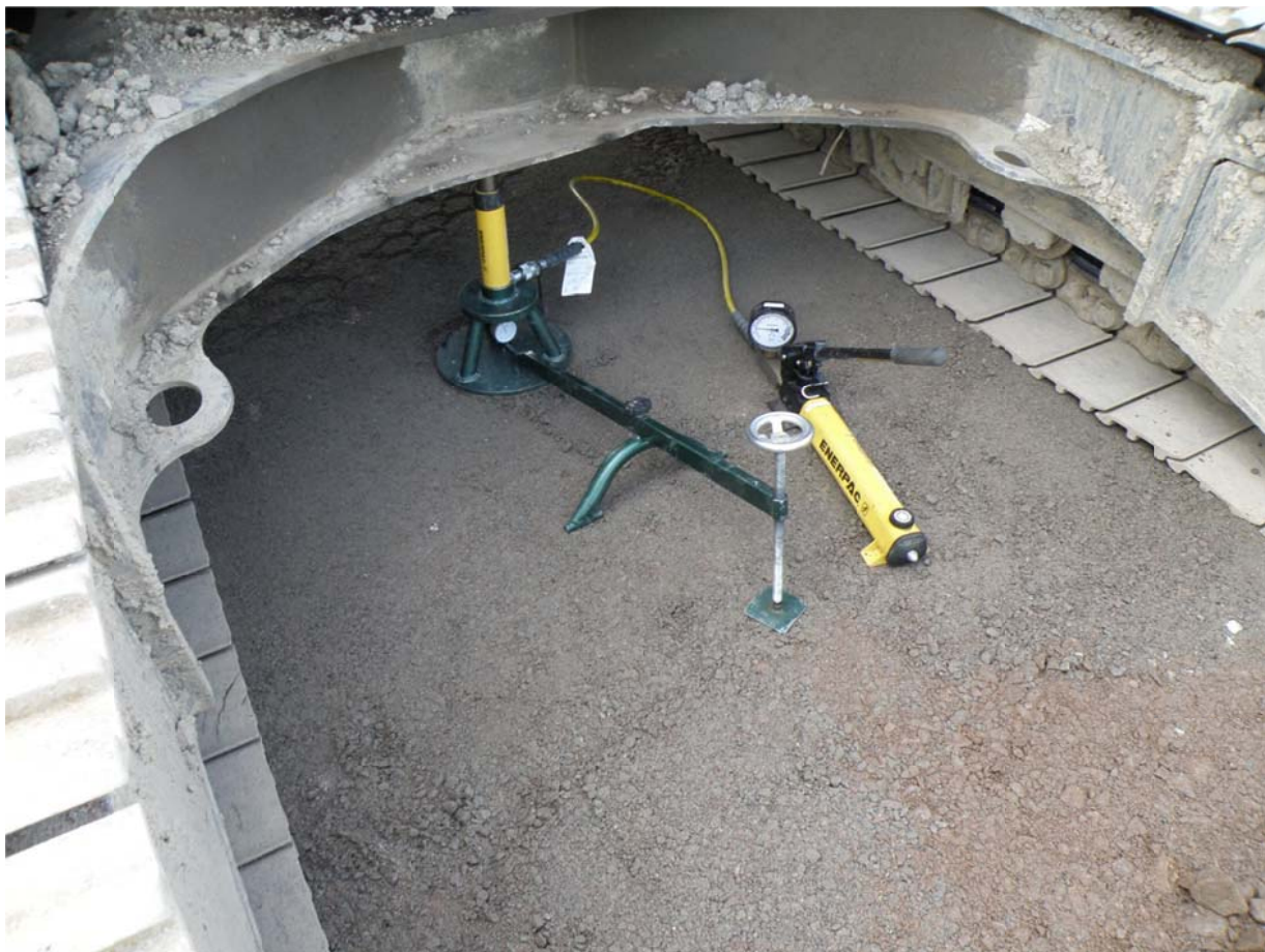
Kuva 4. Levykuormituskokeen mittaus (Tamio 2013.)