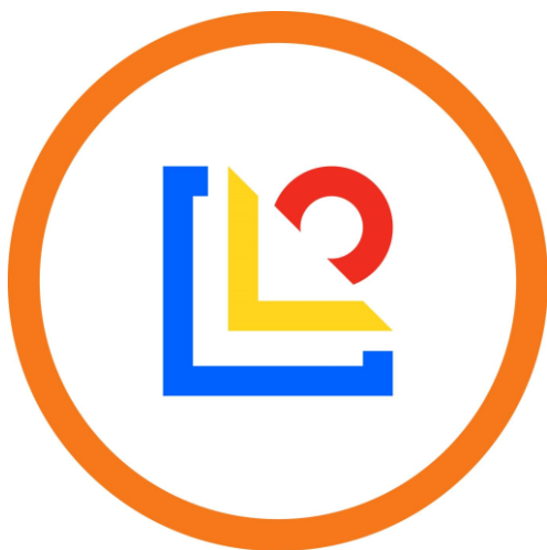
Kuva 1: Vanajaveden Opiston logo. (Vanajaveden Opiston Facebook-sivut)

Toinen kokonaisuus on nimeltään "Vanajaveden verkostot" -tapahtumasarja ja se pitää sisällään toimintasuunnitelman siitä, miten Vanajaveden Opisto voi erilaisia tapahtumia järjestämällä ja alumnitoimintaa kehittämällä vastata opiskelijoiden verkostoitumistarpeisiin jopa oman opiston sisällä (liite 4).