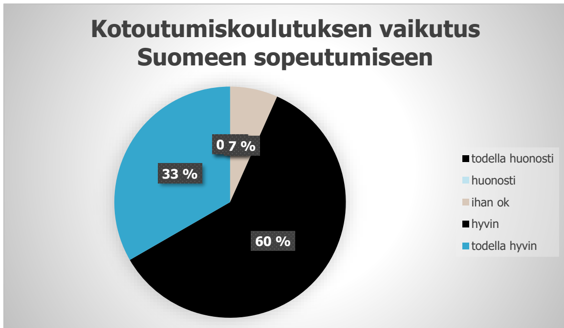
Kaavio 3: Tunne Suomeen sopeutumisesta alkukyselyn mukaan.

Suurin osa vastaajista (93 %) kokee, että kotoutumiskoulutus auttoi heitä hyvin tai erittäin hyvin sopeutumaan Suomeen. Tämä viittaa siihen, että koulutusohjelma on tehokas ja täyttää suurimman osan opiskelijoiden tarpeista. Vain yksi vastaaja (7 %) ilmoitti, että koulutus oli "ihan ok", ja tämä tarjoaa mahdollisuuden tarkastella, miten koulutusta voidaan parantaa, jotta kaikki opiskelijat kokevat saavansa tarvittavan tuen ja avun.