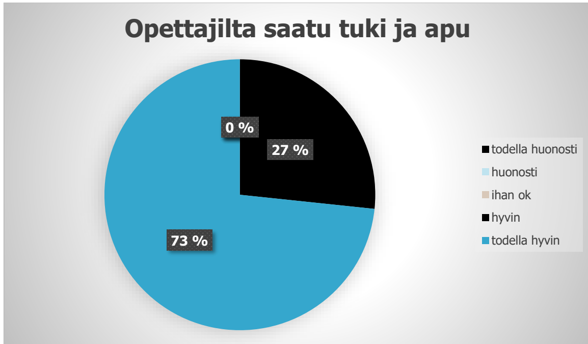
Kaavio 1: Opettajilta saadun tuen ja avun määrä alkukyselyn mukaan.

kotoutumisprosessissa. Opettajien tehokkuus ja tuki vaikuttavat positiivisesti maahanmuuttajien kokemuksiin ja heidän kotoutumiseensa. Vastausten perusteella voidaan sanoa, että kotoutumiskoulutuksen opettajat Hämeenlinnassa tarjoavat korkealaatuista tukea ja apua opiskelijoilleen, mikä on erittäin tärkeää maahanmuuttajien kotoutumisen onnistumiseksi.