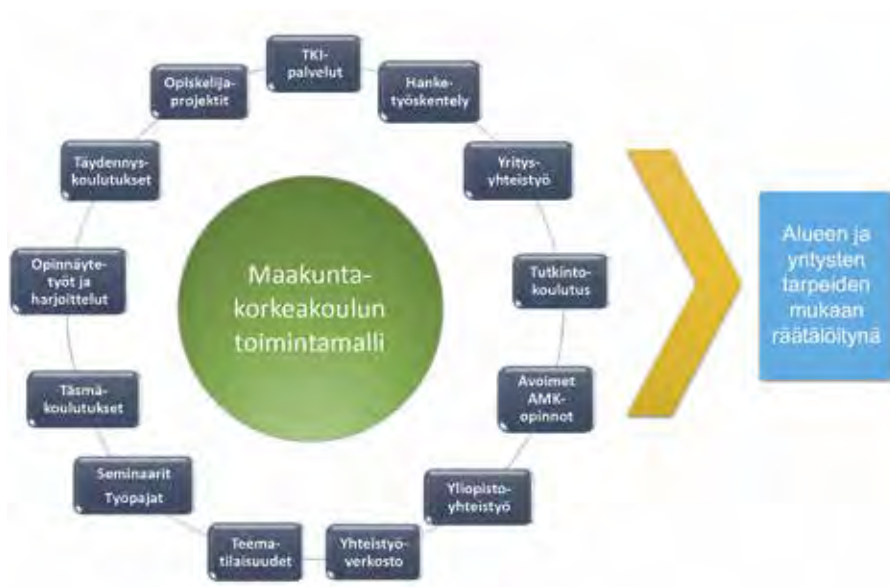
Kuvio 1. Maakuntakorkeakoulun toimintamuuotoja.

Kuviossa 1 esitellään maakuntakorkeakoulun toimintamuuotoja. Toimintamuodot ovat moninaisia, mutta niitä kaikkia yhdistää alueiden ja yritysten tarpeiden mukaan tehty räätälöinti.