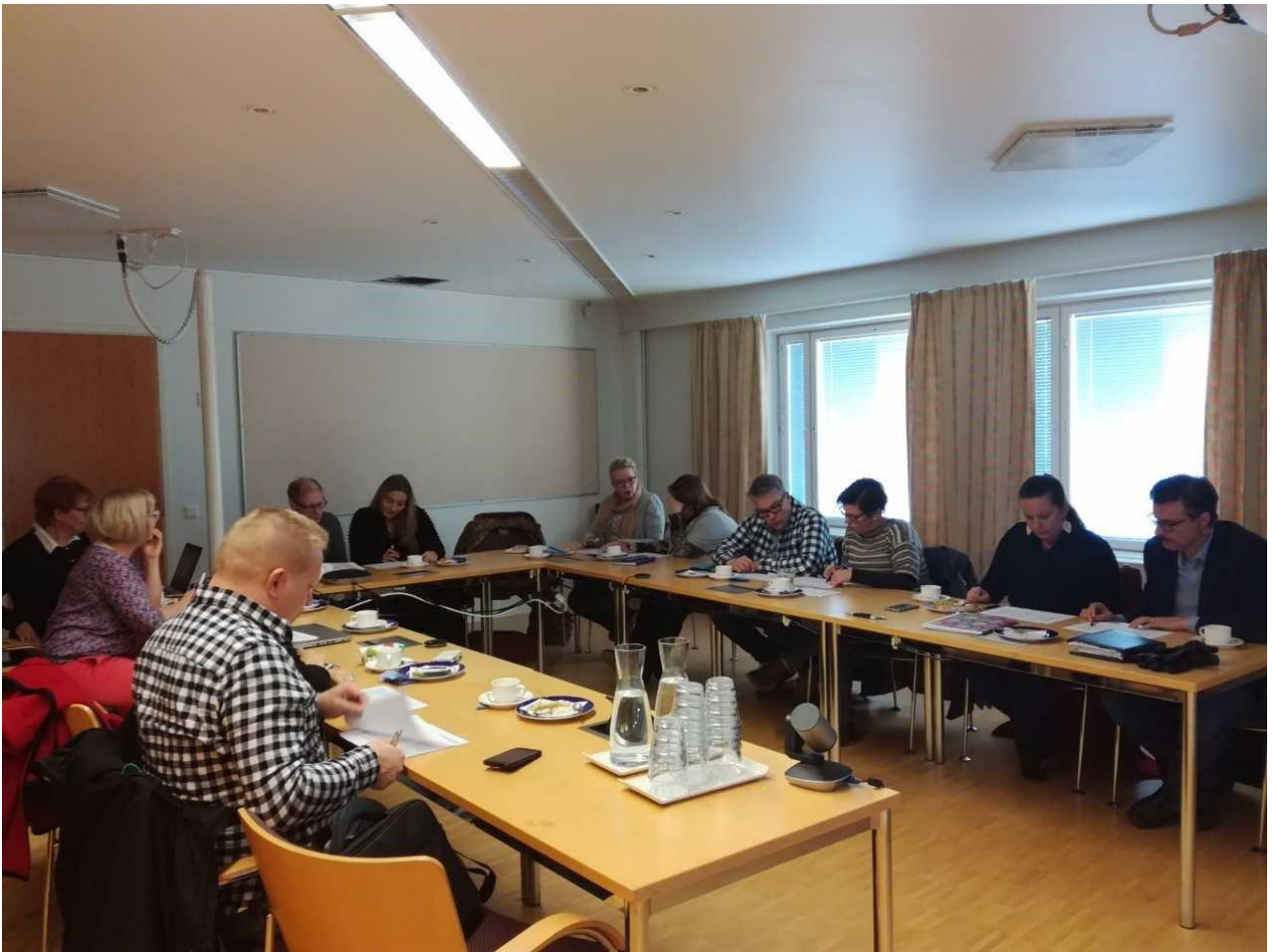
KUVA 2. SoLKI-työkalun testausta yritysneuvojen kanssa Ylivieskassa 1.11.2017

Työkalu on otettu erittäin hyvin vastaan ja todettu tarpeelliseksi. SoLKI-työkalu on herättänyt kiinnostusta laajemminkin: se on otettu käyttöön Koillismaalla SoteNoste -hankkeessa ja Pohjois-Savossa Sopiin -hankkeessa.