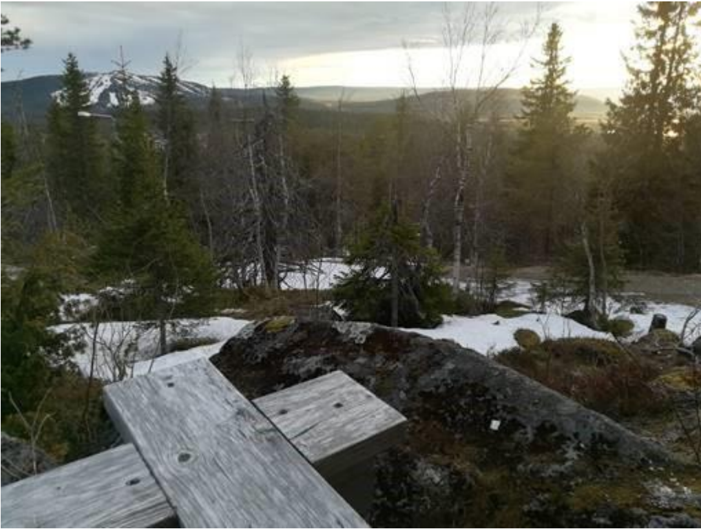
KUVA 1. Viileä alkukesän sää lumipeitteineen loi raikkaat olosuhteet kehityspäiville Pikku-Syötteellä

Sain tehtäväkseni taustoittaa kesällä 2017 pidetyillä osastomme kehityspäivillä julkaisuteemaa sekä organisoida asiaan liittyvää kehittämistä jatkossa. Sovimme kehityspäiville pienimuotoisen puheenvuoron ja yhteisen keskustelutilaisuuden asiasta. Kehityspäivien yhteydessä tehtynä tämän aihepiirin avarakatseinen pohdinta rutiininomaisista työympyröistä irrallaan oli tärkeää (kuva 1).