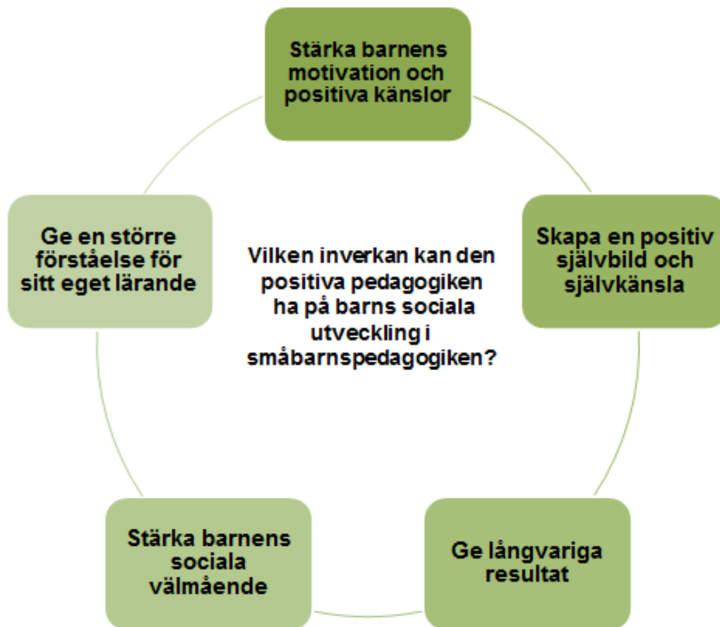
Figur 2: Positiva pedagogikens inverkan på barns sociala utveckling i småbarnspedagogiken. Egen design.