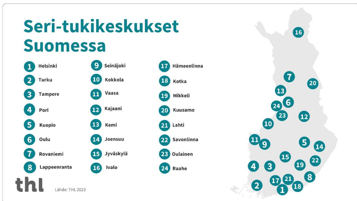
Kuva 1. Seri-tukikeskukset Suomessa (THL, 2023).

Euroopan neuvosto on sopinut yleissopimuksen ehkäisemään ja torjumaan naisiin ja lapsiin kohdistuvaa väkivaltaa, mutta sitä sovelletaan myös miehiä ja poikia kohtaan. Suomessa sopimus otettiin käyttöön v.2015 ja näin Suomella on velvollisuus taata uhreille oikeuslääketieteellinen tutkimus, traumatukea, neuvontaa ja terapiaa. Seurauksena on mm. perustettu 24 SERI-keskusta (seksuaaliväkivaltaa kohdanneiden tukiyksikkö) ympäri Suomen. (ks. kuva 1.) (Bildjuschkin, 2023, s. 57.)