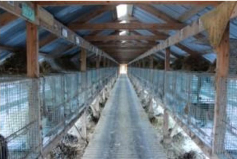
Kuvio 2. Kuva tyypillisestä varjotalosta (Turkiseläimet tuotannossa n.d).

Heti vuoden alussa, eli tammikuussa turkistarhoilla aloitetaan eläinten parittaminen ja se kestää aina huhtikuulle asti. Tavoitteena olisi saada naaras tiineeksi luonnollisella tavalla, mutta aina se ei kuitenkaan onnistu. Keinosiemennys on alalla hyvin yleistä, sillä jopa 30–40 % kaikista turkisnaaraista hedelmöitetään keinosiemennyksen avulla. Siitosuroksia ei yleensä ole kovinkaan paljon, sillä naaraiden hedelmöittymiseen käytetään usein samoja uroksia. Tämä johtuu lähinnä rahan säästämisestä, sillä on kalliimpaa ylläpitää useaa turkiseläinurosta. (Tengvall 1996, 11.)