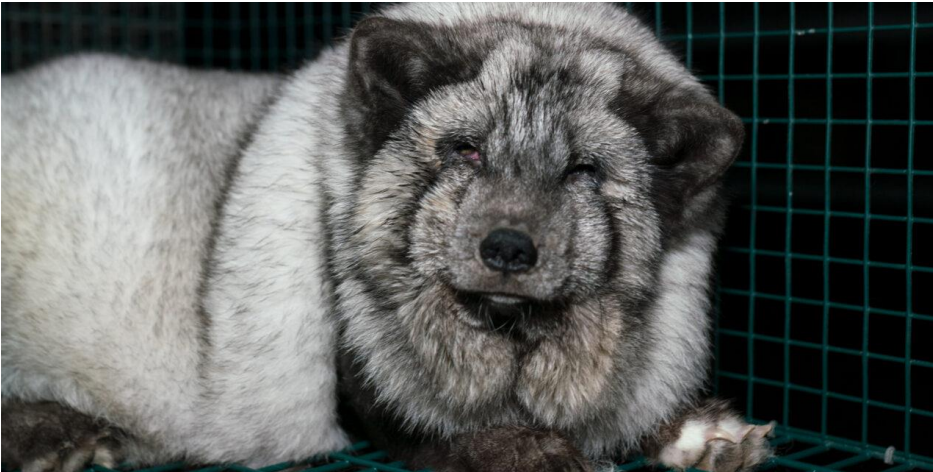
Kuvio 3. Kuva ylijalostetusta ketusta (Turkistotuudet:eläimet n.d).

edellä mainitun tilan puutteesta. Tämä häiriökäyttäytyminen voi olla esimerkiksi toisten eläinten ja itsensä satuttamista. Yhdeksi isoksi ongelmaksi on nimetty ylijalostus ja eläinten lihavuus, josta on esimerkki kuviossa 3. Joidenkin aktivistien mielestä tuotantoeläimiä, etenkin kettuja jalostetaan ja lihotetaan, jotta eläimestä saatava nahka ja turkki olisi suurempi. Liikalihavuus taas aiheuttaa eläimelle terveydellisiä ongelmia. (Viljanen 2019, 38.)