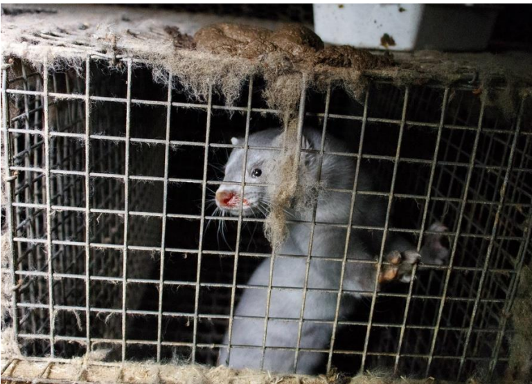
Kuvio 1. Kuva tyypillisestä minkin häkistä (Oikeutta eläimille 2014).

Turkiseläin elää elämänsä metallisessa verkkohäkissä, jota kuvio 1. kuvastaa. Nämä häkit ovat hyvin usein asetettu kahteen riviin, jonka päälle on rakennettu katto. Näitä kutsutaan varjotaloiksi, joka löytyy Kuviosta 2. Yhteen varjotaloon asetetaan tyypillisesti 50–70 eläimen häkkiä. Häkki on sen verran pieni, ettei sinne mahdu oikeastaan muuta kuin eläin itse. Minkeillä on kuitenkin edellytyksenä pesäkoppi, johon se mahtuu sisälle. Metalliverkosta tehty häkki mahdollistaa niiden helpon ruokinnan, sillä tarhaajan on helppo laittaa rehua verkon päälle, josta eläin saa itse syödä ruuan tonkimalla. Se toimii samalla virikkeenä, joita ei ruuan lisäksi ole yleensä kuin puukapula tai jokin vastaavanlainen esine. Turkiseläimen rehu valmistetaan lähtökohtaisesti aina teurasjätteestä, kalasta sekä viljasta, mutta on yleistä, että sen seassa on muutakin, kuten turkiseläinten ruhoja. (Tengvall 1996, 10).