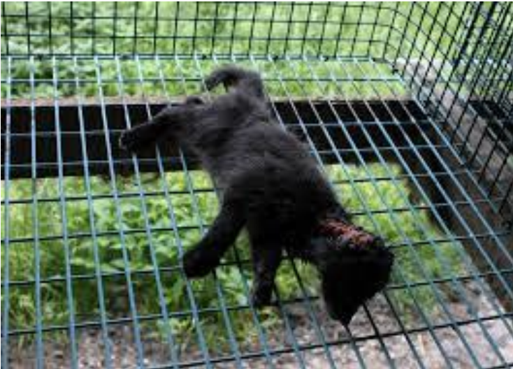
Kuvio 4. Aktivistien julkaisema kuva salakuvauskeikalta (Oikeutta eläimille 2011).

Tarkoituksena eläinoikeusaktivisteilla on ollut aina varmasti hyvä, eli eläinten oikeuksien parantaminen. Aina se ei kuitenkaan ole toteutunut ja eläin on saattanut kärsiä vain enemmän. Iskut tarhoille, joissa eläimiä on vapautettu ovat monesti stressaavia eläimelle. Korkean stressitason takia emo on saattanut tappaa poikasensa. Eläimiä on myös kuollut paljon luontoon vapautuksen yhteydessä, sillä ne eivät ole enää pärjänneet yksin. (Rauhamäki 2008, 35–36).