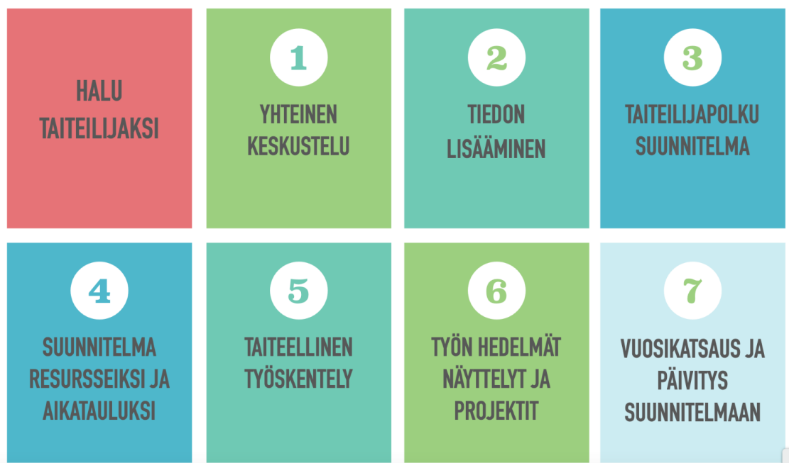
Kuva 5 Taiteilijapolku-mallin eri vaiheet

Taiteilijapolulle voidaan lähteä, jos tekijällä itsellään olla halu taiteilijuuteen. Mallia ei tule lähteä toteuttamaan, ellei tekijä itse ilmaise omaa motivaatiotaan taiteelliseen työhön. Tekijän on ymmärrettävä taiteen harrastamisen ja taiteellisen työn ero ja mitä siihen sitoutuminen tarkoittaa. Mielestäni aika helposti voidaan päätyä tilanteeseen, jossa tukea tarvitsevaa henkilöä aletaan kutsua taiteilijaksi ehkä hienojen töiden tai jonkin onnistuneen näyttelyyn osallistumisen jälkeen. Saattaa olla, että halua taiteilijuuteen tai taiteilijana toimimiseen ei ole koskaan kysytty tai edes selitetty auki kyseiselle tekijälle. Tämä kohta, jossa taiteen harrastaminen muuttuu taiteilijuudeksi, on minusta haastava. Mikäli kommunikoinnin tavat ovat rajalliset, on tilanne helposti kiinni taideohjaajan tai taustahenkilöiden tulkinnasta.