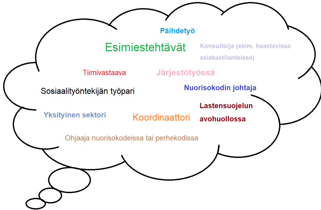
Kuvio 2. Sosionomi (YAMK) työtehtävät haastattelujen tuloksena.

Sosionomi (YAMK):iksi valmistuneilla koettiin olevan monipuolisesti työtehtäviä tarjolla. Esimerkkinä nostettiin vahvasti lastensuojelu ja siihen liittyvät konsultaatiotehtävät. Lastensuojelua kuvattiin tehtäväkenttänä niin laajana ja byrokraattisena, että tähän liitettiin vahvasti erityissosiaali-ohjaajan osaaminen ja mahdollisuudet tuoda omaa osaamistaan esille. Myös jälkihuollon kenttää tuotiin esille ja siihen liittyvää asioiden kokonaisvaltaista hahmottamista palvelukenttineen. Haastattelujen vastauksissa useimmat listasivat sosionomi (YAMK) työtehtäviksi esimiestehtävät; lähiesimies, tiimivastaava sekä myös konsultin tehtävät.