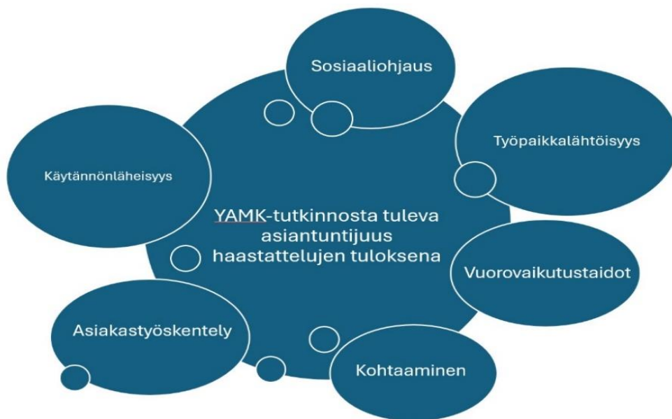
Kuva 2. Asiantuntijuuden näyttäytyminen.

Selvitimme haastateltavilta millaista asiantuntijuutta sosionomi (YAMK) opinnoilla saavutetaan verrattuna sosiaalityön maisterin opintoihin. Alla olevassa kuvassa kootusti haastattelujen tulos tutkinnosta saatavasta asiantuntijuudesta ja mitkä osaamisalueet kehittyvät tutkinnon aikana.