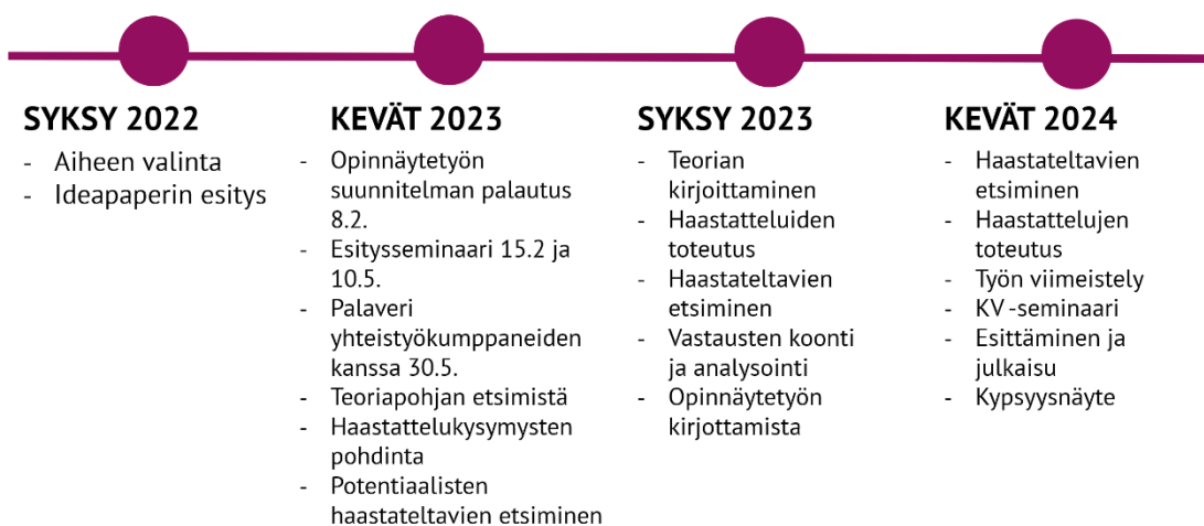
Kuva 1. Opinnäytetyön aikataulu.

Teimme opinnäytetyömme ylemmän ammattikorkeakoulututkinnon kahden vuoden aikarajan puitteissa, mikä oli myös meidän oma tavoitteemme. Seuraavassa luvussa käymme tarkemmin läpi tutkimusta ja siihen liittyvää työskentelyä.