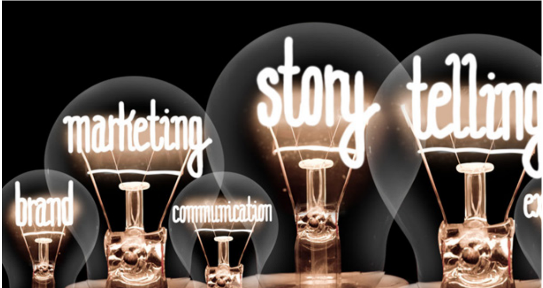
Brändi rakentuu useasta eri tekijästä.