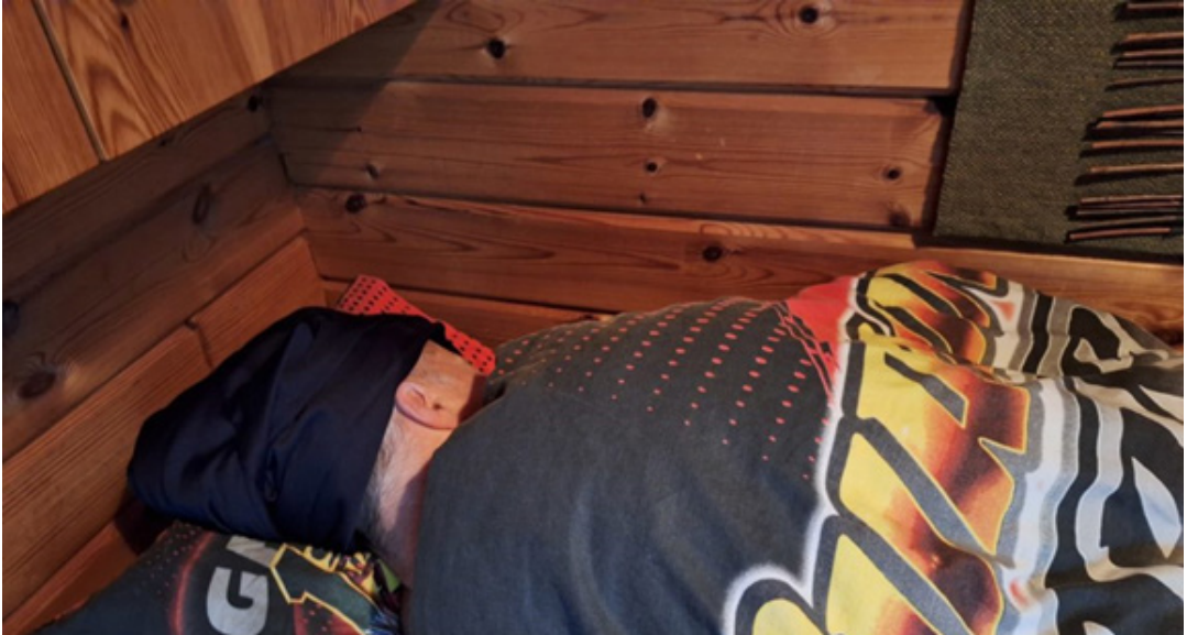
Uniapnea on ikävä sairaus mutta hyvin hoidettavissa.

Uni ja unettomuus ovat polttava puheenaihe ja nämä kysymykset herättävät runsaasti kysymyksiä maailman laajuisesti. Uni vaikuttaa terveyteemme enemmän kuin haluamme uskoa. Unihäiriöt ovat nykyisin jo kansansairaus.