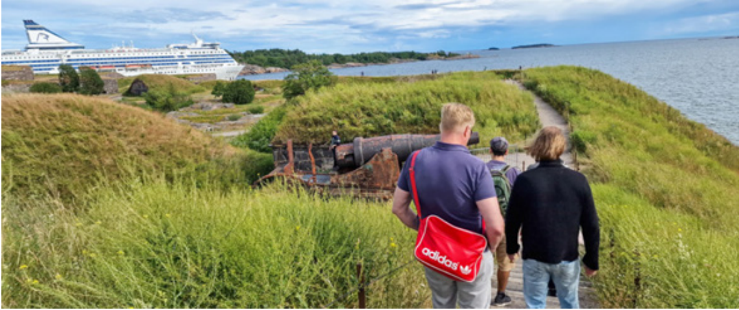
2020-luvulla Itämeren puolustukseen ei riittä enää linnoitukset.