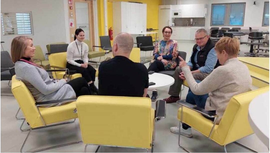
Dialogiringi, jossa meitä oli paikalla 7 tiimin jäsentä.

Vuosi sitten meidän tiimimme päätti ottaa käyttöön dialogiringit. Sovimme, että pidämme kerran kuussa kahden tunnin asialistallisen tiimikokouksen ja sen kanssa vuorotellen kerran kuussa tunnin mittaisen dialogiringin. Dialogiringit ovat olleet tiimimme yhteishengen kannalta huippujuttu.