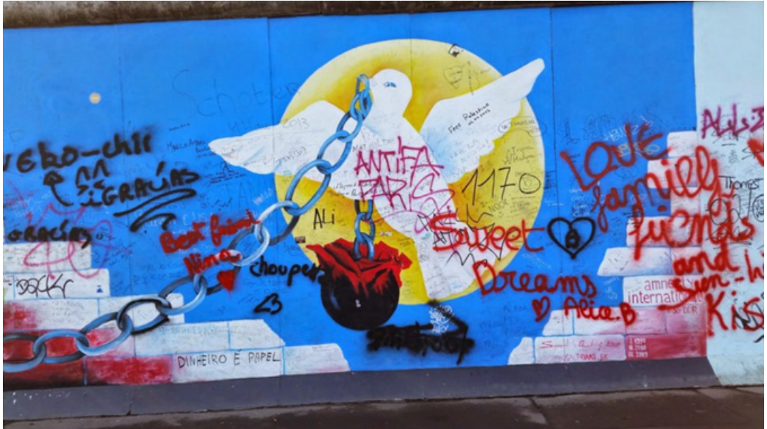
Rauhankyyhky Berliinin muurissa.

Olemme siirtyneet monikriisiaikaan, jossa useat kriisit osuvat samaan hetkeen ja kytkeytyvät yhteen vahvistaen toisiaan. Aikamme haastaa uudella tavalla turvallisuuden tunteen tuntemattoman edessä kun Venäjän hyökkäyssota Ukrainaan, Lähi-idän kriisin kärjistyminen, NATO:n laajentumisen aiheuttamat negatiiviset ilmiöt, pandemia jälkimaininkeineen, energiakriisi, talouden taantuma sekä ilmastokriisi ja luontokato kietoutuvat toisiinsa.