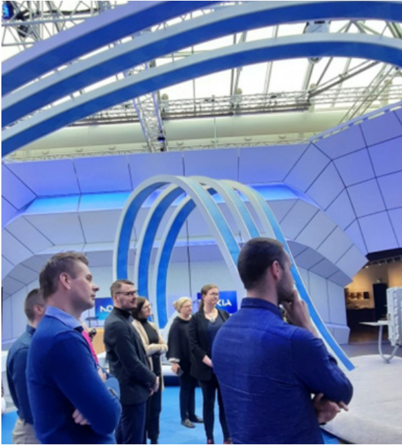
Uusi yrittäjäsukupolvi panostaa osaamiseen ja hyvinvointiin.

”Työmme on niin intensiivistä aivotyötä. Ei tule tulosta, jos tekee enemmän työtä ajallisesti. Työajan lisääminen ei lisää tehokkuutta ja tuottavuutta.”