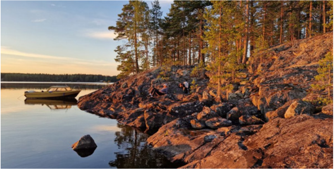
Ilmastoriskien hallinta on edellytys kasvavalle retkeilylle.

Hallitus tavoittelee Heinäveden Palokin padon purkua saimaanlohen ja -taimenen auttamiseksi viestittää Yle. 30 tuulivoimalan puisto näkyisi laajasti Kallavedelle – ”Näkyvyysalueella on myös muun muassa Riuttalan perinnemiljö” otsikoi Savon Sanomat. Nämä ovat pieniä mutta merkityksellisiä viestejä muutoksesta, jonka keskellä elämme.