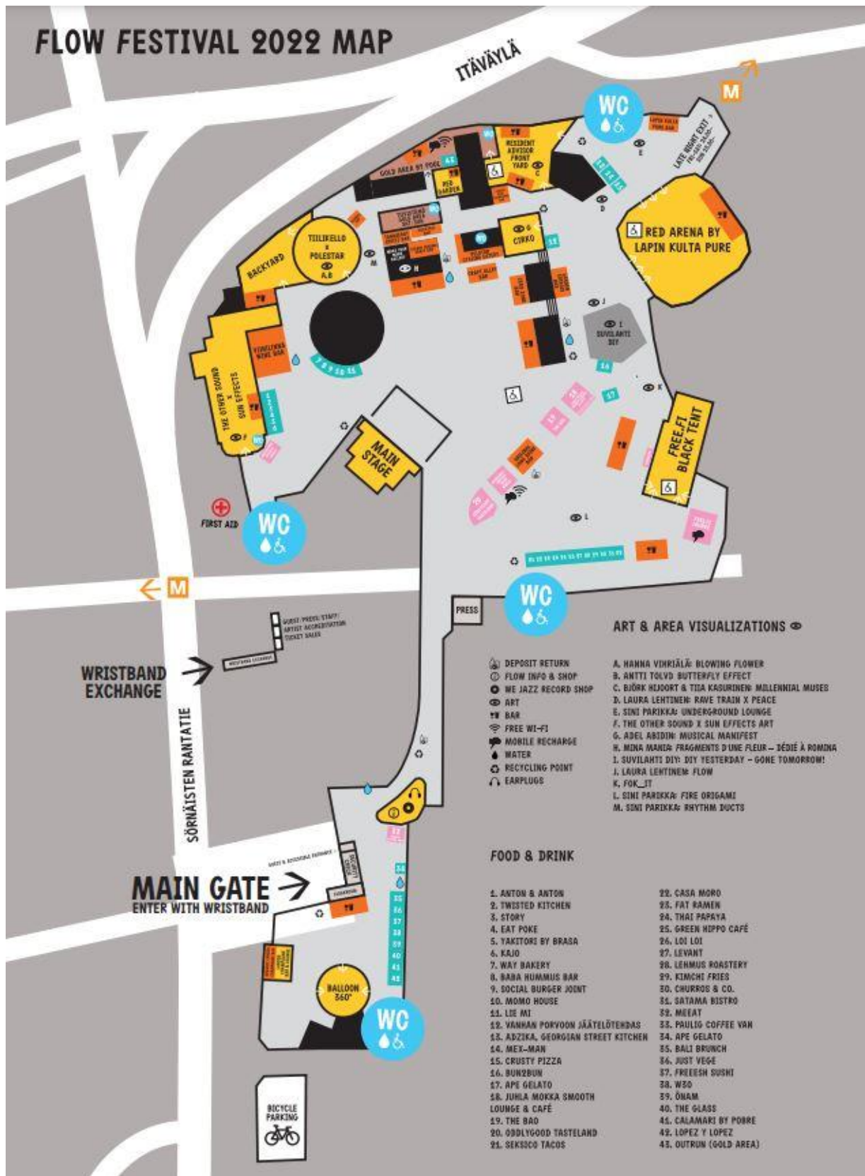
Kuva 2: Flow Festivalin aluekartta vuodelta 2022