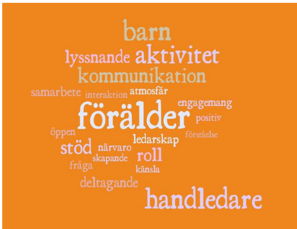
Figur 2 Ordmoln skapat av intervjuerna

Materialet som samlades in genom intervjuerna erbjöd värdefull information om hur de professionella ser på utmaningar och möjligheter med kommunikationen mellan förälder och barn. I nästa stycke presenteras centrala fynd och slutsatser av materialet som samlades in genom intervjuerna. Genom analysen kunde konkreta områden för förbättring identifieras för vidareutvecklingen av verktyget.