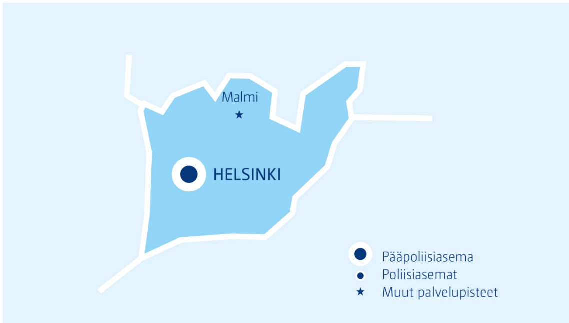
Kuva 2: Helsingin poliisilaitoksen aluekartta ( www.poliisi.fi )