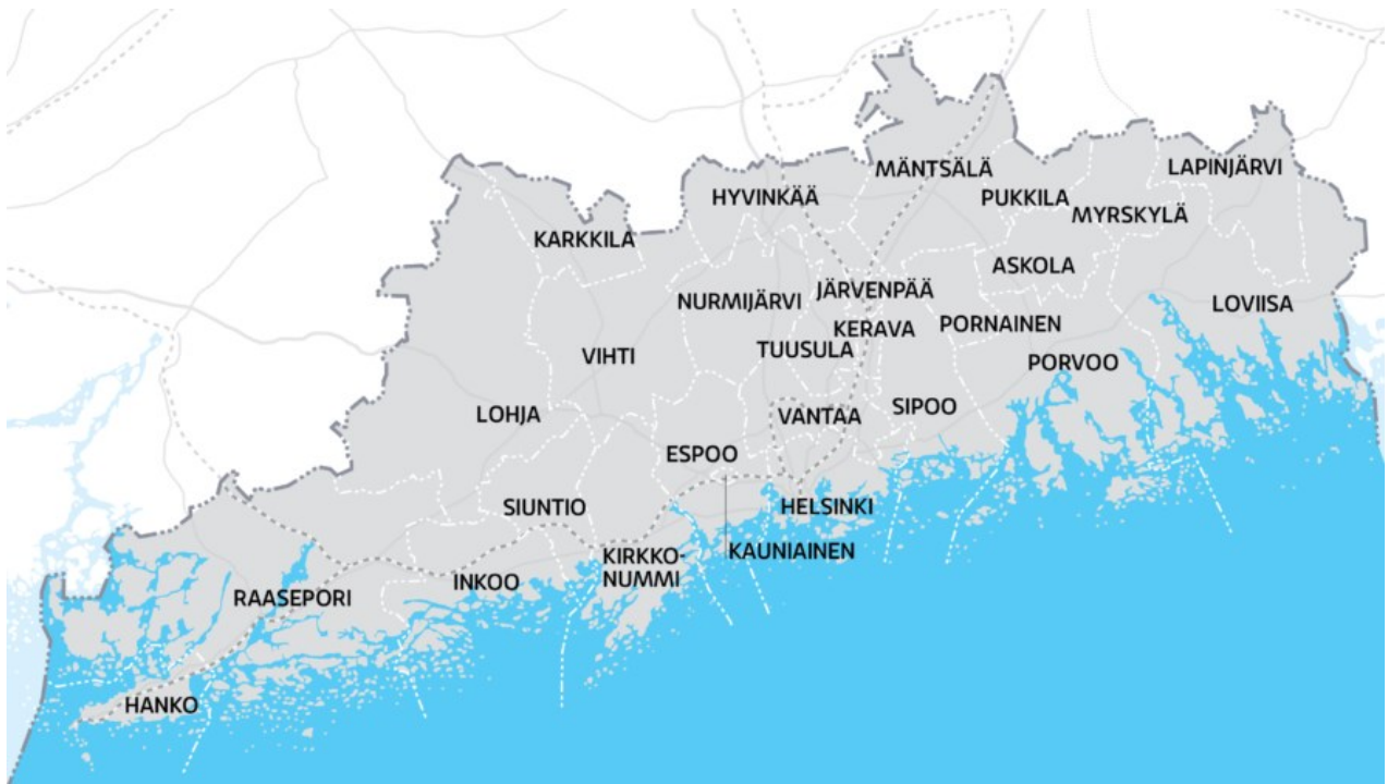
Kuva 1: Uudenmaan aluekartta ( www.uudenmaanliitto.fi )