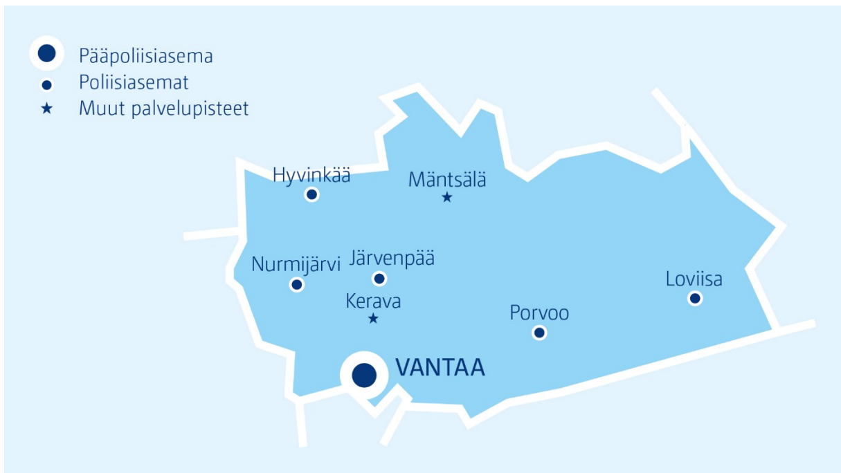
Kuva 4: Itä-Uudenmaan poliisilaitoksen aluekartta ( www.poliisi.fi )