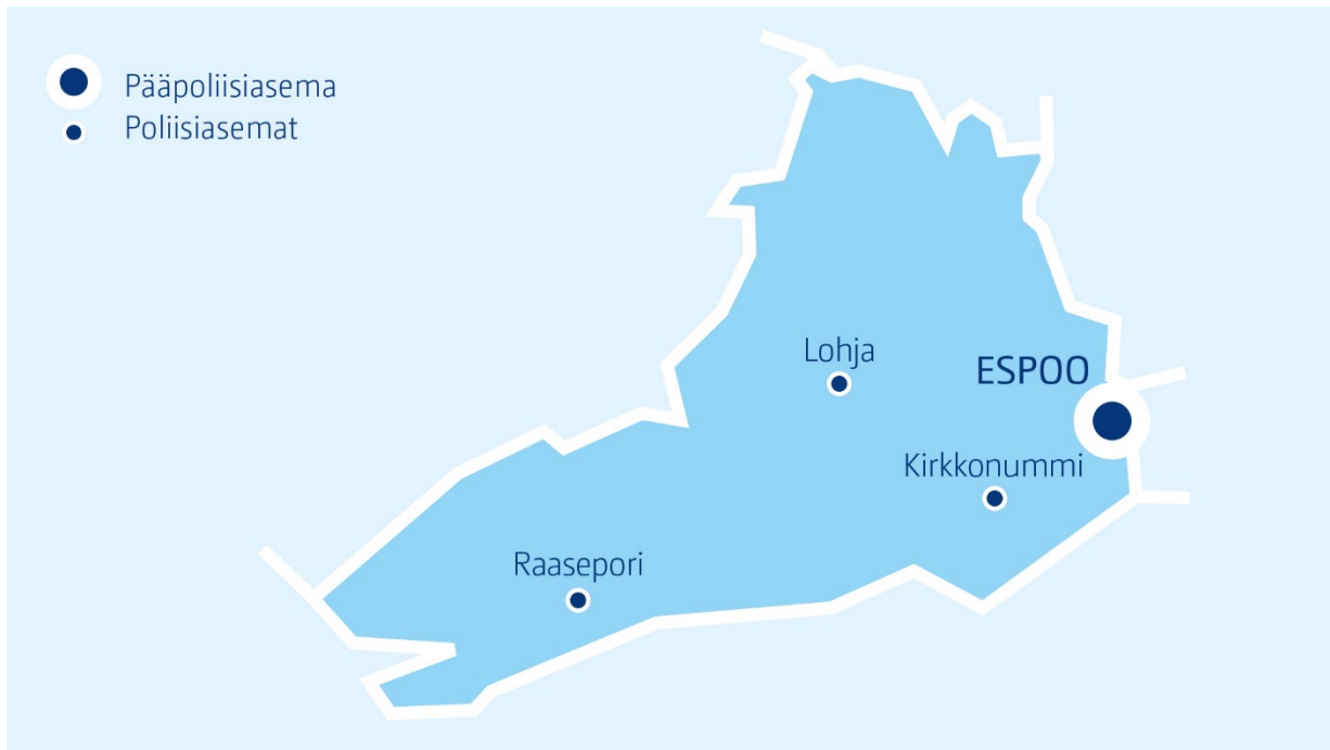
Kuva 3: Länsi-Uudenmaan poliisilaitoksen aluekartta ( www.poliisi.fi )