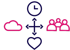
Kuvio 4 Työstä palautumisen edistäminen luontokokemusten avulla -toimintamallin visualisointi