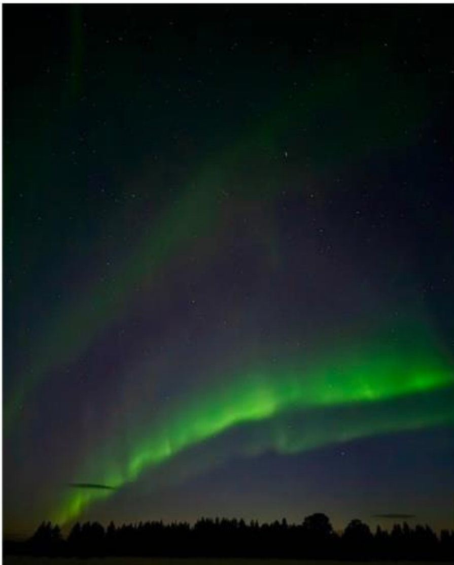
Kuva 7. Marko Halla