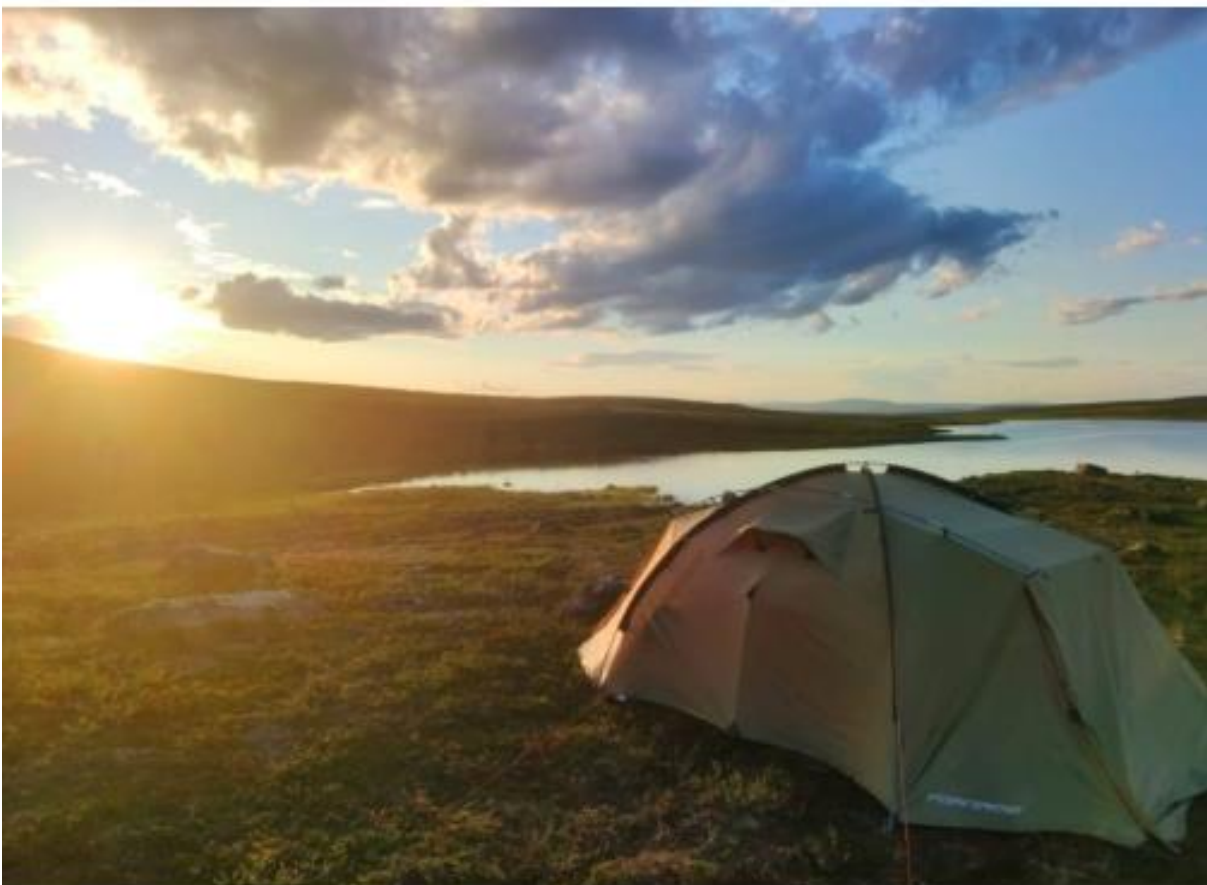
Kuva 1: Tino Jyränkö