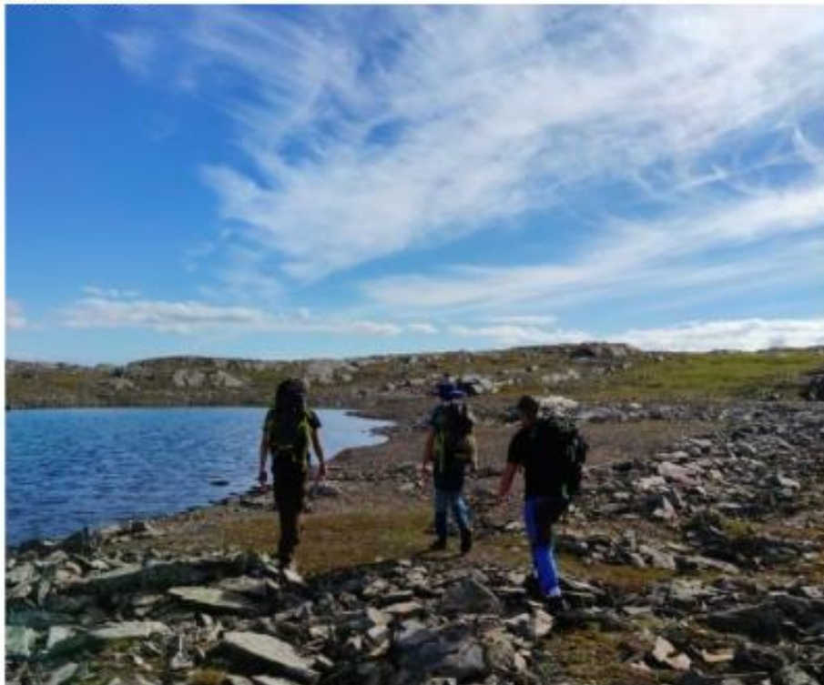
Kuva 4: Tino Jyränkö

Reitit: Suosituimmat reitit ovat Kalottireitti, joka on 108 kilometriä pitkä. Se kulkee Suomen läpi Norjan puolelle ja tarjoilee upeat yläkömaisemat, vesiputouksia ja antaa kokeneemmallekin vaeltajalle uutta haastetta. Toinen tunnettu reitti on ikoninen Hetta-Pallas. Tämä reitti kulkee läpi avotunturien ja reitillä korkeuserot vaihtelevat.