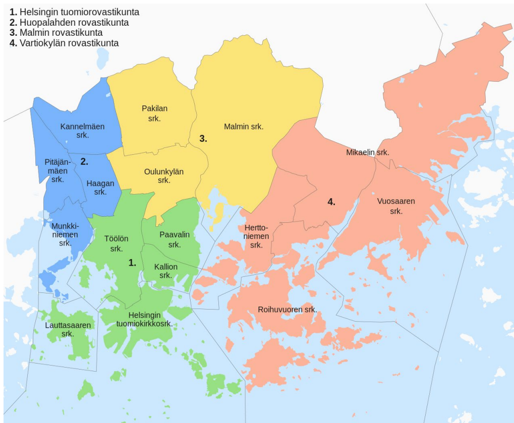
Kuva 1. Helsingin seurakunnat kartalla

Malmin seurakunnan nuorisotyön toimintasuunnitelmat vuosilta 2007–2021 osoittavat kehitystä ja muutosta nuorisotyön painotuksissa ja toimintatavoissa. 2007–2013 välisenä aikana keskityttiin erityisesti yhteisöllisyyden ja jäsenyyden tukemiseen. Nuorille haluttiin luoda positiivinen asenne kirkkoa kohtaan ja kannustaa heitä osallistumaan vapaaehtoisesti toimintaan. Tavoitteena oli saada nuoret kokemaan seurakunnan toiminnot kotoisiksi ja turvallisiksi. Tämä tapahtui henkilökohtaisen tervehtimisen, tutustumisen, sekä nuorten osallistamisen suunnitteluun ja toteutukseen kautta. Harrastusmahdollisuuksia tarjottiin musiikin, urheilun ja taiteen parissa. Myös seurakuntalaisten vastuunkanto ja vapaaehtoisuus olivat keskiössä, mukaan lukien nuorten osallistuminen messujen ja muiden hengellisten tapahtumien järjestämiseen. (Malmin seurakunta 2007; Malmin seurakunta 2008; Malmin seurakunta 2009; Malmin seurakunta 2010; Malmin seurakunta 2011; Malmin seurakunta 2012; Malmin seurakunta 2013.)