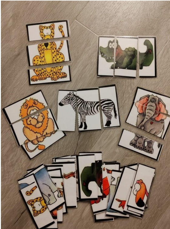
Kuva 5. Eläin palapelit.