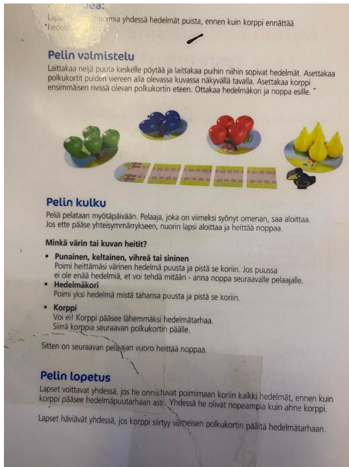
Kuva 2. Ohjeet mistä otettu mallia ihmislautapeliin.