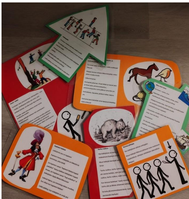
Kuva 6. Kuvallisia leikkikortteja.