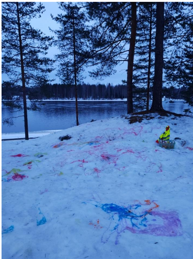
Kuva 1. Pulloväreillä tehtyä lasten taidetta.

Kuten teoriassa toimmekin esille leikin tärkeyden. Toiminnan kautta lapsi rakentaa itselleen mielikuvia. Lapsi itsenäisesti liikkuessaan muun muassa kokeilee, miettii syy-seuraussuhteita, testaa, harjoittelee sekä tekee johtopäätöksiä. Leikissä mukana on kaikki aistit ja tämän vuoksi niistä jää muistijälkiä. Näiden kautta uusissa tilanteissa ja eri asiayhteyksissä asioiden muistaminen sekä mieleen palauttaminen on helpompaa. Kisailut, leikit ja pelit herättävät tunteita. Yhteenkuuluvuuden tunnetta lisää ryhmään tai joukkueeseen kuuluminen, sekä harjaannuttaa säätelemään tunteiden ilmaisua. Näiden avulla leikistä saadaan toimivaa. Tasapanoisen vuorovaikutuksen edellytyksenä on lapsen kokemus tulla hyväksytyksi sekä kokee olevansa pätevä. Myös henkinen tasapaino on välttämätöntä. (Hujala & Turja 2011, 137–138.) Leikkiin kannustavassa toimintakulttuurissa ymmärretään leikin tärkeys lapsen hyvinvoinnille ja oppimiselle. Yhteisössä tuetaan kaikkien osallistumista kekseliäisyyteen, mielikuvituksen käyttöön, omaan ilmaisuun ja luovuuteen. Leikki saa olla näkyvää ja kuuluvaa, ja lasten leikkialoitteille annetaan tilaa, aikaa ja leikkirauhaa. Sekä lapsille että aikuisille mahdollistetaan keskittyminen leikkiin.