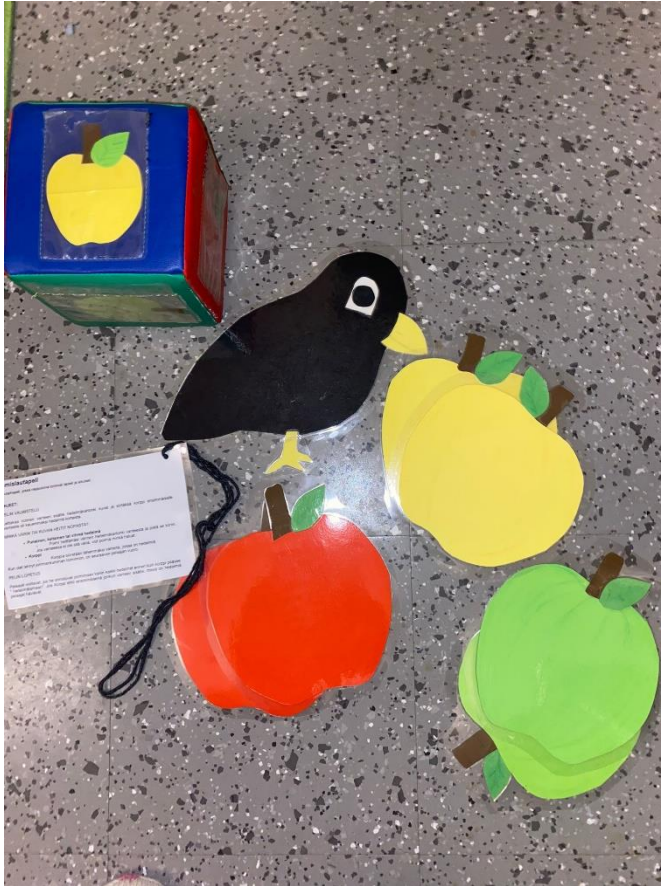
Kuva 3. Ihmislautapelin itse tehtyjä tarvikkeita.