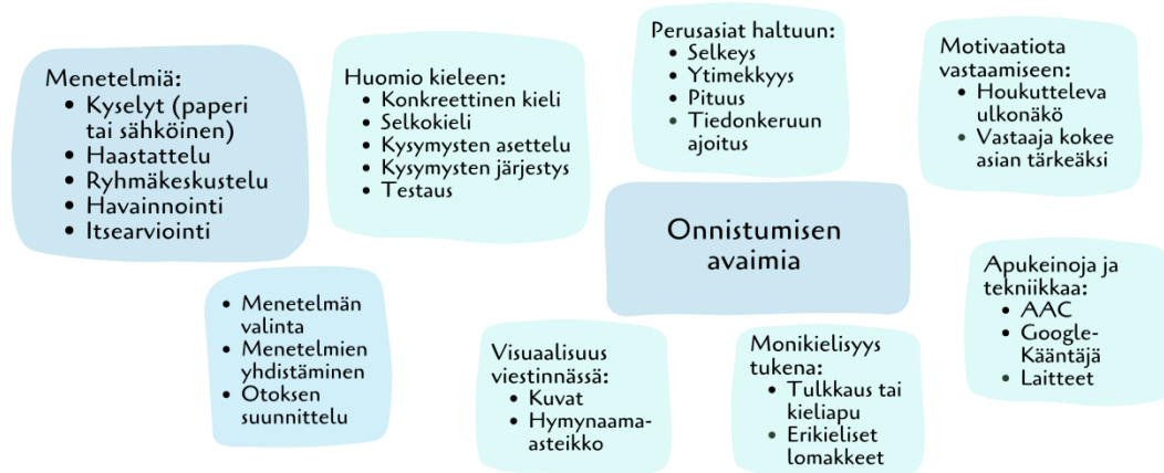
Kuvio 2. Onnistumisen avaimia tiedonkeruuseen

asiantuntijoista ilmausta asiantuntijat . Kuviossa 2 on koottuna keskeisiä tekijöitä, jotka tukevat onnistunutta tiedonkeruuta.