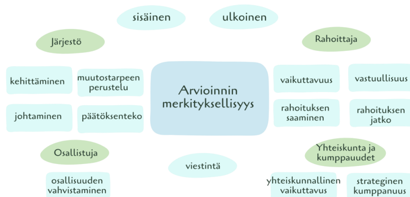
Kuvio 3. Arviointitiedon merkitys maahanmuuttajille toimintaa kohdentaville matalan kynnyksen järjestöille

Toinen tulosluku tarkastelee arviointitiedon keruun monitahoista merkityksellisyyttä maahanmuuttajille toimintaa tarjoaville matalan kynnyksen järjestöille. Arviointitiedon merkityksellisyyttä järjestölle ilmentää kuvio 3. Arviointitietoa voi tutkimusaineistomme perusteella käyttää järjestöissä monipuolisesti sekä sisäisiin että ulkoisiin tarkoituksiin. Arvioinnin taustalla tulisi olla vaikutusketjuajattelu (ks. esim. Bertelsmann Stiftung 2010, 20–22; Heliskoski ym. 2018, 5).