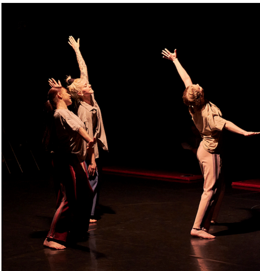
Kuva 5. Parvi muodostelma teoksessa. (Hintsala 2024)

Seuraavassa teoksen osassa tanssijat siirtyivät kohti parvi muodostelmaa (katso kuva 5) ja aloittivat kyseisen osuuden kopioimisella (katso kuvaus liite 1). Kopioimisen jälkeen teoksen ensimmäisen biisin vaihtuessa vähemmän rytmiseen kappaleeseen tanssijat aloittivat vähitellen toistensa varioinnin. Varioinnin aikana tanssijat liikkuivat tilassa runsaasti ja mallinsivat salin poikki liikkumista (katso liite 1). Yleisön ja tanssijoiden välinen etäisyys vaihteli tässä osiossa paljon. Ajattelin tämän osuuden hieman enemmän korostavan vuorovaikutteisuutta siinä, missä ensimmäinen osuus oli tarkoitettu valmistamaan tanssijoita katseen alla olemiseen.