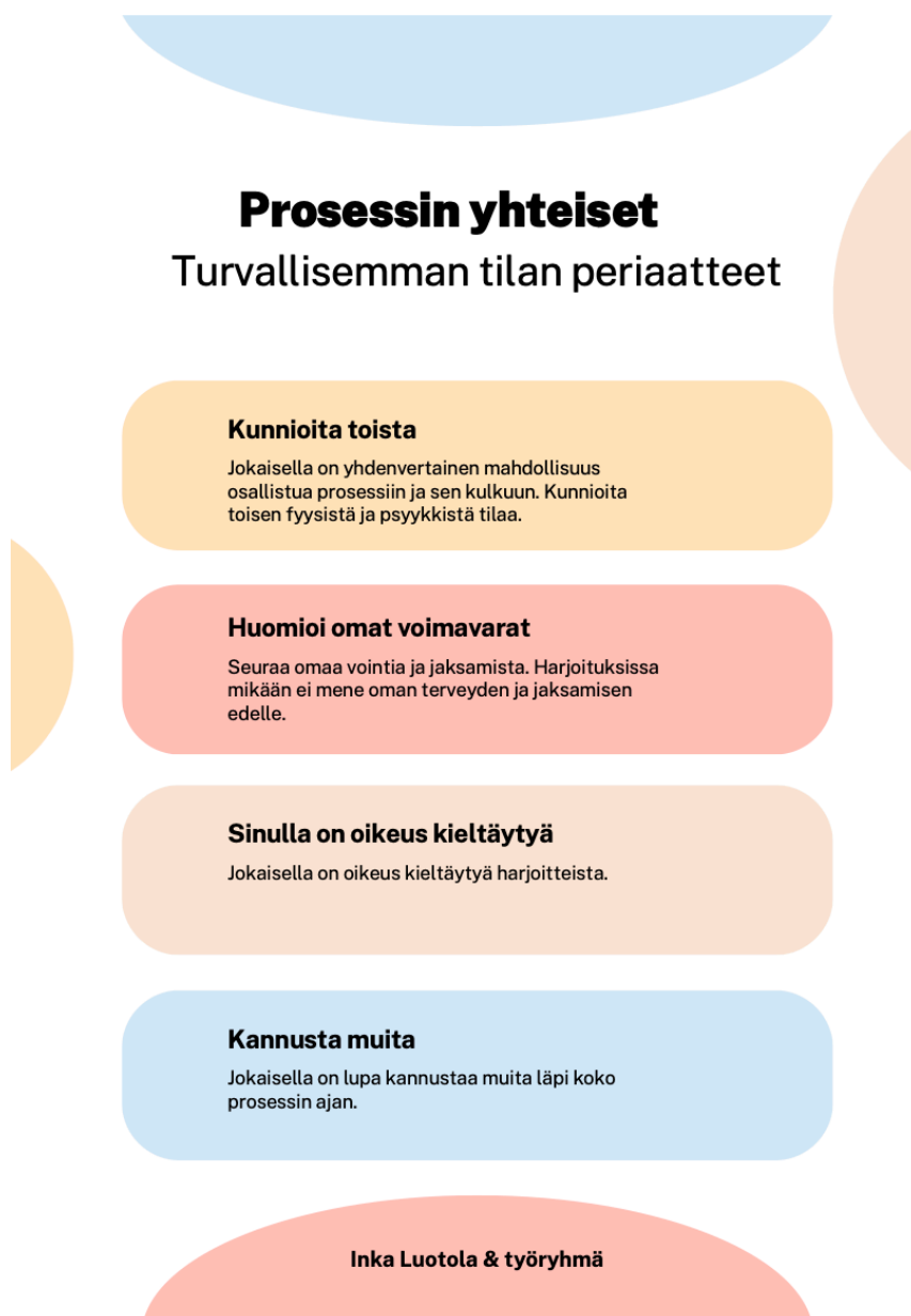
KUVA 2. Turvallisemman tilan periaatteet juliste. (Luotola 2024)

Koin yhteisten sääntöjen rakentamisen tärkeäksi välineeksi ehkäistä turvatonta ilmapiiriä harjoituksissa ja sen ulkopuolella. Ensimmäisissä harjoituksissa keskustelimme työryhmän kanssa toiminnan edellytysten kannalta tärkeitä näkökulmista ja loimme yhteiset säännöt. Olen luonut prosessin keskeisistä säännöistä ja turvallisemman tilan periaatteista myös julisteen (katso kuva 2). Halusin myös käydä yhteiset säännöt läpi ääneen. Vastavuoroisuus ja asioista keskusteleminen vahvistivat tunnetta siitä, että kaikki osalliset olivat sitoutuneet yhteisten sääntöjen noudattamiseen.