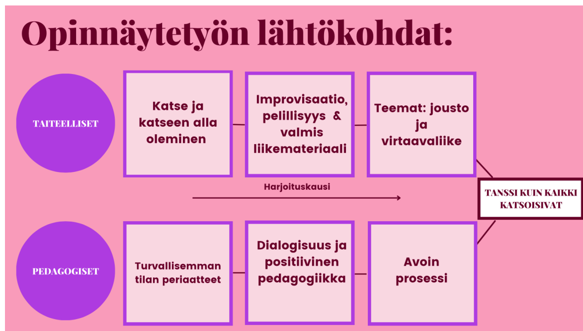
KUVA1. Opinnäytetyön lähtökohdat kaavio. (Luotola 2024)

Opinnäytetyöprosessin taiteelliset ja pedagogiset lähtökohdat tukevat toisiaan. Nämä kuvailemani lähtökohdat ovat yhdenvertaisessa asemassa suhteessa prosessiin ja sen toteutukseen. Olen luonut kaavion kuvaamaan näiden lähtökohdienten osatekijöitä suhteessa Tanssi kuin kaikki katsoisivat -teoksen syntyyn (katso kuva 1).