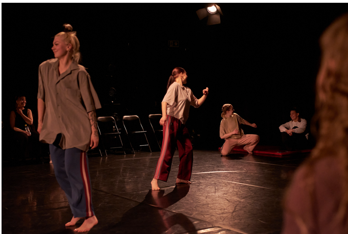
Kuva 6. Tanssijat ja katsojat ovat yhdessä katseen alla. (Hintsala 2024)

Neljännän osuuden tarkoitus oli avata tilaan mahdollisuus yleisön ja tanssijoiden väliselle leikille. Peelasimme yhdessä peilileikistä inspiroitunutta tanssipeliä (katso liite 1). Leikin tarkoitus oli nostaa esille se, kuinka kaikki samassa tilassa olevat ovat yhtä lailla katseen alla eikä vain ainoastaan teoksen tanssijat. Tanssijoiden pysähtyessä katsekontaktiin syntyi näiden ihmisten välille yhdessä jaettu hetki. Molemmat saivat kokemuksen kohtaamisesta yhdenaikaisesti (kuva 6).