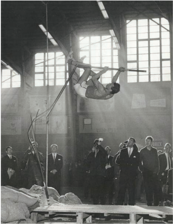
Kuva 9: Vuonna 1962 Hele kuvasi seiväshyppääjä Pentti Nikulaa hetkellä, kun seiväs katkeaa kahdesta kohdasta.

väkisin tarinallisuutta, ja spektaakkeleita. Medioista huomaa, että urheilun tylsä arki ei ole kuvaamisen arvoista (Mäkelä 2024).