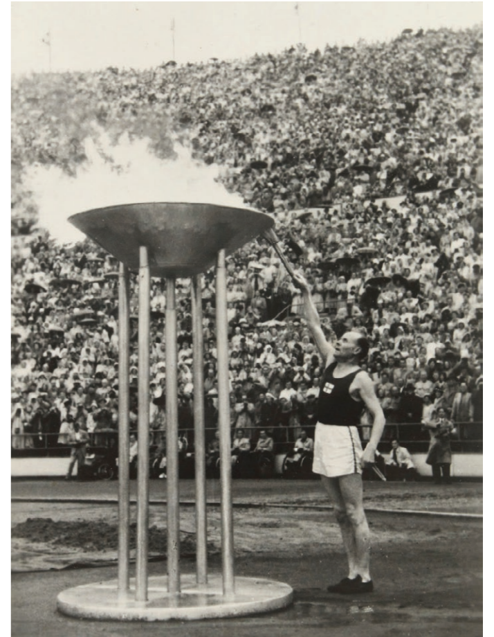
Kuva 6: Paavo Nurmi sytyttämässä olympiatulen Helsingin olympialaisissa 1952.

Helsingin Olympialaisten 1952 kynnyksellä lehtikuvaajat päättivät varsin laajamittaisesta yhteishankkeesta. Perustettiin Olympia Kuva oy, jonka tarkoituksena oli hoitaa kilpailujen kuvaukset lähes yksinoikeudella (Runeberg 1985, 102). Kuvaan perustuvaa taittoa alkaa Helsingin Sanomissa näkyä vasta Olympialaisten näyttävissä ja suurkuvaisissa raportoinneissa (Runeberg 1985, 48). Salamakuvaaja Nasa oli ainoa kuka onnistui ottamaan onnistuneen kuvan Paavo Nurmen sytyttäessä olympiatulen Helsingin Olympialaisissa (Runeberg 1985, 105).