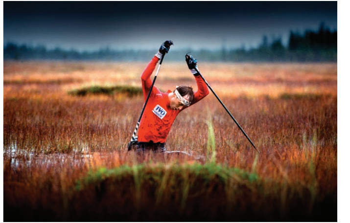
Kuva 12: Hannes Heikuran, Mika Myllylä.

Kiinnostava tarkastelun kohde on Hannes Heikuran ikoninen kuva hiihtäjä Mika Myllylästä juoksemassa suolla. Kuva on tietysti hyvin hieno ja täynnä tunnetta. Kuvassa hämää kuitenkin paita, jossa paistaa mainos. Urheilijat samaistuvat varmasti siihen, että yleensä harjoituksissa ei pidetä mainospaitoja päällä, jos ei tiedetä olevan kuvauksissa. Tässä onkin todella mietitty mitä halutaan näyttää. Kuvasta ei muuten näe missä kontekstissa se on tehty, mutta tutkimusaineistoni mukaan kuva on otettu mediatilaisuudessa, jossa oli useita muitakin kuvaajia paikalla. Aika hauskaa on ajatella, että yhden kuvaajan kuvasta tulee se ikoninen kuva.