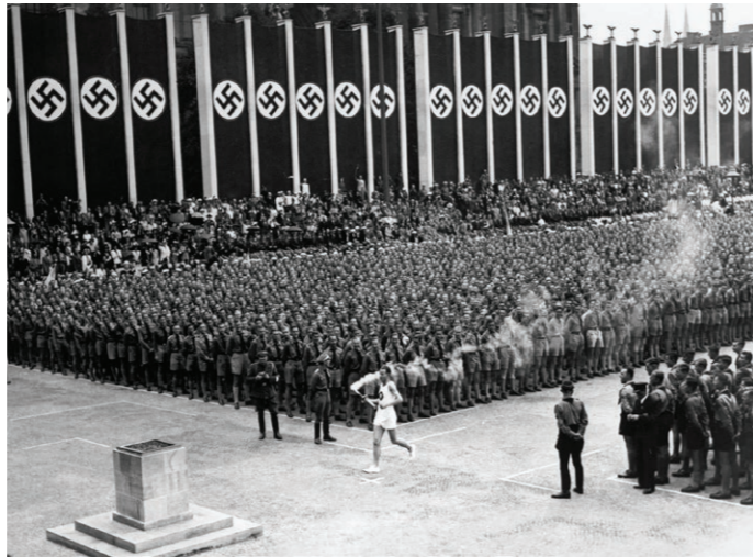
Kuva 5: Näyttävää Nazi-propagandaa Berliinin 1936 olympialaisten aikana.

ja tummaihoisia kohtaan, valokuvaajat eivät voineet sivuttaa muun muassa yhdysvaltalaisen Jesse Owens:in neljän olympiakullan saavutuksia (Wombell 2000, Race).