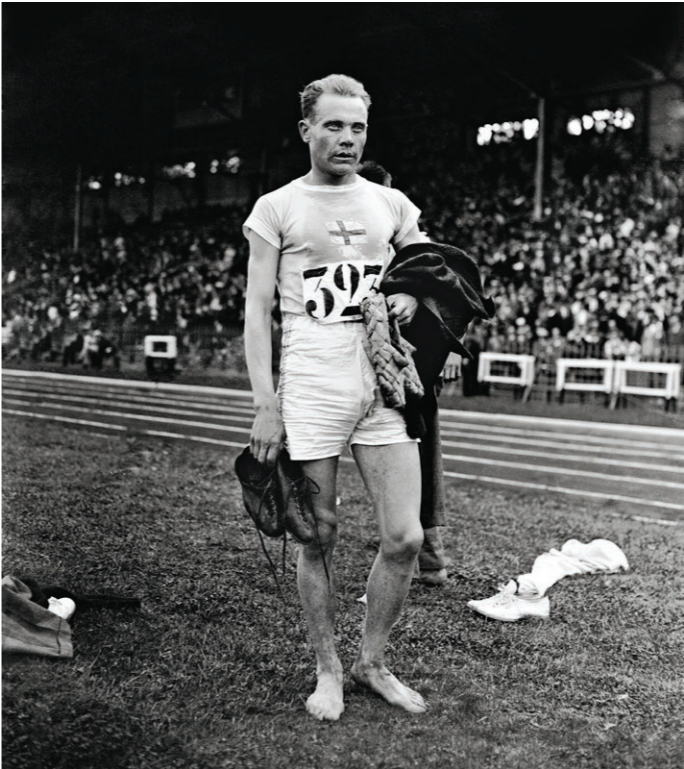
Kuva 4: Kenties kaikkien aikojen suomalainen urheilusankari; kestävyysjuoksija Paavo Nurmi.

Kansallislippujen värittämä kannustaminen pätee myös yleisurheilussa, mutta kannustus keskittyy yleensä yksittäisiin urheilijoihin, jolloin siitä tulee yksilökeskeisempää ja ei ehkä ihan yhtä fanaattisen isänmaallista kuin jääkiekossa. Urheilun estetiikka ylittää kansallisuusrajoja, koska säännöt, varusteet ja hallit ovat lähestulkoon samanlaisia maasta toiseen. Urheilusankarit, ovat sen sijaan kansallisia sankareita, ja heidän saavutuksensa liitetään vahvasti maiden kulttuuriperintöön. Yleisurheilu keskittyy nimenomaan poikkeuksellisiin yksilöihin, ja rakentaa yksittäisiä kansallisia urheilusankareita.