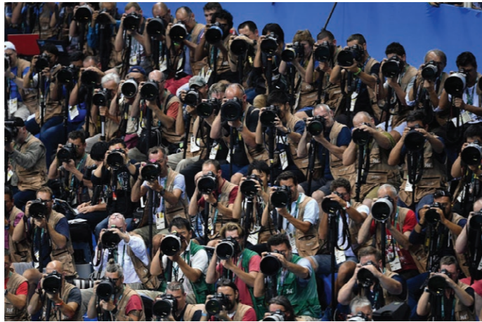
Kuva 11: Kymmeniä kuvaajia suuntaavat kameransa samaan suuntaan Rion Olympialaisten maakiintiöstä. Koivusen sanoin kuvaajat muodostavat "sopulilauman".

Arvokilpailuissa liikkuvan kuvan oikeudet ovat myyty isoille yhtiöille, joka jättää medioille vain mahdollisuuden keskittyä stillkuvamaiseen. Markku Niskasen mukaan akreditoituiden kuvaajat pitää edustaa jotain mediaa, jotta he voivat saada paikan maakiintiöstä (Niskanen 2024). Vesa Koivusen mukaan varsinkin yleisurheilussa näkyy kuvaajien rajattu määrä. Ainoastaan muutamat suurien kuvatoimistojen kuvaajat pääsevät sisäkentälle, ja joskus myös pieniä kuvausryhmiä päästetään kuvaamaan oman maansa urheilijoita. Kuvaajat eivät myöskään enää pääse vapaasti hakemaan kuvauspaikkoja, vaan kymmenien kuvaajien lauma ohjataan järjestäjän toimesta määrättyyn paikkaan, eli maakiintiöön. Kilpailujen mainostaulut asetetaan niin, että ne näkyvät kuvissa. Kyse on siis pitkälti rahasta, ja halutaan näyttää vain sitä, mikä on hyödyllistä järjestäjälle (Koivunen 2024).