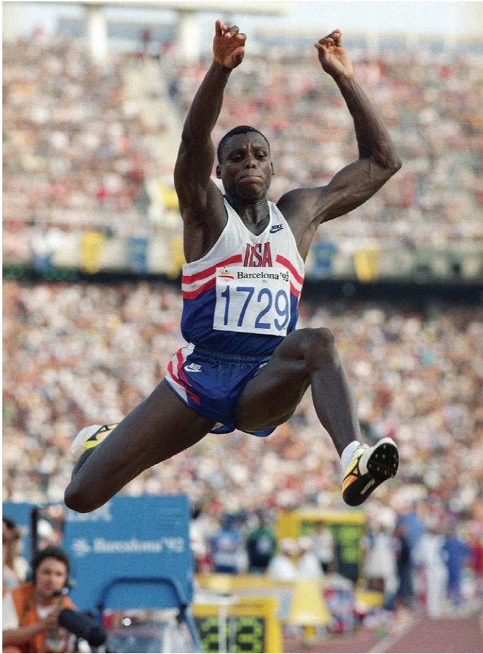
Kuva 7: Carl Lewis Barcelonan 1992 olympialaisissa, tyypillinen teleobjektiivilla otettu valokuva pituushypyssä.

Urheilukuvan genre on onnistunut luomaan, tai ehkä pikemminkin olosuhteiden takia päätynyt, luonteenmaiseen estetiikkaan. Koko viimeisen vuosisadan ajan valokuvaajat ovat pyrkineet löytämään tapoja päästä toiminnan ytimeen dokumentoimaan urheilusuoritusta. Teleobjektiivin auttoi ratkaisemaan tämän ongelman, ja tähän päivään asti yksi modernin urheilukuvan tunnusmerkeistä onkin juuri se, että valokuvaaja pystyy kuvaamaan kaukaa hyvin tiukasti rajattuja teräviä lähikuvia urheilusuorituksista (Wombell 2000, Telephoto).