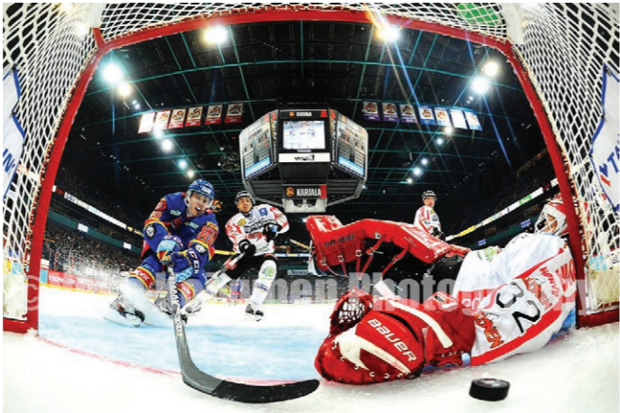
Kuva 10: Jääkiekkomaalista otettu kuva remotekameralla.

Jääkiekon arvokisoissa on myös vakiintunut tapa asettaa kamera maalin sisään. Koska maalissa ei ole paljon tilaa kameroille, yleensä valokuvaajat jakavat kuvat yhdestä kamerasta. Vesa Koivunen kertoo kirjassaan, että kuvaajilla on oltava mukanaan kisojen kuvapäällikön hyväksymä kameralaatikko, jolloin he saavat osallistua ‘pooliin’, eli kuvien jakamiseen. Yleensä kameran asentaa joku isojen kuvatoimistojen henkilö, joka saatetaan ratkaista kivi, paperi, sakset-pelillä. Kuvia ei tällöin saa arkistoida, joka tekee sen paremmaksi jos kuvat olisi omalla kameralla kuvattuja (Koivunen 2013, 121).