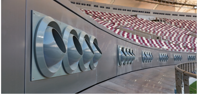
Kuva 3: Dohan Khalifan ulkostadionin ilmastointilaitteet.

Dohassa lämpötilat nousivat kilpailujen aikana noin neljäänkymmeneen asteeseen. Siitä urheilijoiden ei kuitenkaan tarvinnut huolia, sillä koko ulkostadion oli ilmastoitu, ja siellä oli mukavat kaksikymmentäviisi astetta. Dohan stadion on vain yksi esimerkki, sillä jokaisiin olympiakilpailuihin rakennetaan uusia stadioneita, urheilukenttiä ja halleja. Nämä rakennukset ovat tietysti usein upeita, arkkitehtuurisia mestariteoksia, ja sen mukaan myös tärkeää kulttuurista perimää. Tulisi kuitenkin miettiä, minkälaisia päästöjä tai muita haittoja aiheutamme stadionien ja urheilijakylien rakentamisessa yksiä kilpailuja varten. Esimerkiksi Rion Olympialaisten aikana raivattiin suuria slummeja pois tieltä, jotta saatiin tilaa urheilukentille. Sitä paitsi monet Olympialaisia varten rakennettuja kompleksit seisovat tänä päivänä tyhjillään käyttämättömänä. Kirjassa Sportscape puhutaan näiden rakennuksien suuremmasta pelisuunnitelmasta. Urheilu ja arkkitehtuuri voivat luoda kaupungeille uutta identiteettiä, joka osoittaa vaurautta, luottamusta ja tulevaisuutta (Wombell 2000, Strange buildings)