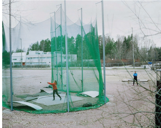
Kuva 13 & 14: Akseli Valmusen sarjasta: Who's the Winner