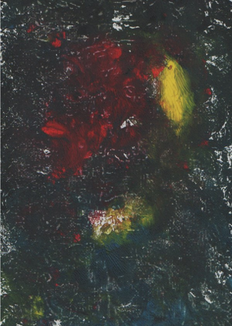
Kuva 10. Piru ilmestyi työhön (Takkala 2022).

Katsoessani valmiita töitäni saatoinkin huomata siellä hahmoja, joita en ollut sinne suunnitellut (kuva 10). Töihin tuli sattumalta ahdistavuutta, sattumalta iloa kuvioiden ja värien myötä. Teoria oli kuitenkin värimaailman lähtökohtana tunteille. Sillä tiesin eri värien ja väriyhdistelmien aiheuttavan eri tunteita. Pelkän sattumaan ei työskentelyni nojannut vaan nojasi vahvasti tutkittuun tietoon värien vaikutuksesta mieleen ja tunteisiin.