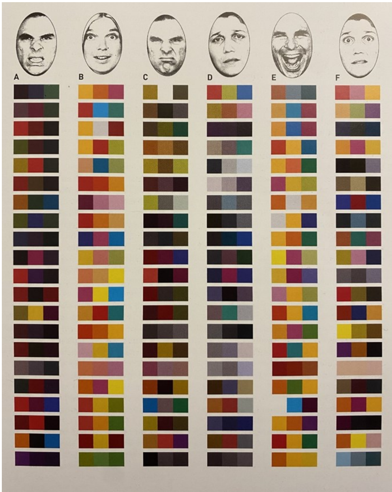
Kuvio 2. Kolmen yhdistelmän värin tulokset liitettyinä emootioihin (Arnkil, 2021, s. 269). A. viha, B. yllättyneisyys, C. inho, D. suru, E. ilo ja F. pelko.