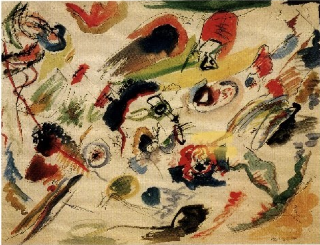
Kuva 1. Kandinskyn maalama abstrakti teos. Wassily Kandinsky Untitled 1910, (Tio Bellido, 1998, s. 65).

ollut vielä valmis ottamaan vastaan kritiikkiä vaan halusi välttyä tältä piilottamalla suurelta yleisöltä työnsä.