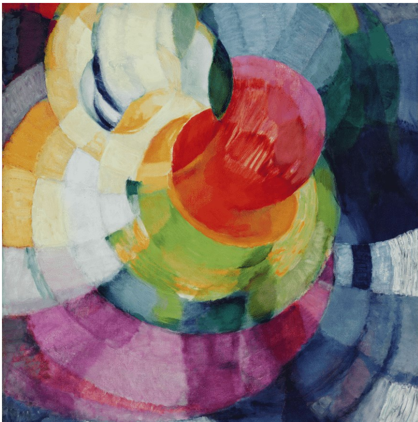
Kuva 2. Kupkan maalaama teos. Frantisék Kupka, Dicks of Newton. 1912. (Müller-Westermann, I., 2020, s. 33).

abstraktintaiteen esittäjäksi viitoitti musiikki (kuva 2). Hän halusi tuottaa taiteellisesti jotakin “näkemisen ja kuulemisen väliltä”. Kupka ei tavoitellut abstraktiota kubismin kautta, vaan kehitti oman tyylinsä intuitiivisesti ajatuksenaan musiikin yleismaailmallisuus. Frantisék Kupka on kertonut luovansa kuviot väreillä, kun taas säveltäjä Bach loi sen sävelin.