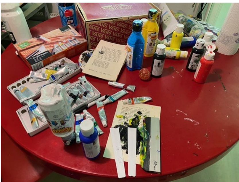
Kuva 9. Työpöytä työskentelyn jälkeen (Takkala 2023).

Taidetyöskentely oli useimmiten monen tunnin työrupeama. Se vei mennessään sekä ajan että tilan (kuva 9). Vedoksia oli pöytätasot täynnä, jolloin täytyi jopa ripustaa erillinen naru, johon pystyin pyykkipojilla ripustamaan töitä kuivumaan. Töiden tekeminen oli todella antoisaa, varsinkin pyrkiessäni saavuttamaan niihin tunnetiloja, jotka saattaisivat vastata muidenkin tunnetiloja. Oli kiehtovaa tehdä töitä, koska tekniikka ei raamittanut töitä tarkasti vaan sattuma oli koko ajan läsnä työskentelyssä. Monotyyppitöissä värin tarttuminen arkille on sattumanvaraista – työt ovat siis osin sattuman tulosta.