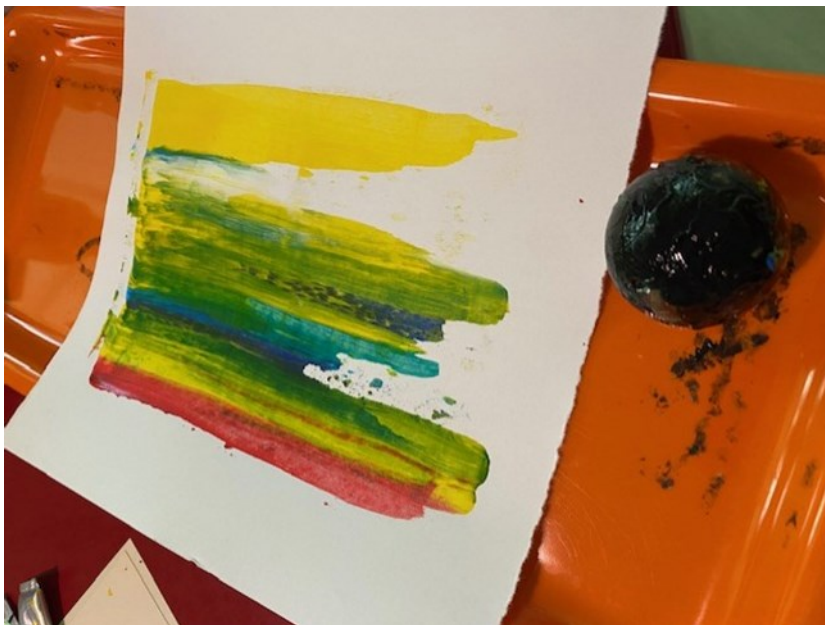
Kuva 7. Monotypiateos, joka on toteutettu akryyliväreillä. Vieressä on mustassa akryyliväriä pyöritelty pallo (Takkala 2023).

Pääosa alustavista töistä on siis monotypia töitä, mutta osaa teoksista jatkoin jälkeenpäin lisäämällä kuviointia (kuva 7) joko maalamalla siveltimellä tai käyttämällä erilaisia ei-maalauvälineitä pinnan teossa, kuten luottokorttia, ruiskuja ja teräviä piikkejä. Nämä työt eivät enää olleet monotypiatöitä vaan ne muuttuivat käsittelyn myötä sekatekniikkatöiksi (kuva 8).