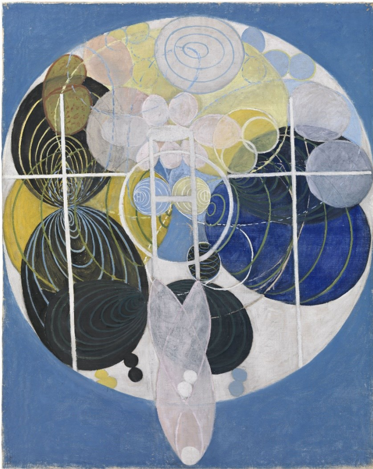
Kuva 3. Af Klintin maalaama teos. Hilma af Klint, The Large Figure Paintings, No. 5, The Key to all Works, 1907. (Müller-Westermann, I., 2020, s.21).

taas František Kupkan mielestä modernintaiteen tekijän on hyvä ymmärtää tieteellisiä tosiasioita, hän oli itsekin opiskellut biologiaa ja muita luonnontieteitä. Hän on sanonut mm., ettei voi ymmärtää modernia taiteilijaa, joka ei osaa käyttää mikroskooppia ja kaukoputkea. Taiteen tekeminen ei hänen mielestään ollut pelkkää teknisen ja historiallisen tiedon hallintaa vaan moderniin taiteen tekemiseen tarvitaan myös älyllistä ymmärrystä (Ateneum, 2018, s.91).