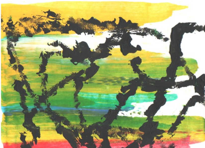
Kuva 8. Sekatekniikkatyö (Takkala 2023).