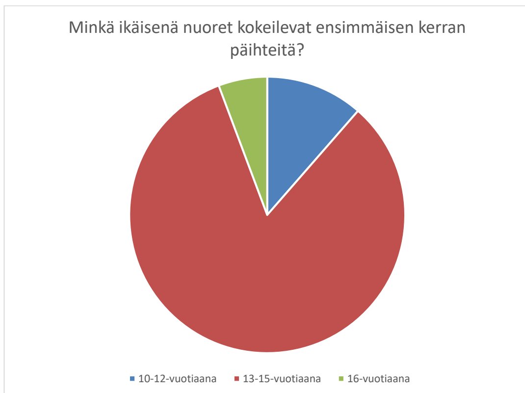
Kuvio 2. Minkä ikäisenä nuoret kokeilevat ensimmäisen kerran päihteitä?

Nuorten mielestä yleisin ikä päihdekokeiluille oli 13. Erityisesti yläasteikäisten keskuudessa päihdekokeilut ovat ajankohtaisia. Poikkeuksiakin löytyi, nuorimmillaan päihdekokeiluja tapahtuu vastausten perusteella jo ennen yläasteelle menoa, alimmillaan 10-vuotiaana. Korkein esiin noussut ikä päihdekokeilujen aloittamiselle vastauksissa oli 16 vuotta.