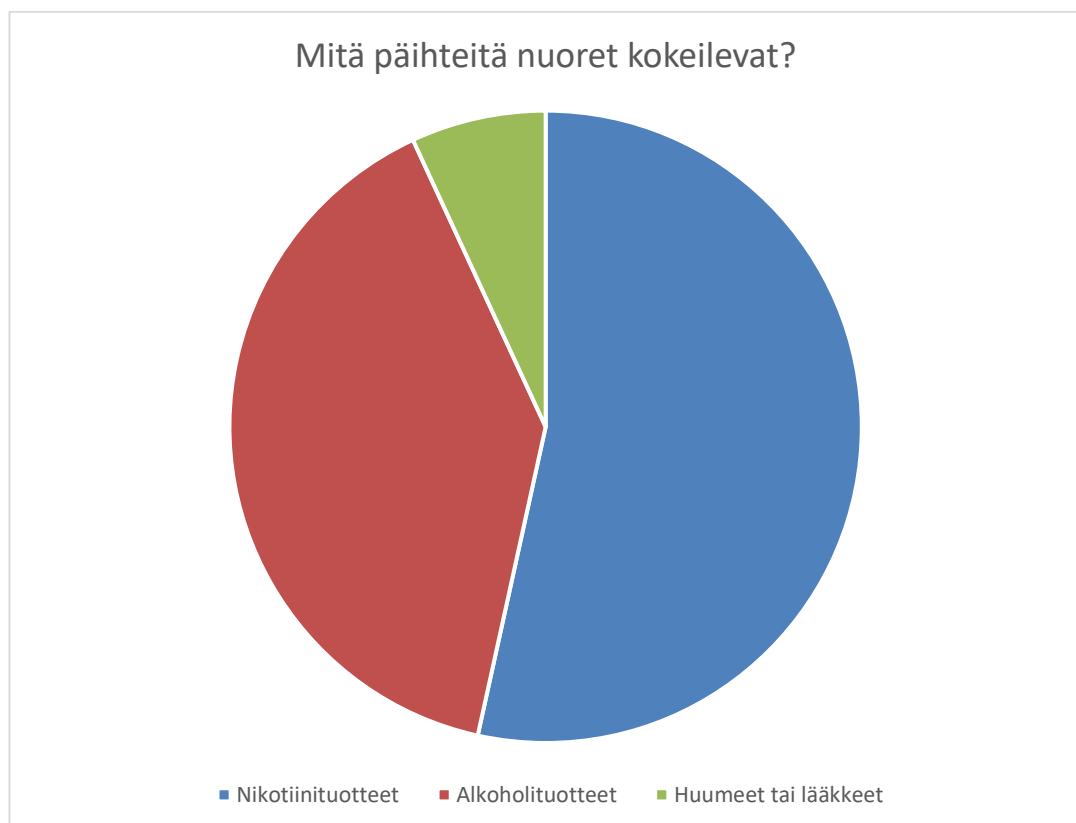
Kuvio 1. Mitä päihteitä nuoret kokeilevat?

Nuoret kertoivat vastauksissaan siitä, mitä päihteitä nuoret kokeilevat. Kysymys oli monivalintakysymys, jossa vastausvaihtoehtoina olivat nikotiinituotteet, alko- holi ja huumeet tai lääkkeet päihdyttävässä tarkoituksessa. Vastauksissa sai valita useamman kuin yhden vaihtoehdon. 31 vastaajaa kertoivat, että nuoret kokeilevat nikotiinituotteita. Alkoholi oli valittu 23 kertaa ja huumeet sekä lääkkeet päihdyt- tävässä tarkoituksessa 4 kertaa.