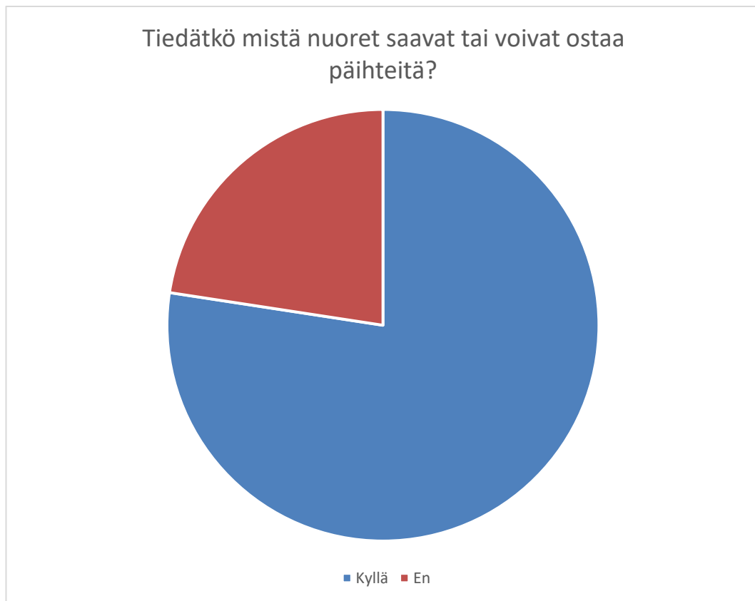
Kuvio 3. Tiedätkö mistä nuoret saavat tai voivat ostaa päihteitä?

Nuoret ovat tietoisia siitä, mistä voivat ostaa tai saada päihteitä. 24 vastaajaa kertoi tietävänsä mistä voivat saada tai ostaa päihteitä. 7 vastasivat kysymykseen kieltevästi. Kysymykseen oli vastannut vain 31 nuorta, eli yksi vastaajista oli jättänyt vastaamatta.