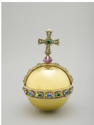
Kuva 7. Valtakunnanomina

Tavoitteena on epäsuorasti käyttää valtaesineitä sekä niiden vastineita luomaan ristiriitaista tunnelmaa. Haluan teoksilla purkaa vanhentuneita ajatuksia kääntämällä valta-asema pääläelleen ja tavoitella vallan tasaisemman jakautumisen kuvaamista. Symbolien, elokuvien viittausten sekä naisen aseman tulkitsemisen myötä opinnäytetyöni taiteellisen osuuden täysi ymmärtäminen vaatisi katsojalta äärimmäisen paljon medialukutaitoa ja taustatietoa spesifeistä aiheista. Haluan myös teoksieni olevan vapaatulkintaisia eikä liiakseen mitään tiettyä agendaä alleviivaavia.