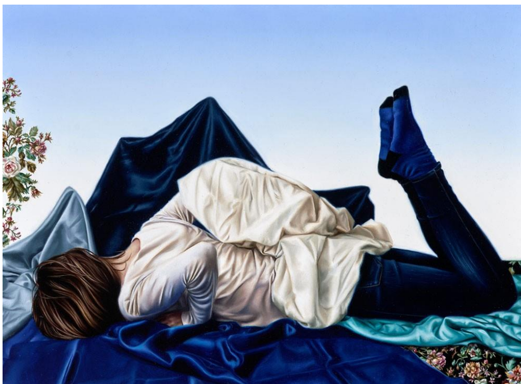
Kuva 5. Natasha Bieniek, ” Glacier ”, 2014, öljymaalaukseen puulle (Bieniek 2014)

Bieniekin tarkka ja todellisuutta imitoiva materiaalin kuvaamisen tyyli on valloittavaa ja lisää teoksen vaikuttavuutta. Bieniekin teoksien kautta inspiroiduin käyttämään teoksissani naishahmojen kasvojen peittämistä visuaalisena voimakeinona. Teoksen vaikutuksesta haluan kuvata maalaukseni hahmoa ja ympäristöä enemmän todellisuutta kuvastamalla tavalla kuin aiemmassa taiteessani.