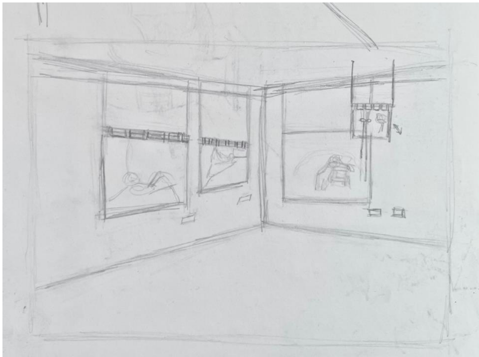
Kuva 13. Lyijykynäluonnos näyttelyn ripustuksesta

pyörylistaa, joka täytti kriteerini ripustusta varten. Leikkasin, hioin ja maalasin pyörylistat valkoiseksi, jotta ne olisivat mahdollisimman yksinkertaiset ja huomaamattomat.