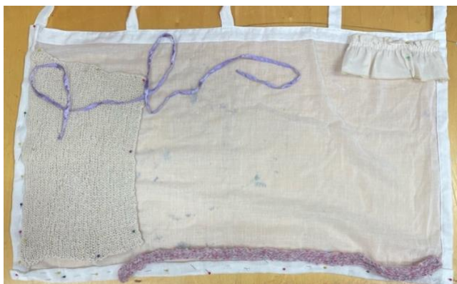
Kuva 8. The Dream Girl I teoksen sommittelua

Käytin rypyttettyä yksityiskohtaa kuvastamaan verhoa ja ikkunaa teoksen oikeaan yläkulmaan, sekä kangaslangasta virkattua palaa viitteellisenä mattona kuvastamaan lattiaa teoksen vasemmassa laidassa (Kuva 8). Tekstiiliteoksissa koen materiaalien kautta työskentelyn ominaiseksi ja kiinnostavaksi lähestymistavaksi.