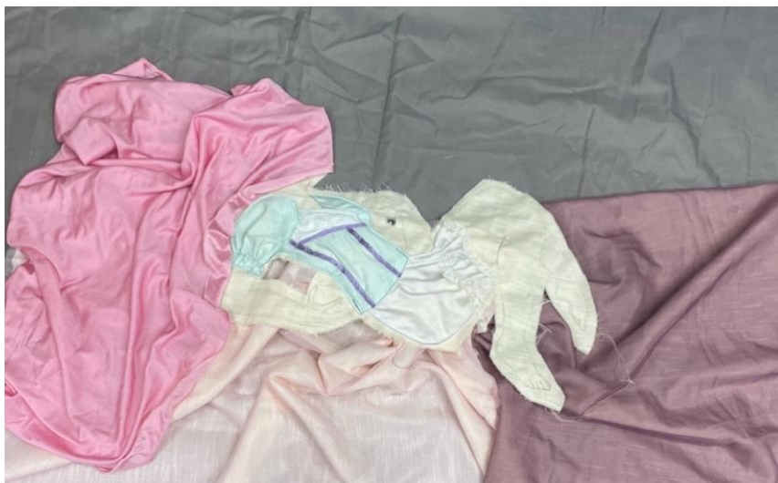
Kuva 11. The Dream Girl teossarjan sommittelua

hyödyksi ja kuvata teoksieni naishahmot sen mukaisesti, mutta epämukavassa tilanteessa. Halusin kuvata teoksissani naishahmoja niin kuin ne esiintyvät elokuvissakin ja millaisina esikuvina ne nuorille naisille tarjotaan. Tarkoituksellisesti näitä normeja vastaan menevällä taiteella on aikansa ja paikkansa sekä on varmasti oikeassa tilanteessa hyödyllistä. Koen sellaisen taiteen, joka yrittää tarkoituksen mukaisesti mennä kauneusihanteita vastaan omalla tavallaan enemmän kitsch-tyyliseksi kuin voimaannuttavaksi.