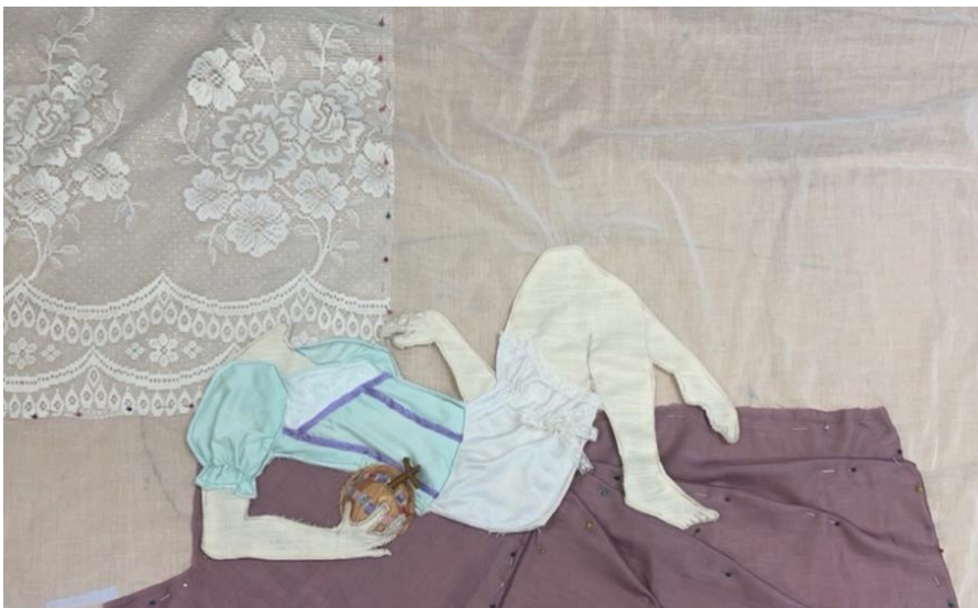
Kuva 12. The Dream Girl teossarjan ompelua