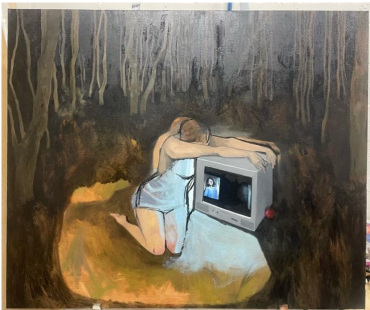
Kuva 10. The Final Girl maalaus keskeneräisenä

maalaamista asetelmasta tai elävästä mallista, mikäli sille tulee mahdollisuus. Tuntui kummalta yrittää pakottaa keksittyä sommitelmaa, joka ei pohjautu mihinkään oikeaan tilanteeseen, realistiseksi tai todellisuutta imitoivaksi. Mielikuviin pohjautuva taiteen tekemisen tapani rajoittaa todellisten tilanteiden kuvaamista, mutta myös tekee niistä omanlaatuisia. Epätodellinen valotustilanne tukee aihettani tuomalla maalaukseen haluamaani jännitettä, jota myös lähteenä käyttäneissäni kauhuelokuvissa on.