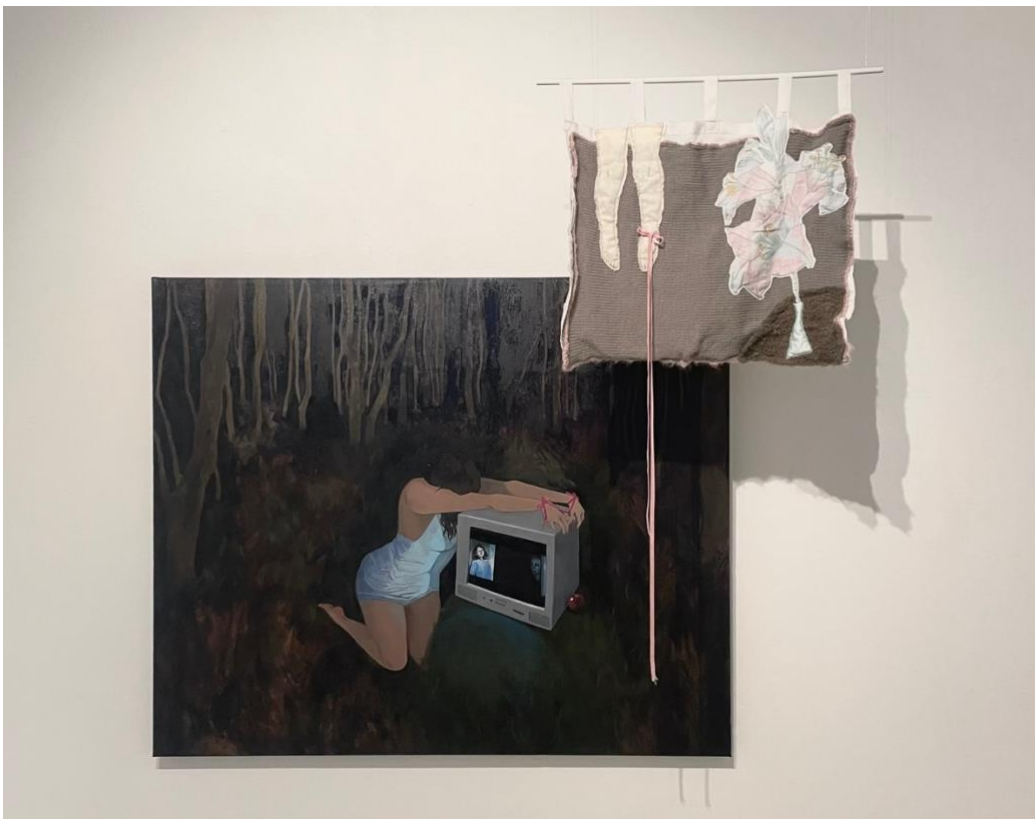
Kuva 14. Reetta Huuskonen, "The Final Girl", öljymaalaus kankaalle, 120 cm x 100 cm, 2024 & "The Dream Girl II", kierrätystekstiili, 60 cm x 105 cm, 2024