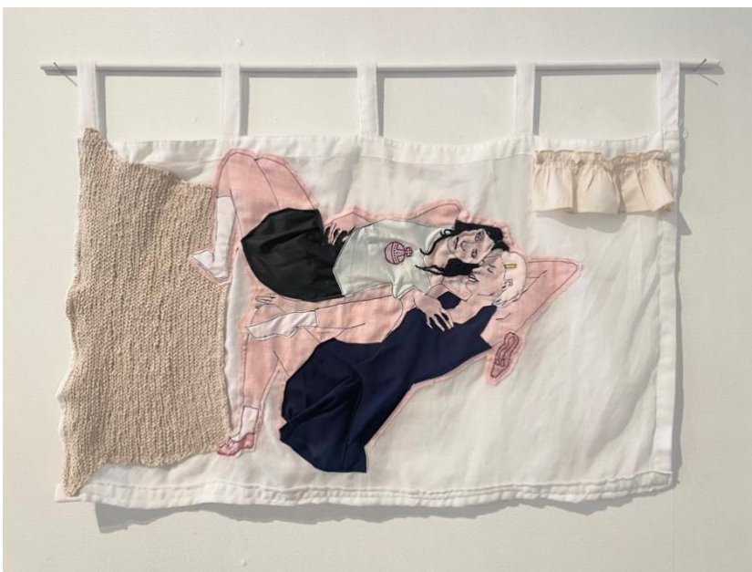
Kuva 15. Reetta Huuskonen, "The Dream Girl I", kierrätystekstiili, 85 cm x 55 cm, 2023