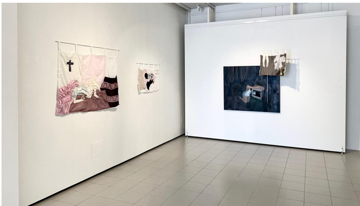
Kuva 17. Reetta Huuskonen, yleiskuva näyttelystä