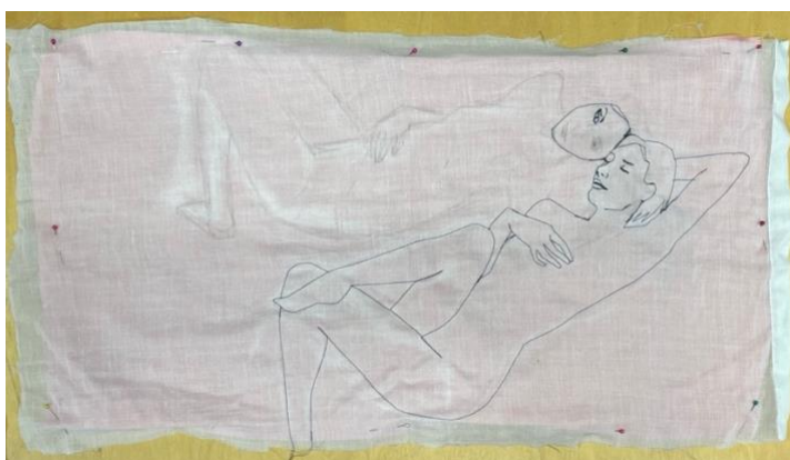
Kuva 9. The Dream Girl I teoksen naishahmojen ompelemista

läpikuultavasta valkoisesta kankaasta. Ompelin käsin ja ompelukonetta käyttäen piirustukseni viivoja seuraten (Kuva 9). Tekniikka oli aluksi aikaa vievää ja yksityiskohdissa haastavaa, mutta jälki nopeutui ja parani mitä enemmän tein saman tyylistä ompelua. Oppimiskynnyksen jälkeen tunsin tämän tekstiilin työstämisen tavan omakseni ja halusin tehdä lisää samankaltaisia teoksia. Naishahmojen ääri viivojen ompelemisen jälkeen lisäsin yksityiskohtia kuten vaatetusta ja asusteita löytämälläni kankailla. Kun naishahmot olivat valmiit, leikkasin ne kankaasta irti ja liitin ne verhokangas pohjaan, jonka olin aiemmin tehnyt.