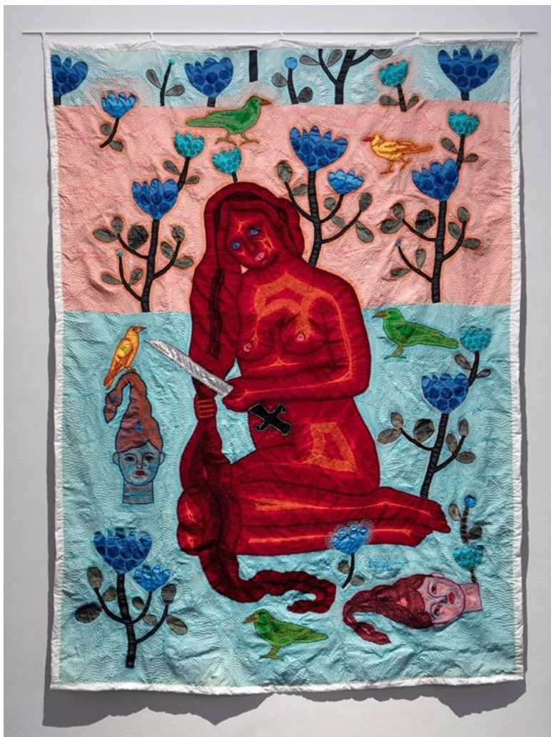
Kuva 4. Kholod Hawash, "Wild Song", 2022, käsin ommeltu kangas, 300 cm x 200 cm (Hawash 2022)

Taistelu naisten oikeuksien puolesta taiteen avulla on itsellenikin tärkeä arvo. Haluan opinnäytetyölläni tuoda esille naisille asetettuja odotuksia ja niiden vaikutusta naisten asemaan yhteiskunnassa. Tekstiilitaide on oiva väline tuoda esille yhteiskunnan epäkohtia ja yleisiä vääryyksiä naisten asemaan liittyen.