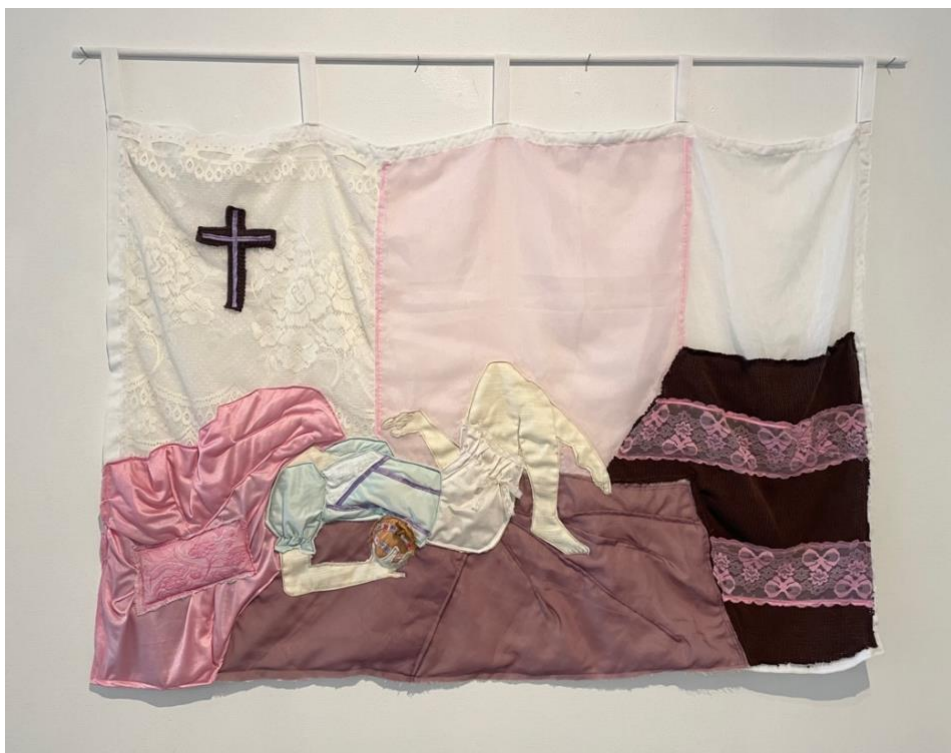
Kuva 16. Reetta Huuskonen, "The Dream Girl III", kierrätystekstiili, 125 cm x 90 cm, 2024