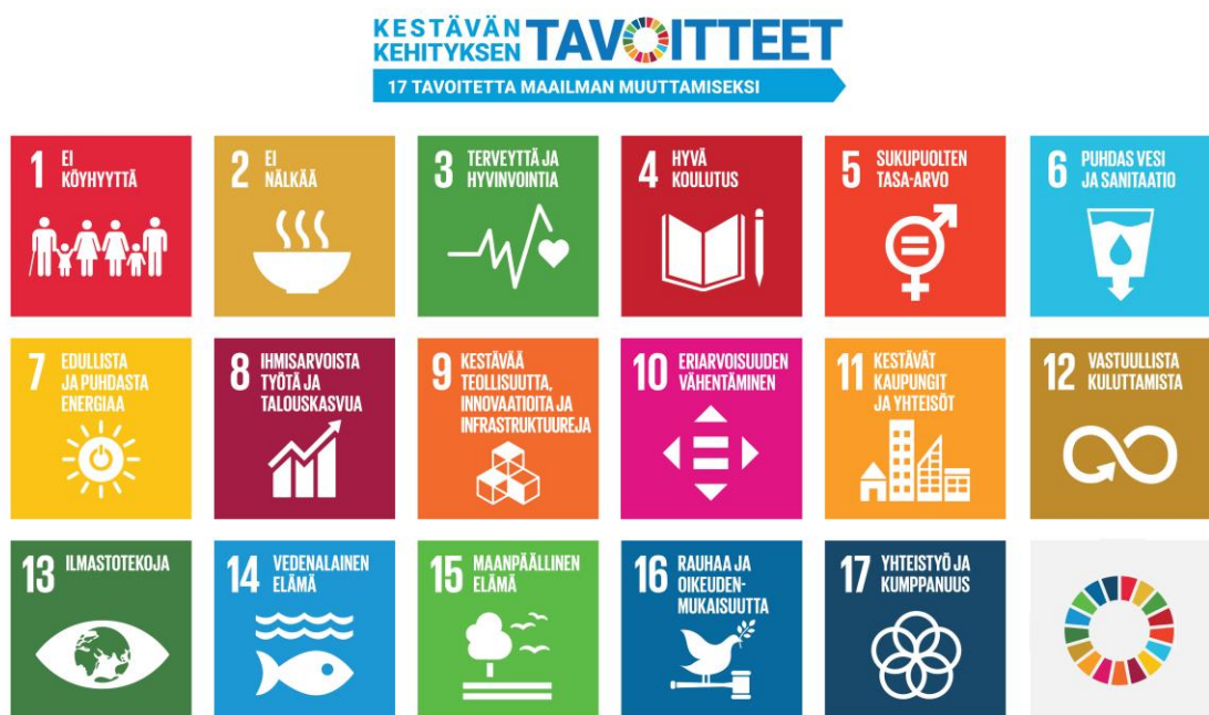
KUVA 1. Kestävän kehityksen tavoitteet (Suomen YK-liitto n.d.).

YK-liitto on asettanut 17 tavoitetta (SDG) kestäväälle kehitykselle (alatasoja on 169), kuten kuvasta yksi voidaan nähdä (Kuva 1, s.7). YK:n tavoitteet kestäväälle kehitykselle ovat universaaleja eli ne koskevat jokaista ihmistä ympäri maailman. Suomen YK-liiton sivuilta pääsee lukemaan AGENDA2030-julistuksen sisällön. Julistuksessa mainitaan, kuinka tasapainottuva kestävä kehitys kaikilta osa-alueilta on äärimmäisen tärkeää, köyhyden poistaminen kaikissa muodoissa sekä tehdä maailman rauhasta vahvempaa. Tähän auttaa se, että tunnistamme globaalisesti ongelmien väliset yhteydet. Kestävää kehitystä ei ole tavoitteiden saavuttaminen toisten tavoitteiden kustannuksella. Jos lähdetään korjaamaan yhtä tavoitetta, on otettava huomioon sen vaikutus myös muihin osa-alueisiin. Jokaisen panostuksella on iso vaikutus kestäväen kehityksen kannalta, niin yrityksillä, valtiolla, medialla kuin myös yksityisillä henkilöillä. (Suomen YK-liitto n.d.)