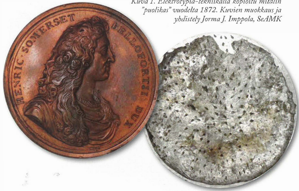
Kuva 1. Elektrotypia-tekniikalla kopioitu mitalin ”puolikas” vuodelta 1872. Kuvien muokkaus ja yhdistely Jorma J. Imppola, SeAMK

14. syyskuuta 1974 alkoi väärien rahojen jakelu Pohjanmaalla. Pääjakelijana toimi ”Olympia-Olli”, joka kaupitteli rahoja ahkerasti Vaasassa ja muualla Pohjanmaalla. Vuoden 1951 olympiarahoja kaupiteltiin noin 10–20 % markkinahin-