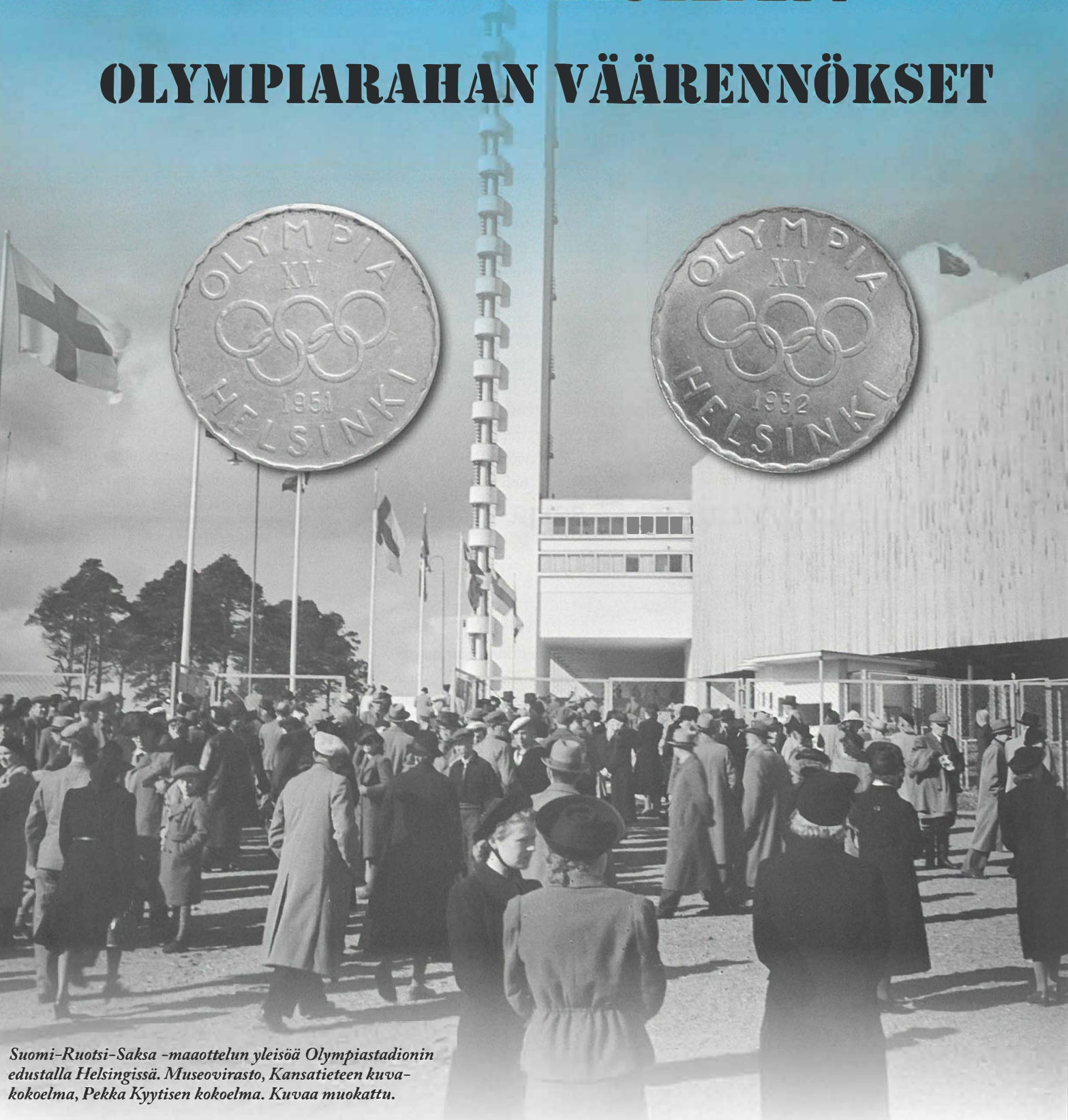
Suomi-Ruotsi-Saksa -maaottelun yleisöä Olympiastadionin edustalla Helsingissä. Museovirasto, Kansatieteen kuvakokoelma, Pekka Kyytisen kokoelma. Kuvaa muokattu.