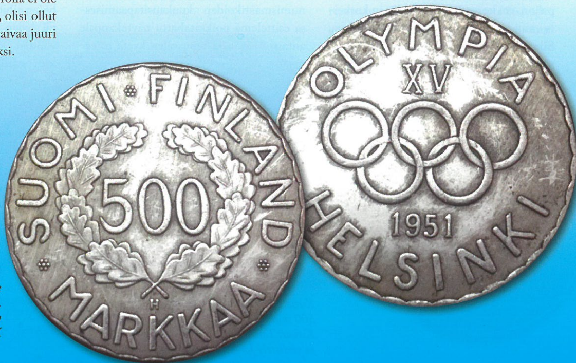
Kuva 7. Kiinalainen tekele vuoden 1951 olympiarahasta. Kuvien muokkaus ja yhdistely Jorma J. Imppola, SeAMK