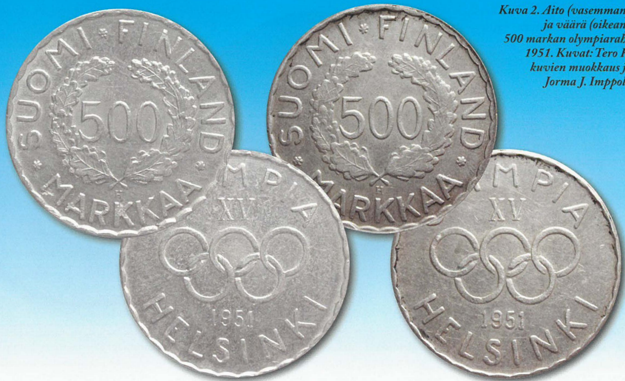
Kuva 2. Aito (vasemmanpuoleinen) ja väärä (oikeanpuoleinen) 500 markan olympiaraha vuodelta 1951.

Kuula oli kuuleman mukaan ollut aiemmin mm. poliisina Kristiinassa ja hänelle oli luonteenomaista todella herrasmiesmäinen ja fiksu käytös. Hän kulki aina vaaleassa puvussa ja kengissä. Ulkopuoliselle saattoi helposti syntyä käsitys miljonääristä ainakin käytöksen puolesta. Yleissivistys oli hänellä hallussa ja hän oli myös taiteen tuntija sekä hän teki myös sillä kauppaa.