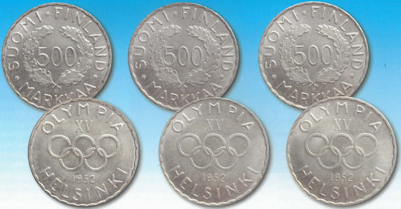
Kuva 3. Aito (vasemmanpuoleinen) ja kaksi vääriä (keskimmäinen ja oikeanpuoleinen) 500 markan olympiarahaa vuodelta 1952.

naaman mitä mainioimman väerien rahojen kokoelman kaikki kolme 500 markan olympiarahojen väärennettä (1 kpl vuotta 1951 ja 2 kpl vuotta 1952) sekä kolme aitoa vertailurahaa kannettavalla Tritonin röntgenfluometrilla käyttäen Alloy-moodia. Tulosten oikeellisuus jäi aluksi vielä vähän epävarmaksi, koska laitteessa on sellainen virhelähde, että kevyet metallit – kuten alumiini – on ohjelmallisesti jätetty analysoitavan spektrin ulkopuolelle ja jos niitä on analysoitavassa kohteessa paljon, voi kone antaa virheellisen korkcita muiden metallien prosenttiosuuksia. Siksi Tero Kontiokari päätti tehdä vielä uudet ajot oululaisen panttilainaamon