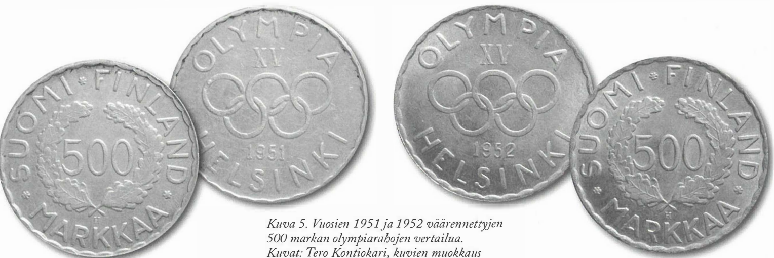
Kuva 5. Vuosien 1951 ja 1952 väärennettyjen 500 markan olympiarahojen vertailua.

Kuten tuloksista näkyy, ovat väärennökset varsin tarkasti oikean painoisia ja mittaisia. Selkimmäiset erot ovatkin metallin koostumuksessa. Aitojen vuoden 1952 rahojen hopeapitoisuus ylittää hieman asetuksen normin eli 50 %, mutta asetushan määrääkin rahan jalometallin minimipitoisuuden, joten asia lienee siltä osin kunnossa. Aidolle vuoden 1951 rahalle saatiin kuitenkin 71 % hopeapitoisuus, mikä sekin selittyne sillä, että monien vuoden 1951 aitojen olympiarahojen aihoiden metalli ja laatu yleensäkin oli hyvin vaihtelevaa. Tiettyssä mielessä vuoden 1951 olympiarahojen voitaisiinkin pitää jopa jonkinlaisina koerahoina.