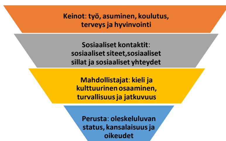
Kuvio 1. Kotoutumisen viitekehyksen osa-alueet (mukaillen Ageria ja Strangia 2008, 170).

Citizenship). Kutoutumisen mahdollistajana (Facilitators) tutkijoiden mukaan on kieli ja kulttuurinen osaaminen (Language and Cultural Knowledge) lisäksi turvallisuus ja jatkuvuus (Safety and Stability). Sosiaaliset kontaktit (Social Connection) koostuvat sosiaalisista siteistä, sosiaalisista silloista ja sosiaalisista yhteyksistä (Social Bonds, Social Bridges, Social Links). Kutoutumisen keinot ja tulokset (Markers and Means) muodostuvat kotoutujan työstä (Employment), asumisesta (Housing), koulutuksesta (Education) ja terveydestä sekä hyvinvoinnista (Health). (Ager & Strang 2008, 170.) Kuviossa 1 on tuotu Agerin ja Strangin mukaan kotoutumisen osa-alueet.