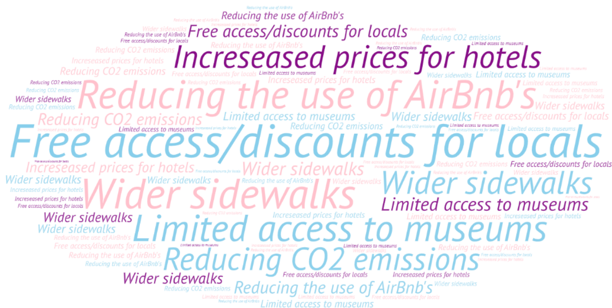
Kuva 3. Sanapilvi Barcelonan liikaturismin kontrolloimisesta tänä päivänä.

Kuva 3 kuvastaa keinoja, millä liikaturismia on jo kontrolloitu Barcelonassa. Kuten kuvasta 3 pystyy päätellä, eniten on tehty muutoksia siihen, että paikallisilla olisi ilmainen pääsy moneen paikkaan, tai ainakin alennuksia saatavilla, kun taas turistit joutuvat maksamaan tietyistä paikoista. Hyvä esimerkki on Park Guell, joka on ilmainen paikallisille, mutta maksullinen turisteille.