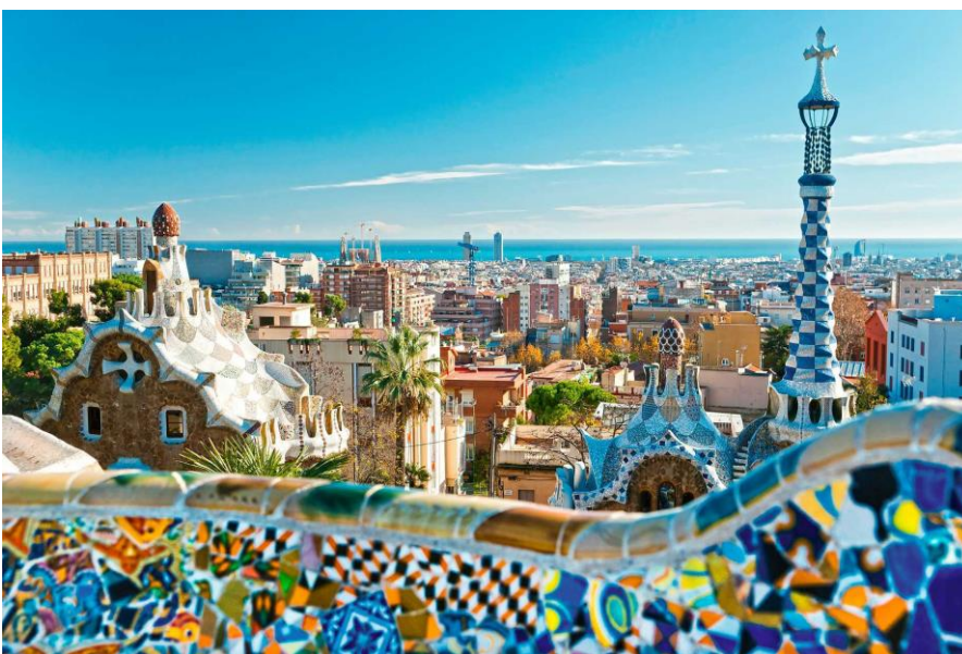
Kuva 1. Park Güell (Apollomatkat s.a)

Barcelona on todella suosittu matkakohde turistien kesken ja kohteen vetovoimatekijät ovat yksi merkittävimpiä syitä miksi Barcelona valituu yhä useammin lomakohteeksi. Yksi Barcelonan vetovoimatekijöitä on se, että siellä yhdistyy kaupunkielämä sekä rantaelämä. Barcelona on myös hyvin suosittu kohde jalkapallon takia, sillä se on kotikaupunki FC Barcelonan joukkueelle (FC Barcelona s.a). Tämä onkin yksi esimerkki matkustusmotiivista. Yksi mitattava matkustusmotiivi on kaupungin lämpötila, sillä se on kohtalainen ja viileämpi, verrattuna moniin muihin Espanjan kaupunkeihin. Kaupunki tarjoaa paljon taide- ja historiallisia elämyksiä. Barcelonassa todella paljon ja ne resonoivat monesti kaupunkia ja sen antimia.