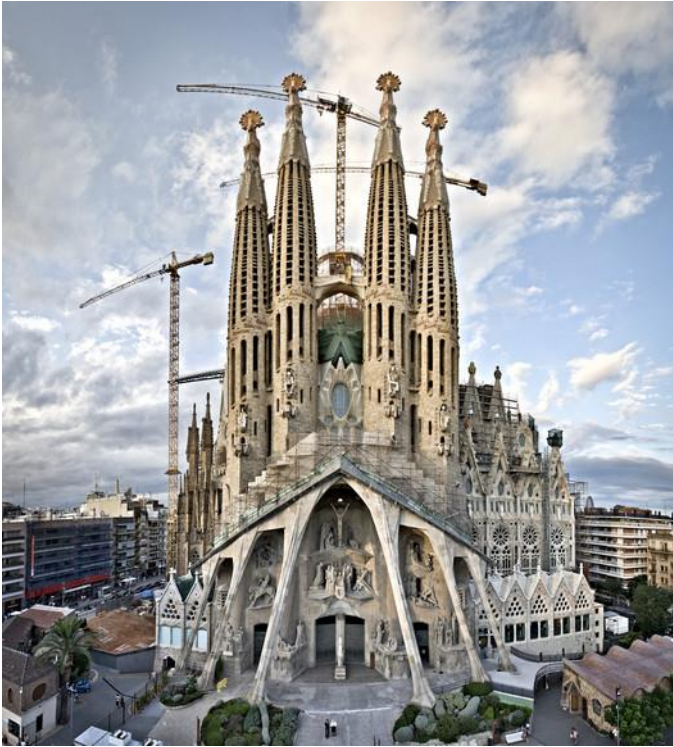
Kuva 2. La Sagrada Familia

Kuva 1 kuvastaa yhtä Barcelonan suosituimpia nähtävyyksiä, Güellin puistoa, jonka on suunnitellut Antoni Gaudi. Antoni Gaudi oli espanjalainen arkkitehti ja erittäin tunnettu etenkin Katalonian alueella. Park Güell on nykyään paikallisille ilmainen, mutta turisteille se maksaa. Puistossa on myös tietty määrä ihmisiä sallittu kerralla. Tällä on pyritty vähentämään ihmismäärää ja suuria turistimassoja. Ihmisiä kiehtoo Antoni Gaudin taide ( parkguell.barcelona s.a ).