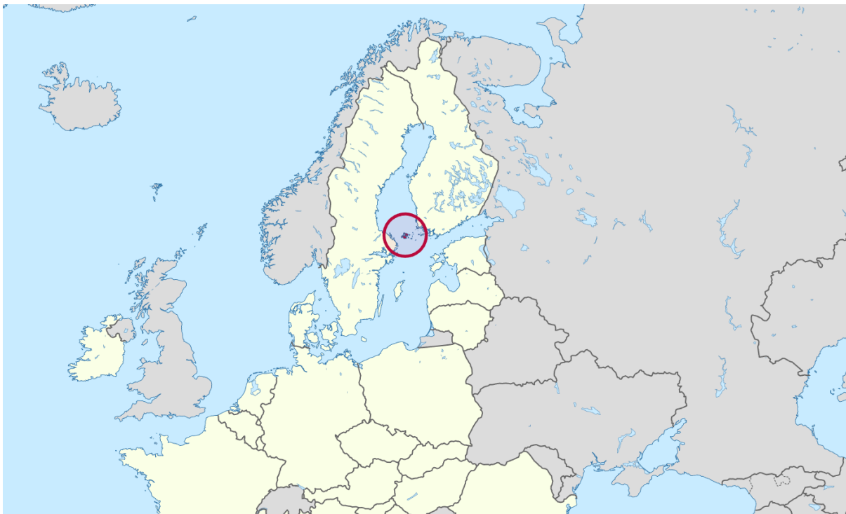
Figur 1. Karta över Europeiska Unionens medlemsländer med Åland inringat.

(File:Åland in European Union (-Rivers -Mini Map).svg, 2011)