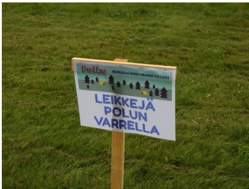
Kuva 1. Leikkejä polun varrella-kylltti

sekä tulostimme nuorille suunnatut palautelomakkeet. Materiaalien valmistamisessa huomioimme sääolosuhteet tekemällä niistä mahdollisimman hyvin sateen kestäviä. Saavuimme leirille yhtä päivää ennen toimintatuokion toteuttamista. Saapumispäivänä tutustuimme leirialueeseen, leiriläisiin sekä leirillä työskenteleviin ammattilaisiin. Kävimme myös työntekijöiden ja leiriläisten kanssa läpi leirin kulkua, sääntöjä ja yhteisiä aikatauluja. Valmistautumisen kannalta oli tärkeää, että olimme leirialueella jo edellisenä päivänä, jolloin aikaa jäi riittävästi toimintatuokion konkreettiseen valmisteluun (Kuva 1). Ensimmäisen illan yhteisessä iltaohjelmassa esittelimme itsemme ja kehittämämme toimintatuokion leirin osallistujille.