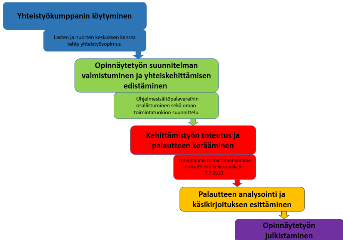
Kuvio 1. Opinnäytetyöprosessin kulku