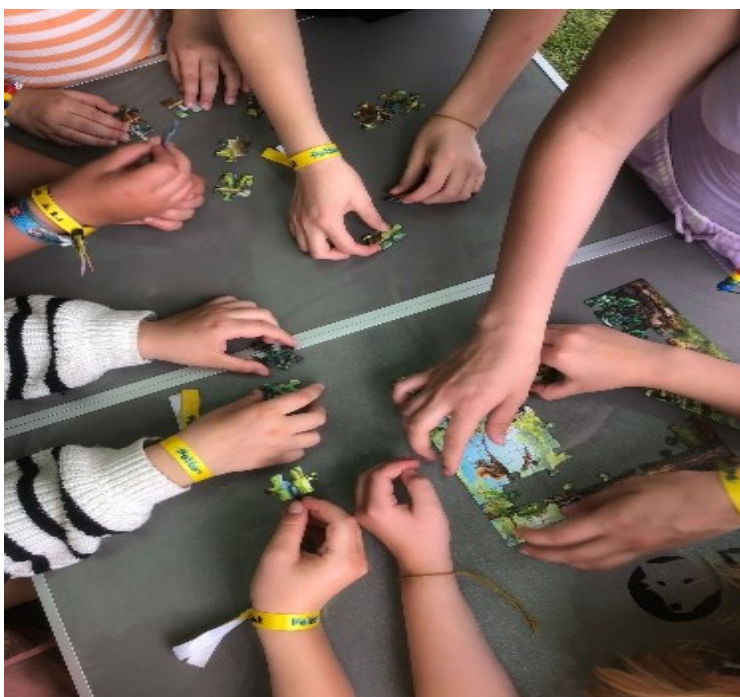
Kuva 6. Palapeli Erilaiset yhteisöt ja sen jäsenet”

Kysymysten jälkeen tarkoituksena oli löytää yhdessä yhteenveto tai lopputulos, jossa käy ilmi, että kaikki ovat yhtä tärkeitä, erilaisuutta tulee kunnioittaa. Lisäksi halusimme luoda toiminnalla yhteenkuuluvuuden tunnetta leiriläisten välille ja herätellä ajatuksia yhdenvertaisuuden tärkeydestä. Olimme valmistautuneet kuulemaan myös nuorten omia pohdintoja ja kuvista heränneitä ajatuksia.