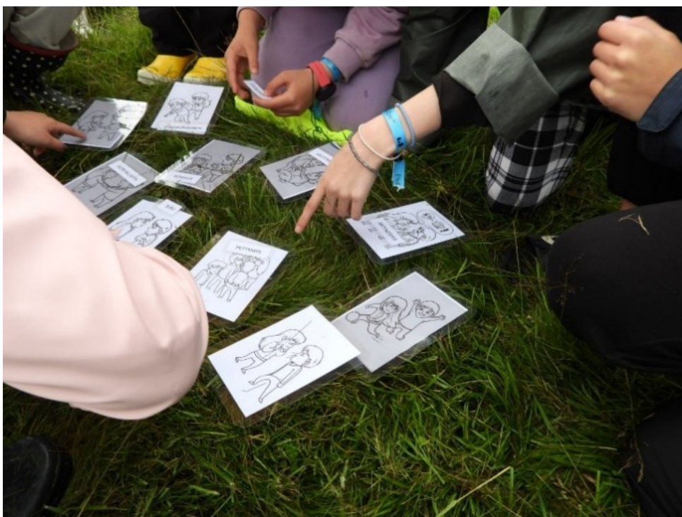
Kuva 4. Yhdistävä viesti

Kolmantena leikkinä pisteellämme oli norsupallon pelaaminen. Norsupallo- pistellä varhaisnuoria ohjasivat ryhmän mukana tulleet isokset. Norsupallo muistuttaa pelinä jalkapalloa. Jalkapallosta sen erottaa sen peliväline, joka on jalkapallon sijaan jumppapallo. Jumppapallon käyttäminen tuo peliin hauskuutta, poistaa pelaajien välisiä tasoeroja sekä tekee pelistä mielenkiintoisen. Norsupallon pelaamisen tarkoituksena oli nostaa pelaajien välistä yhteishenkeä, antaa isosille kokemusta ryhmänohjaajana toimimisesta sekä mahdollistaa ison ryhmän jakaminen pienempiin ryhmiin, jolloin muissa leikeissä jäi enemmän aikaa toiminnan, tunteiden ja mielipiteiden jakamiselle.