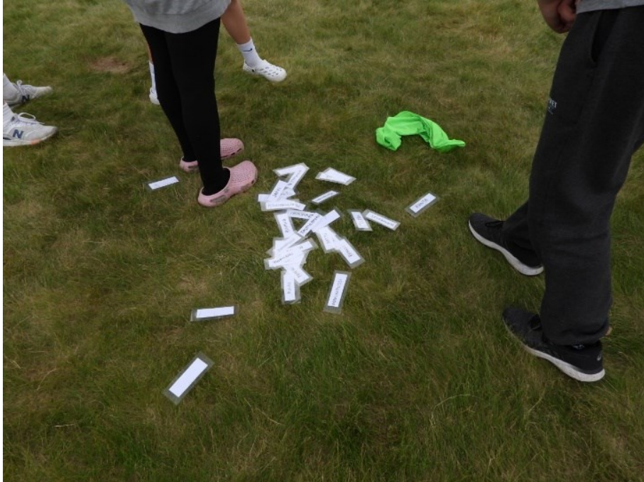
Kuva 5. Leirialias

tyivät leiriympäristöön ja tukivat mielestämme yhteisöllisyyden muodostumista. Sanat olivat kaikille osallistujille yhteisiä ja toimivat ryhmän jäseniä yhdistävinä tekijöinä (Kuva 5).