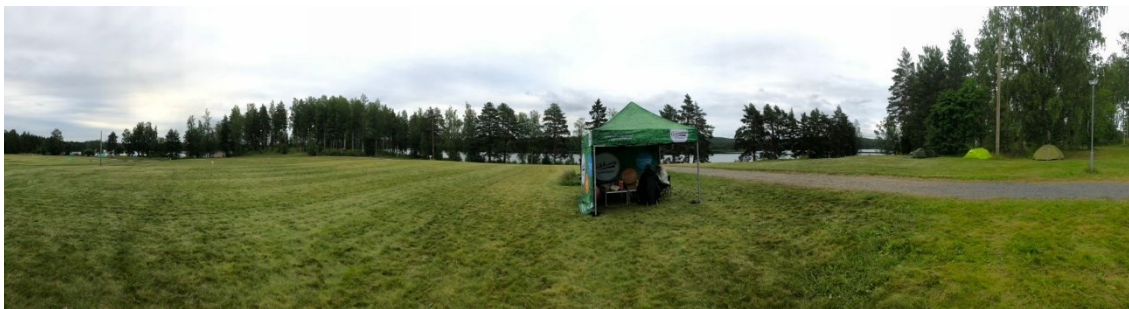
Kuva 2. Leikkejä polun varrella- toimintatuokion ympäristö

Toimintatuokiossamme oli eri kategorioihin suuntautuvia leikkejä, kuten liikunta, ongelmanratkaisu-, sekä tutustumisleikkejä. Aloitimme toiminnan yhteisellä matalan kynnyksen tutustumisleikillä, jolloin varhaisnuoret pääsivät turvallisesti ottamaan kontaktia toisiinsa ja oppivat siten muun muassa toistensa nimiä. Tutustumisleikkiä ennen lapset jaettiin pienempiin ryhmiin, joiden kanssa he lähtivät kiertämään muita leikkejä yhdessä. Toimintatuokiossamme oli ohjattujen leikkien lisäksi myös muita leikkejä, joissa ryhmät kiersivät itsenäisesti. Leikkiaikaa oli puolitoista tuntia ja jokainen ryhmä kävi kuudessa eri leikissä sen aikana. Leikkien jälkeen ryhmät palasivat yhteiseen lopetushetkeen ja osallistujilta kerättiin palaute toiminnasta.