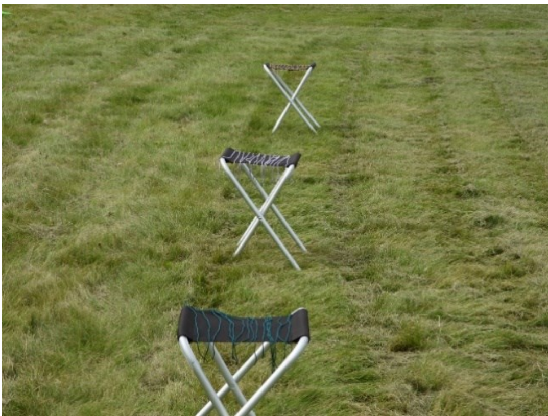
Kuva 3. Leirijonot

nuorten osallisuuden ja itsemääräämisen kokemusta leikeissä sekä luoda turvallisen ilmapiirin tulevia leikkejä varten.