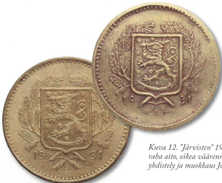
Kuva 12. ”Järvisten” 1931 vaakunapuolten vertailua. Vasen raha aito, oikea väärennös.