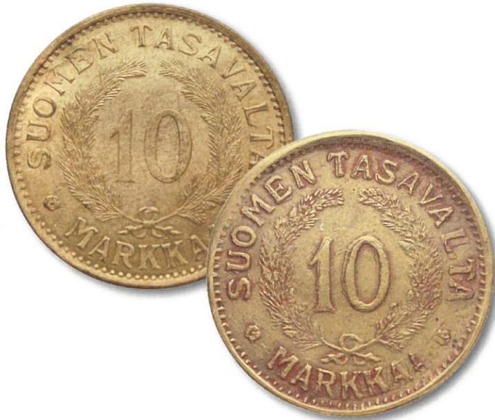
Kuva 8. ”Järvisten” 1931 arvopuolten vertailua. Vasen raha aito, oikea väärennös. Tässäkin rahassa näkyy arvopuolella jo aiemmin mainittu kohouma.