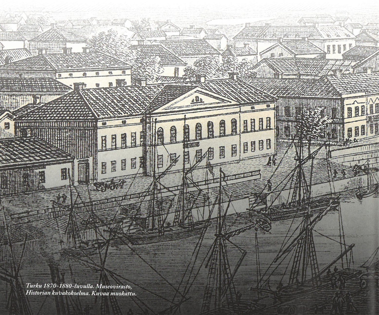
Turku 1870–1880-luvulla. Kuvaa muokattu.