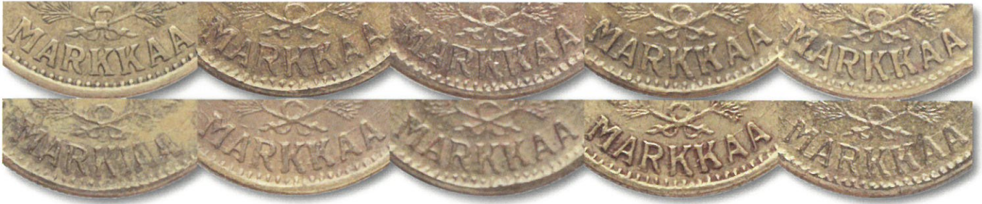
Kuva 7. ”Järvisten” 1930 sanan MARKKAA vertailua. Yläriivin vasen raha aito, loput 9 väärennöksiä.