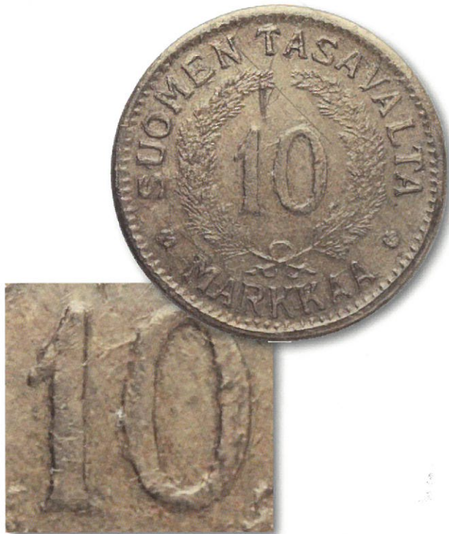
Kuva 1. Rikostutkimuskeskuksen havaitsema Ryhmän 1 erityispiirre eli siro ja selkeä arvomerkitä ilman 1:n alaosaista lähtevää kohoumaa.