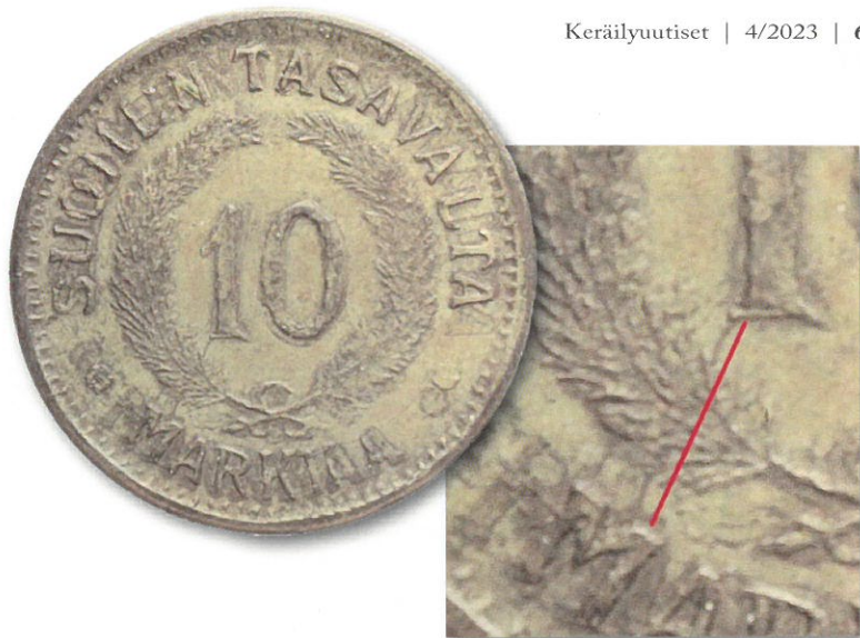
Kuva 2. Rikostutkimuskeskuksen havaitsema Ryhmän 2 erityispiirre eli rujo arvomerkitä ja 1:n alaosaista M-kirjaimen asti yltävä kohouma. Huomatkaa väärennöksen arvopuolen selkeää kaksoislyöntimäisyys, mikä lienee syntynyt muotin lyöntivaiheessa, jolloin aitoa rahaa käyttäen on lyöty arvopuolen muottiin rahan negatiivipainaua. Lyönti on selvästi tehty kahdesti, ja koska lyöntien välillä on malliraha hieman kiertynyt, on rahan kuvio tullut arvopuolen muottiin kahdentuneena. Valuuvaiheessa on tämä virhe kopioitunut kaikkiin tällä arvopuolen muotilla valettuihin väärennöksiin. Kuvien käsittely ja yhdistely Jorma J. Imppola, SeAMK.

S uomalaisista rahoista tehdyistä väärennöksistä on varmasti mielenkiintoisin ns. Järvisen 10-markkainen. Kyseessä on tiettävästi ainoa Suomen metalliraha, jota on teollisesti väärennetty rahaliikenteeseen laskemista varten. Raha on siis tehty käytettäväksi maksuvälineenä (eli se on ns. aikalainen väärennös) eikä sen valmistuksen tarkoitus ollut huijata keräilijöitä, mikä on ollut muiden tunnettujen (vaikkapa 5 penniä 1918 KV II tai 500 markkaa 1951 Beirutin väärennös) suuremmissa mittakaavassa väärennettyjen Suomen rahojen valmistuksen peruslähtökohta.