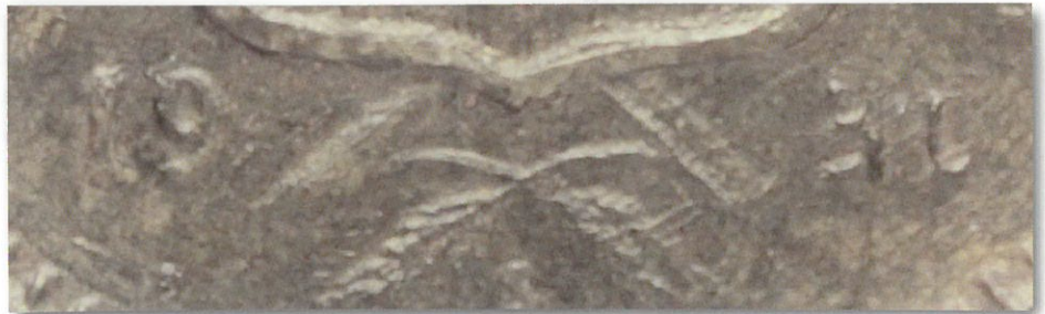
Kuva 11. Kuvan 10 alaoikealla olevan rahan vuosiluvun 1930 osasuurenos.