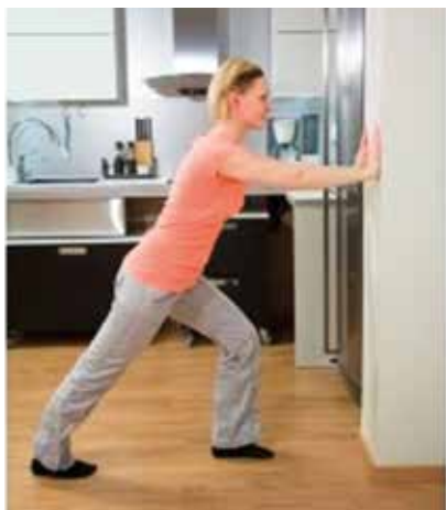
KUVA 1. Liikuntaohjeiden havainnollistaminen verkkosivuilla.

Ohjeiden ja videoiden sisällöstä oli vastattava itsenäisesti. Hinnat piti kilpailuttaa, ja edullinen sekä hyvä kuvausfirma löytyikin. Kuvausten tekeminen oli yllättävän tarkkaa työtä. Piti saada valaistus kuntoon, poistaa varjoja ja valita kuvattaville sopivan värinen vaatetus, ja taustallakin oli suuri merkitys. Valitsimme taustaksi koulumme tiloista keittiön, jotta liikuntatilanteesta saataisiin mahdollisimman kodinomainen. Tarkoituksena oli tehdä ohjeista sellaiset, että jokainen voi liikkua halutessaan myös kotonaan, vaikka tilaa olisi vain muutama metri. Pääajatuksena oli, että aina ei tarvitse lähteä kuntosalille tai erilliseen liikuntapaikkaan, jotta voisi harjoittaa esimerkiksi lihaskuntoa. Kotona on varmasti riittävästi tilaa, ja käsipainoina voi käyttää vaikka vesipulloja.