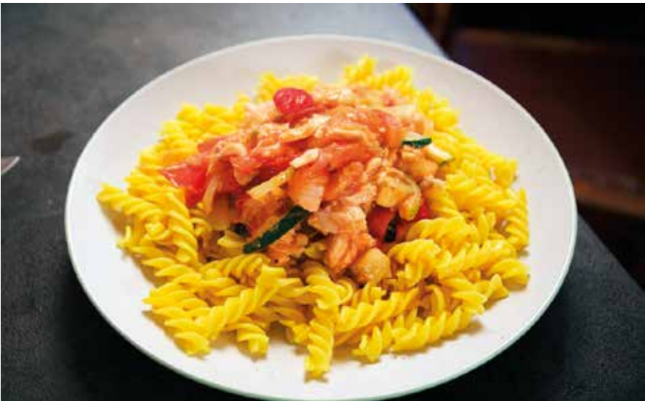
KUVA 3. Esimerkki ruokaohjeista: lohipasta.