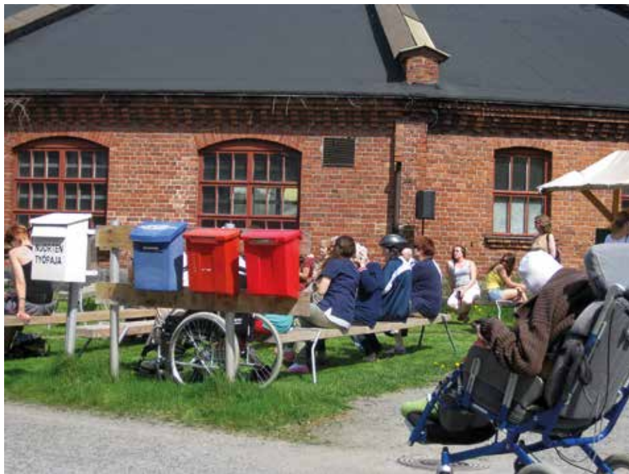
KUVA 1. Nuorten työpaja vanhoilla veturitalleilla Porissa (Kuva: Tarja Javanainen-Levonen).

muassa kuljetus- ja palvelutehtävissä, rakennusperinneosastolla, Bändipajalla ja Cafe Nuokkarissa. (Porin kaupunki 2015.)