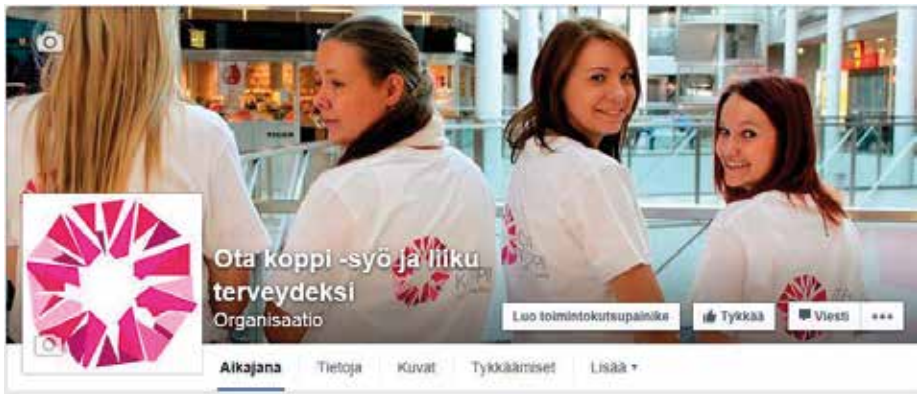
KUVA 1. Kuvakaappaus Facebook-sivulta.

Facebookin kautta on pyritty motivoimaan nuoria käyttämään edullisia liikuntapalveluita. Siksi hankkeen toimijat ovat markkinoineet kaikkia mahdollisia paikkakunnan ilmaisia palveluita ja tapahtumia Ota koppi! -hankkeen Facebook-sivulla.