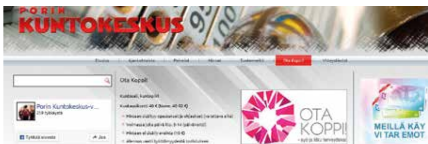
KUVA 2. Yrittäjän verkkosivujen välilehti.

Yhteistyöstä innostuneina verkoston jäsenet ovat markkinoineet hanketta omilla nettisivuillaan. Esimerkiksi melontaseura on lisännyt informaation yhteistyöstä välittömästi ajankohtaista-palstalleen. Seura tiedotti hinnastossaan alennuksen kohderyhmälle ja teki linkin Ota koppi! -hankkeen kotisivuille. Uusiessaan sivustoaan kuntosaliryttäjä loi uuden välilehden, jossa esitellään hankkeen perustiedot (kuva 2). Lajiesittelyvideoiden julkaisun jälkeen keilailua tarjoava yrittäjä markkinoi videoita, jotka ovat linkitettyinä sivustolla. Verkoston jäsenten toteuttama markkinointi on lisännyt paljon Ota koppi! -hankkeen näkyvyyttä, mikä on tuonut uusia yhteistyömahdollisuuksia.