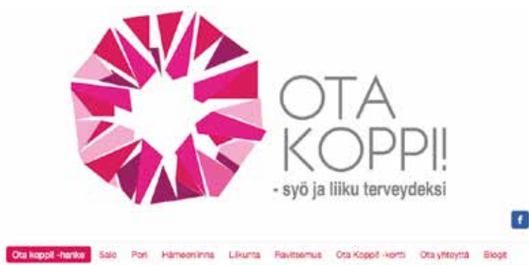
KUVA 2. Hankkeen verkkosivun ulkoasu ja rakenne.

Verkkosivuston rakenne (ks. kuva 2) hahmoteltiin hankeryhmän kesken. Huomioitavaa oli, että osa sisällöstä oli valmiina, mutta sisällöntuottajia oli useita, ja uusien paikkakuntien tullessa mukaan sivujen piti olla joustavasti muokattavissa. Sivuille tuotettiin tietoa hankkeesta, ravitsemuksesta ja liikunnasta. Lisäksi mukaan haluttiin paikkakuntakohtaiset lounasravintoloiden sekä liikunnan palveluntarjoajien esittelyt ja logot. Myöhemmin luotiin ravitsemuksesta ja liikunnasta blogit, jotka syntyivät terveyden alan opiskelijoiden opinäytetyönä. Sisältöä ovat tuottaneet hankeryhmäläiset ja hankkeeseen osallistuneet opiskelijat sekä yrittäjät, joilta on ostettu ruoanvalmistusvideoiden ja liikunnan lajesittelyvideoiden kuvaus- ja editointipalvelut. Sisällön valikointiin liittyviä perusteluja esitetään erikseen seuraavissa artikkeleissa. Nettisivuja ei rakennettu interaktiiviseen vuorovaikutukseen kohderyhmän kanssa, vaan niiden tarkoituksena on palvella yksisuuntaista tiedottamista. Sivuston markkinointiin, tapahtumista tiedottamiseen ja keskusteluihin on käytetty julkista Facebook-sivua.