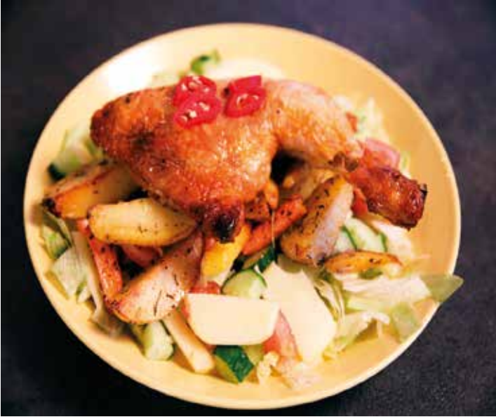
KUVA 2. Esimerkki ruokaohjeista: kanankoivet kasvispedillä.