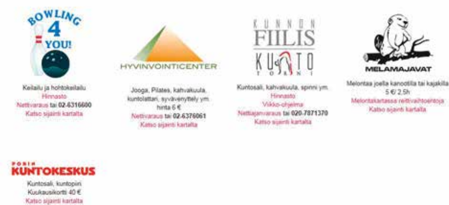
KUVA 2. Kuvakaappaus yrittäjien ja seuran liikuntaverkostosta.

Kunnan liikuntatoimen rooli asukkaiden liikunnan edistämisessä on merkittävä. Porissa hankkeen verkkosivuille on koottu linkit kaikkeen siihen kunnan organisoimaan palveluun, josta hankkeen kohderyhmän nuoret voivat hyötyä. Sivuille on linkit kunnan edulliseen palvelutarjontaan sekä sähköiseen harrastushakupalveluun, ja niiden kautta saa tietoa liikuntavälineiden vuokrauksesta sekä eri ulko- ja sisäliikuntapaikkojen aukioloajoista ja sijainnista.