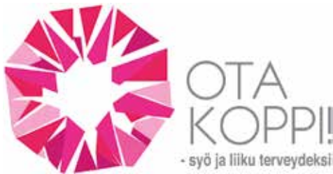
KUVA 1. Ota koppi! -hankkeen voittajalogo.

Internetin käytön yleisyyden vuoksi verkkosivut ovat keskeinen informaatio-kanava myös Ota koppi! – syö ja liiku terveydeksi -hankkeessa. Hankkeen kohde-ryhmänä ovat työtä ja opiskelupaikkaa vailla olevat alle 30-vuotiaat nuoret ja nuoret aikuiset. Hankkeen verkkosivujen rakentamista varten julistettiin kilpailu visuaalisen ilmeen ja logon suunnittelusta Turun ammattikorkeakoulun Taideakatemian opiskelijoiden kesken jo ensimmäisen hankevuoden keväällä. Voittajan valitsivat terveysalan opiskelijat sekä hankkeen ohjaus- ja projekti-ryhmä. Logossa voi nähdä hiotun timantin väriloistoinen tai pelastuspartion tiiviin pelastuspurjeen (ks. kuva 1).