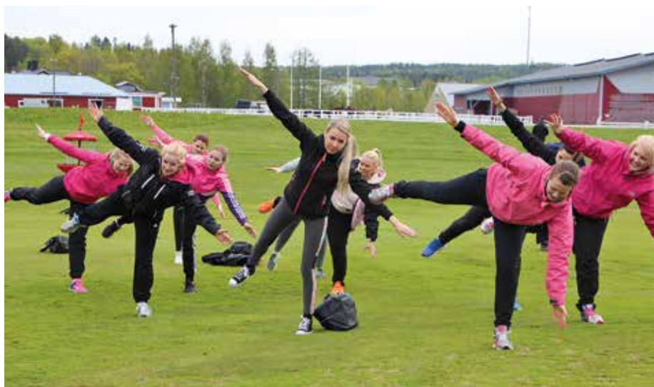
KUVA 3. Liikuntapäivän alkuvenyttely.

työkumppaneiden kautta, ja myös nuorten työpajoilta tultiin viettämään aurinkoista liikuntailtapäivää iloisessa yhteishengessä.