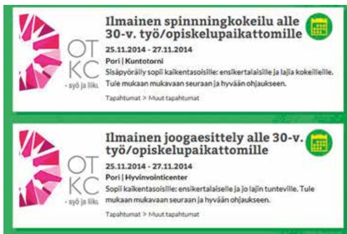
KUVA 1. Kuvakaappaus Menoinfo-yleistiedotteesta.

ajoin ennen tilaisuuksia. Jos opiskelijoita on ollut käytettävissä markkinointiin, on perinteisiä paperimainoksia viety yhteistyötahojen ilmoitustauluille.