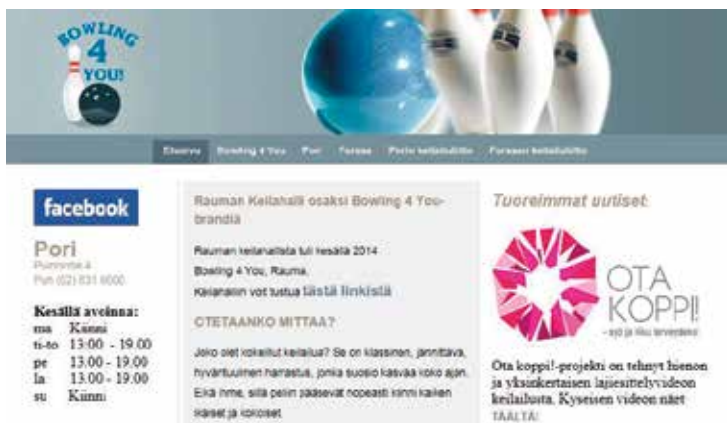
KUVA 1. Näkyvyyttä hankkeelle yrittäjän verkkosivuilla.

Liikuntalajit valittiin siten, että ne kattaisivat liikuntaverkoston palveluita. Näin lajiesittelyvideot pystyttiin toteuttamaan verkoston ja mediapalveluiden sekä hanketyöntekijöiden ja opiskelijoiden yhteistyönä. Näillä perusteilla esittelylajeiksi valikoituivat jooga, spinning, melonta ja keilailu. Videot oli suunnattu kaikille hankkeen kohderyhmäläisille. Koska liitokiekkogolf eli frisbeegolf on saavuttanut viimeisen parin vuoden aikana valtavan innostuksen nuorten – ja erityisesti nuorten miesten – keskuudessa, tehtiin siitä myös oma lajiesittelyvideonsa. Yhteistyöstä innostuneina liikuntapalveluiden tarjoajat markkinoivat videoita linkkinä omillakin verkkosivuillaan (kuva 1).