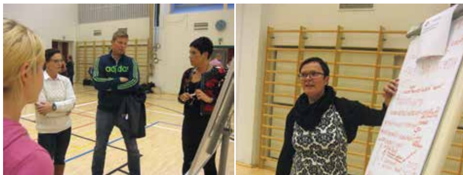
KUVAT 1–2. Paikalliset asiantuntijat keskustelun ylläpitäjinä.

Työpajan aikana ilmeni, että nuorten liikunnan ja ravitsemuksen edistämistä yhdistetään jo olemassa oleviin toimintoihin. Kunnan liikuntatoimen edustaja on tehnyt yhteistyötä nuorten työpajan kanssa. Myös uravalmennus sisältää paljon hankkeen tavoitteita tukevia toimintoja. Kunnan ohella useat paikalliset liikuntapalveluiden tuottajat tarjoavat työttömille alennuksia liikuntapalveluista.