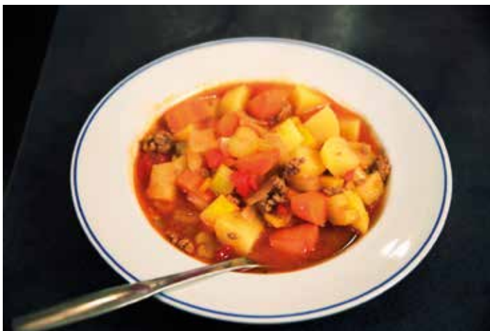
KUVA 1. Esimerkki ruokaohjeista: jaubelihakeitto.

Sivuston on tarkoitus ohjata nuoria syömään monipuolisesti, joten päiviin on suunniteltu aamupala, lounas, iltapäivän välipala, päivällinen ja iltapala. Nuorille annetaan myös tietoa siitä, mitä ravintoaineita elimistö tarvitsee ja kuinka hyvin ne saadaan tavallisesta ruoasta edullisesti, kun ruoka-aineet valitaan kausituotteiden mukaisesti. Talvella edullisimmat ruoat valmistuvat juureksia käyttäen. Kesällä tomaatit, kurkut ja salaattit ovat myös hyvin edullisia. Metsämarjoja ja sieniä kannattaa kerätä ja säilöä mahdollisuuksien mukaan, koska niistä saa hyvin paljon elimistön tarvitsemia vitamiineja ja kivennäisaineita. Monipuolinen päivittäinen syöminen ja hyvä ruokarytmi pitävät nälän loitolla, mielen virkeänä, suun ja hampaat kunnossa sekä auttavat painonhallinnassa.