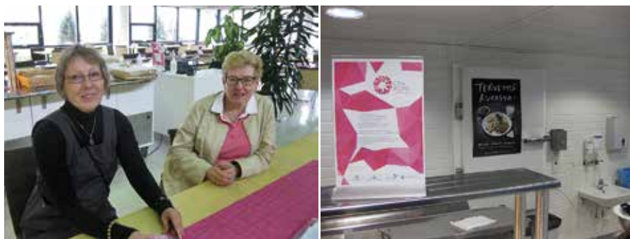
KUVAT 2–3. Yhteistyötä Porin Palveluliikelaitoksen kanssa.

lähteä etsimään yhteistyökumppaneita, sillä kaikkia sen alaisia toimijoita hal- linoidaan yhdestä paikasta. Olimme yhteydessä yrityksen vastaavaan palve- lusuunnittelijaan. Neuvottelut hänen kanssaan johtivat nopeasti siihen, että mukaan lupautui kaksi sairaalan keittiötä ja yksi vanhainkodin keittiö. Kaik- ki kolme toimijaa valikoituivat osittain siten, että ne sijaitsevat eri puolilla kaupunkia. Palvelun tuottajan puolelta sairaaloiden ja vanhainkodin mukaan lähteminen oli myös melko helppo toteuttaa, sillä päivittäisiä aterioita valmis- tettiin aina satoja. Lisäksi oli oletuksena, että alussa hankkeen kohderyhmään kuuluvia nuoria ei tule kovin montaa yhteen kohteeseen.