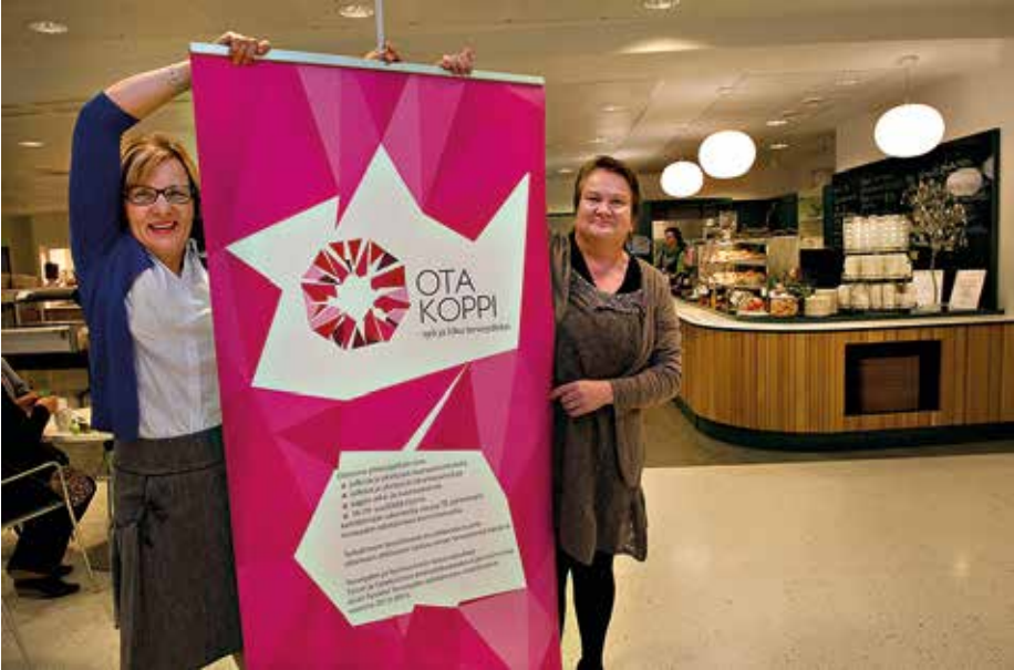
KUVA 1. Projektipäällikkö ja Salon kaupungin infon työntekijä pystyttivät Ota koppi! -hankkeen julisteen kaupungintalon Kaneliomena-ravintolaan (kuva: Salon Seudun Sanomat/Minna Määttänen).