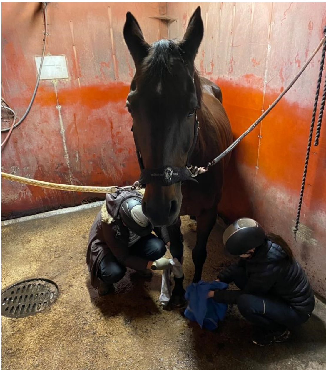
Kuva 3. Hevosten hoitoa yhteistyössä työelämäjaksolaisen kanssa.

Ryhmäkerralla kolme toimintaan osallistui kaksi Kouvolan Kipinä ry:n kuntouttavan työtoiminnan tai palkkatukityöskentelyn osallistujaa sekä opiskelija. Yksi osallistuja oli poissa. Osallistujat olivat samoja henkilöitä kuin ensimmäisellä ja toisella kerralla, joten ryhmätoiminta jatkui siitä mihin edellisellä kerralla oli jääty. Ratsastuskeskusyrittäjä oli kirjoittanut ryhmälle tehtäviä infotaululle. Aamupäivästä toiminnalliseen osuuteen kuului tuntihevosten satulahuoneen, tallin vessan sekä sisääntulokäytävän siivous, ulkoalueiden kulkuväylien haravointi, tallin pyykin pesu sekä kuivumaan ripustaminen sekä tuntihevosten harjaämpäreiden ja harjojen putsaus ja lajittelu. Talliympäristö ja toimintatavat olivat tulleet jo sen verran tutuiksi, että ryhmäläiset jakaantuivat toimimaan yksi-