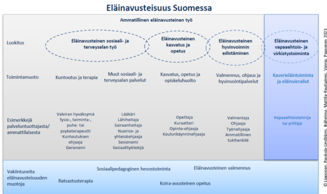
Kuva 1. Eläinavusteisen työskentelyn jaottelu Suomessa

Kuvassa näkyvä ensimmäinen osio on eläinavusteinen sosiaali- ja terveysalan työ. Tätä eläinavusteisen työn muotoa voisivat toteuttaa Valviran hyväksymät terapeutit, kuntoutuksen ohittajat, sosiaalityöntekijät, sosionomit, geronomit, nuoris- ja yhteisöohittajat, lääkit, lähiohittajat sekä sairaanhittajat. Toiminta on kuntoutusta, terapiaa, tai muuta sosiaali- ja terveysalan palveluita. Palveluesimerkkeinä tähän osioon on ratsastusterapia, sosiaalinen kuntoutus, eläinavusteinen psyko- tai puheterapia, sosiaalipedagoginen hevostoiminta sekä eläinavusteinen vammais-, vanhus- tai perhetyö. (Paasonen 2022.)