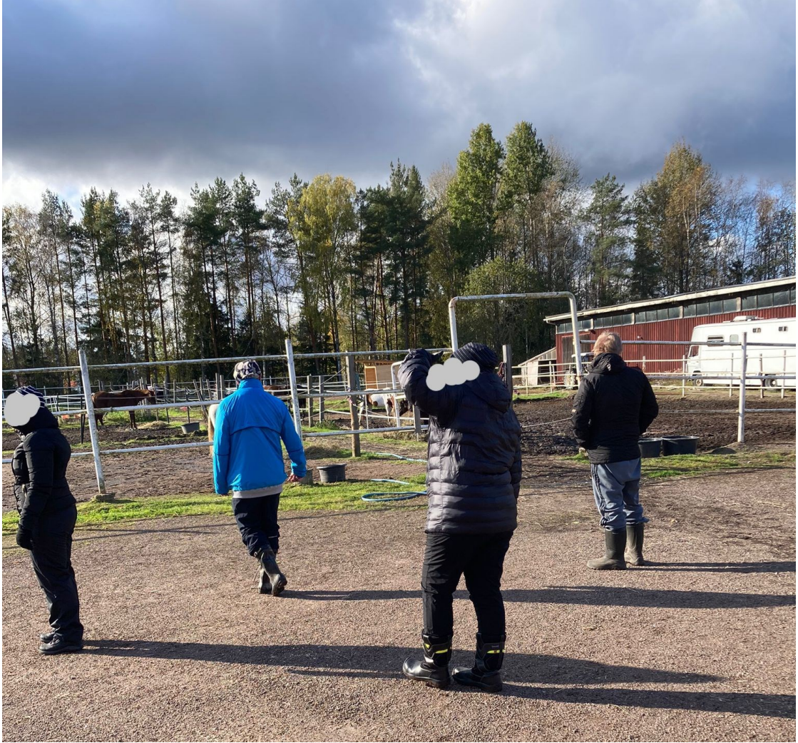
Kuva 2. Ryhmä jalkautuu talliympäristöön, kokeilujakson ensimmäinen kerta.

Opiskelija kertoi, että suunnitelmana ryhmäkerroille on, että aamupäivällä ennen ruokataukoa ajatus oli siivota talliympäristöä, ja loppupäivästä keskitytään hevosten hoitamiseen ja käsittelyyn. Tämä sopi kaikille. Ensimmäisellä ryhmäkerralla aamupäivän toiminnallisessa osuudessa kuivitimme tuntihevosten puhdistettuja karsinoita sekä tyhjensimme yhden likaisen karsinan tyhjäksi. Käytännössä tämä tarkoitti sitä, että kaksi henkilöä haki tallin ulkopuolelta turvekasasta puhdasta turvetta kottikärryihin ja tyhjensi kottikärryt hevosten karsinoihin. Yksi henkilö levitti turpeet karsinoihin ja yksi henkilö auttoi turvekasalla kottikärryjen täyttämässä. Kaksi henkilöä tyhjensi likaista karsinaa talikoilla kottikärryihin ja lantalaan.