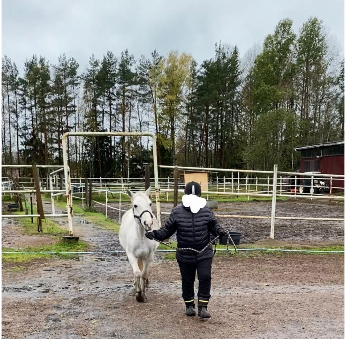
Kuva 5. Hevosen talutusta itsenäisesti ulkotarhauksesta sisälle.

on vaikea nähdä, kuten hevosen mahan alla tai kainaloissa. Samalla ryhmäläinen huomasi, että tuntuu hyvältä silittää hevosta paljaalla kädellä, turkin pehmeyttä on mukava hypistellä ja hevonen tuntuu lämpöiseltä käden alla.