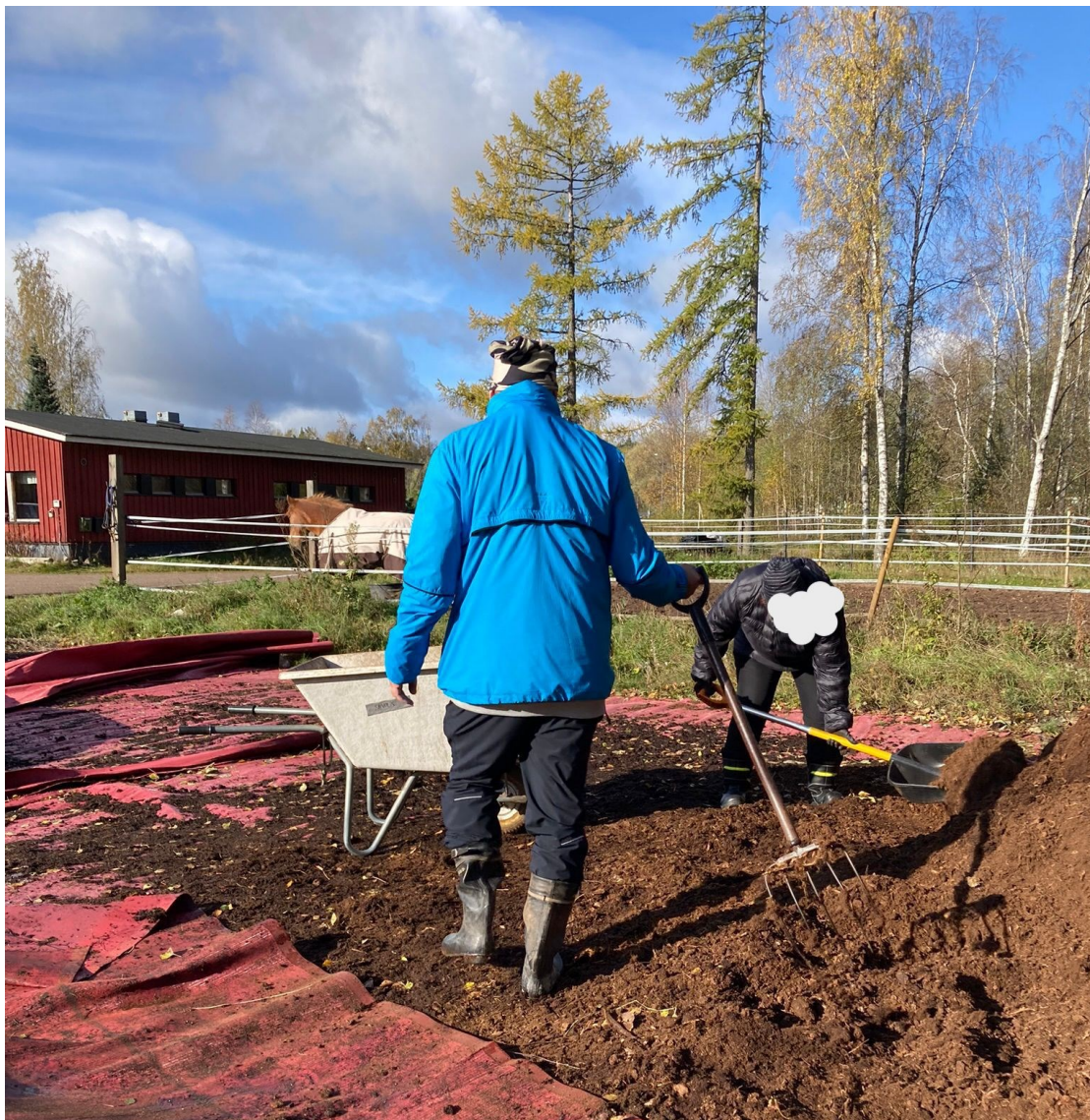
Kuva 4. Puhtaan turpeen hakua hevosten karsinoihin.

olivat edellisellä kerroilla tuntuneet mukavilta ja missä ryhmäläiset kokivat vahvuksiensa olevan. Opiskelija ohjasi ryhmää esimerkillä, sanallisesti ohjaten sekä nyt jo hieman valmentavalla otteella. Toiminnassa oli havaittavissa aiempia kertoja enemmän toimeliaisuutta ja omatoimisuutta.