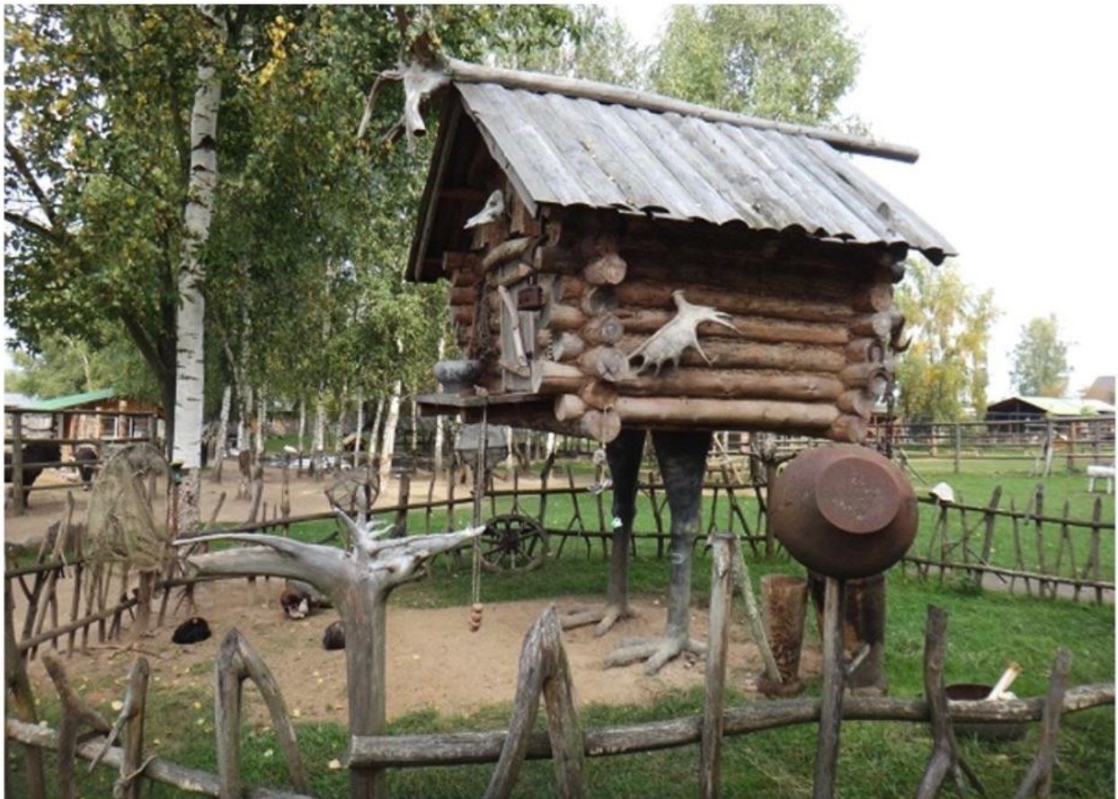
KUVA 2. Tietyillä vastausvaihtoehdoilla saatu humoristinen palaute unelmien huvilaksi.

Olet viehättynyt luonnonläheisestä elämästä, etkä kaipaa mökillesi ylimääräisiä mukavuuksia, saatikka häiriötekijöitä. Eräjormailu taitaa olla toinen luontosi, joten päästä sisäinen shamaanisi valloilleen kananjalkamökissä!