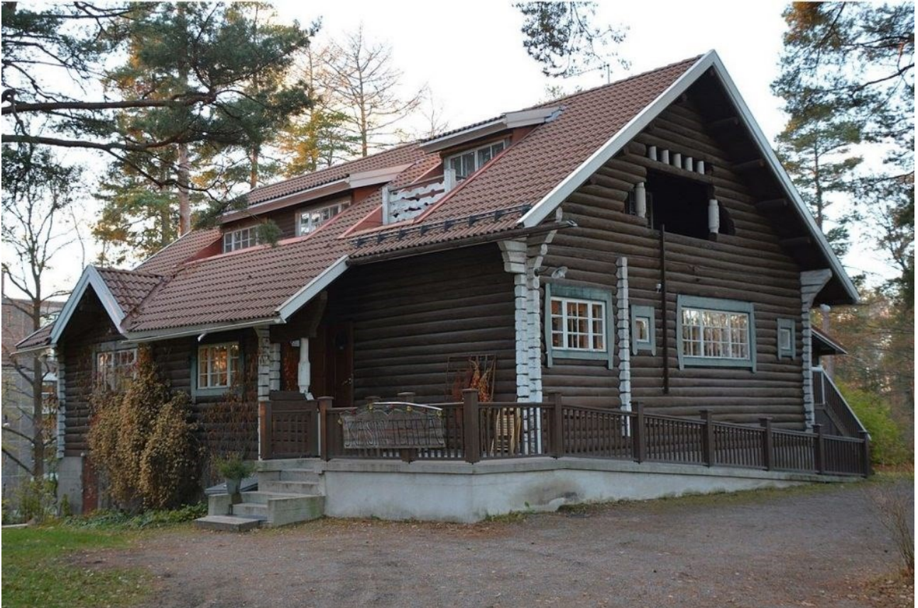
KUVA 1. Villa Cooper, arkkitehti Lars Sonckin Sigrid ja Gösta Enckellille suunnittelema huvila on rakennettu vuonna 1904 [4] [5].

Nykymuodossaan suomalainen mökkeily alkoi kehittyä vasta sotien jälkeen kansan vaurastuessa ja työehtojen parantuessa. Lomailu oli mahdollista vasta siinä vaiheessa, kun oli mahdollisuus pitää lomaa. [6]