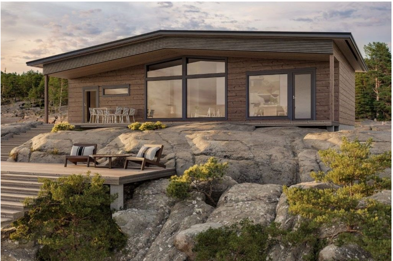
KUVA 3. Kontion Koivusaari-malli sai suurimman suosion kuvavalintakysymyksessä [8].

Ulkomuodoltaan perinteisen näköisen hirsimökin kannattajat ovat jäämässä vähemmistöön. Heitä silti oli noin kolmasosa vastaajista, mikä näkyy myös kuvavalintakysymyksen vastauksissa (kuva 3).