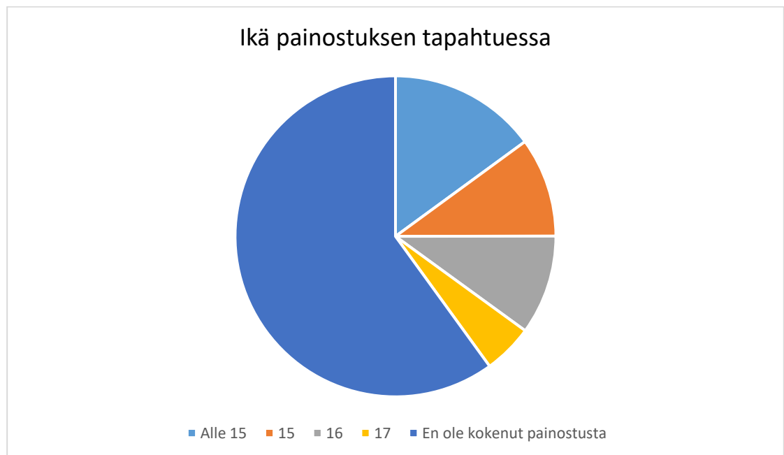
Kuva 3. Ikä painostuksen tapahtuessa

Vastauksista 58 % liittyen vastaajien ikään painostuksen tapahtuessa, antaa ymmärryksen, että vastaajat ovat kokeneet painostusta päihteiden käyttöön alaikäisenä. Kysymyksessä oli mahdollista vastata useampi vaihtoehto ja tämä ohjeistettiin myös kysymyksen asettelussa. Usea vastaaja, joka vastasi kokeneensa painostusta, valitsi useamman ikävuoden. Eniten painostusta on koettu alle 15-vuotiaana. 71 % vastasi, ettei ole kokenut painostusta tähän mennessä.