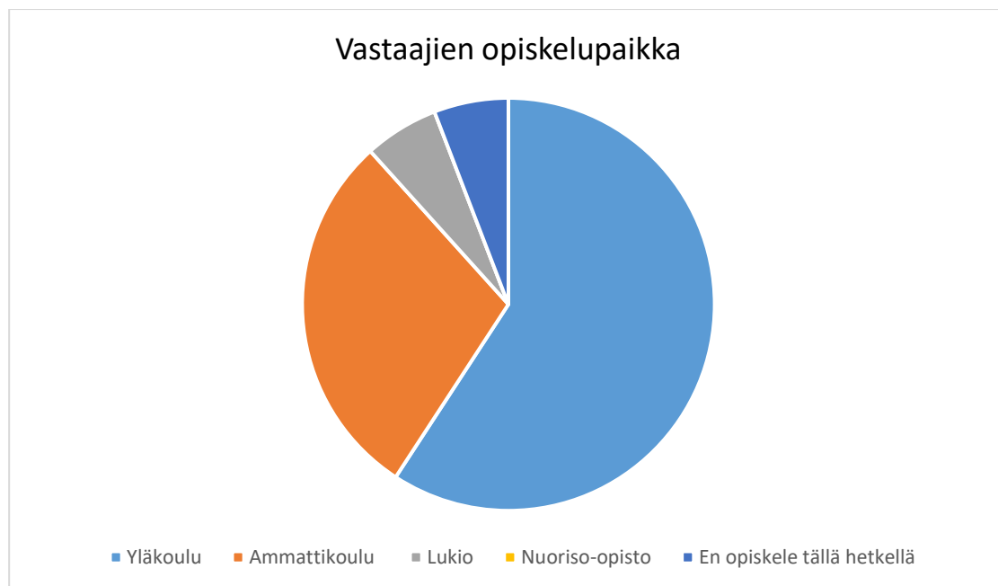
Kuva 1. Vastaajien opiskelupaikka

vastaajien välillä oli 15–17. Vastaajista 47 % eli lähes puolet olivat 15-vuotiaita. Vastaajista 18 % oli 16-vuotiaita ja 35 % 17-vuotiaita. Sukupuolen osalta suurempi osa vastaajista oli miehiä, 65 %, ja pienempi osa naisia, 35 %.