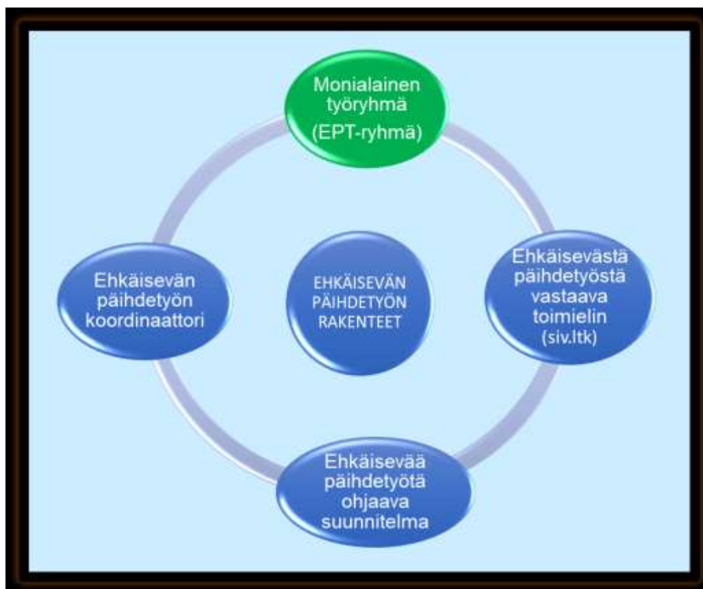
Kuvio 4. Ehkäisevän päihdetyön rakenteet ja resurssit Ikaalisissa Markkulaa ja Taulua mukailten (Markkula & Taulu 2020, 1).

Ikaalisissa ehkäisevän päihdetyön lain mukaiseksi toimielimeksi nimettiin sivistyslautakunta viimeisimmässä Hallintosäännön muutoksessa (Hallintosääntö Ikaalisten kaupunki 2023, 14). Ehkäisevän päihdetyön suunnitelmaan vuosille 2021 – 2025 (Ikaalisten kaupungin ehkäisevän päihdetyön suunnitelma vuosille 2021 –2025, 4) on kirjattu edustus ehkäisevään päihdetyöryhmään seuraavasti: