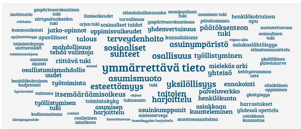
Kuva 2. Kuvakaappaus AnswerGarden -palvelussa tehdystä sanapilvestä

Valituista aineistoista ja niistä tehdyistä muistiinpanoista kerättiin tutkimuskysymyksiin vastaavia sanoja ja ilmaisuja sanapilveen, jonka pohjalta opinnäytetyön teemat rakennettiin aineistolähtöisesti (kuva 2).