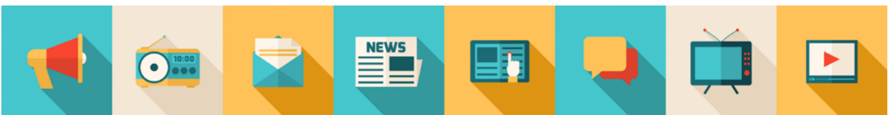
Kuvio 2. Esimerkki verkkosivulla käytetystä kuvituskuvasta (soveltaen Freepik, 2023).

Vasta projektin loppuvaiheilla havaitsin, että editoreille olisi ollut parikin vaihtoehtoa, joista olisi voinut valita profiilin asetuksissa. Käytin oletuseditoria, jossa kappaletyylit sai valita viidestä vaihtoehdosta, eikä esimerkiksi tekstin väriä tai kirjasimen tyyliä ja kokoa voinut editoerissa vaihtaa valikosta suoraan. Käyttämäni editori salli muutosten tekemisen HTML-näkymässä, mutta kurssin ylläpidon kannalta olisi työlästä muuttaa asetuksia kovin paljon käsin. Käytettävissä olisi ollut muun muassa notkeampi TinyMCE HTML-editori, jossa tekstien ulkoasua ja kuvien asemointia olisi voinut monipuolisemmin hallita. En voinut enää ryhtyä tekemään suuria muutoksia kurssin toteutuksen ollessa melkein valmis, joten en tätä sen pidemmälle pohtinut.