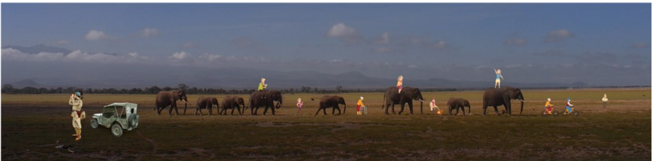
Kuvio 4. Verkkokurssin aloitussivun kuvitus, josta päätin luopua. Pixabayn ja Freepikin ilmais-kuvista muokannut Oili Turja (2023).

Luovassa työssä usein nähty lauseenparsi ”kill your darlings” kehottaa olemaan kiintymättä liiaksi omiin ideoihin ja luopumaan niistä, jos ne ovat prosessin kannalta turhia tai eivät toimi. Ensin kunnianhimoinen ajatukseni oli kehittää verkkokurssin ympärille tarina, joka olisi jatkunut osiosta toiseen. Punaisena lankana oli kurssin nimeäminen SenioriSafariksi, ja teemana olisi ollut senioreiden metsästäminen. Tähän inspiroivat sekä verkossa toimiva SeniorSurf-digipalvelu että vuonna 2017 ilmestynyt Jumanji-elokuva, jossa peliin joutuneet henkilöt yrittävät selvitä viidakosta. Opiskelija olisi aluksi käynyt läpi kurssille orientoivaa aineistoa, ja opiskelun edetessä osiosta toiseen hän olisi osion suoritettuaan saanut metsästysretken varrella reppuunsa uusia eväitä tai taitoja. Tarina olisi alkanut jo kurssitarjonnan aloitussivun kuvasta, jossa senioreita metsästäämään lähtenyt kirjastovirkailija tähyilee senioreita, jotka ehkä ovatkin aktiivisia tahoillaan, mutta kirjaston edustaja ei sitä huomaa (kuvio 4).