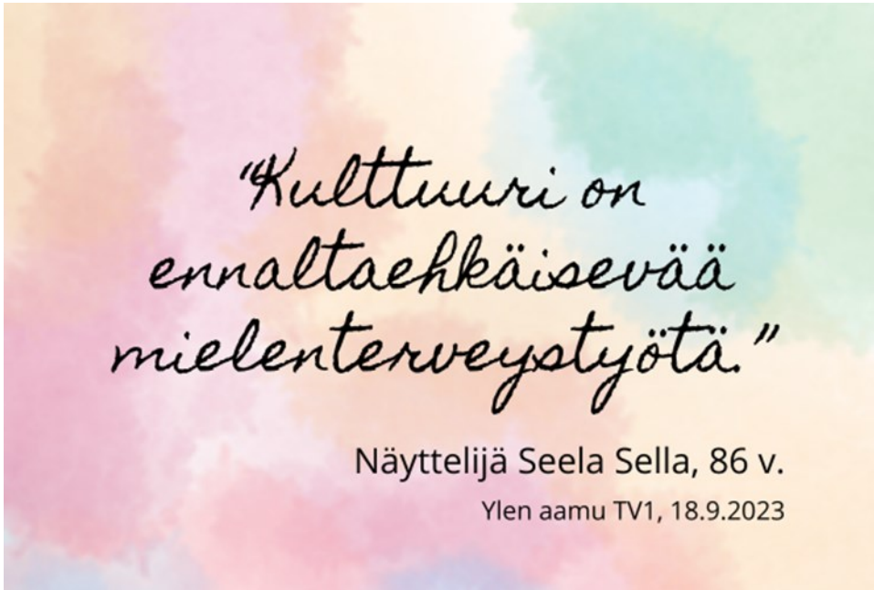
Kuvio 3. Verkkokurssin kulttuurihyvinvoinnista kertovan osion kuvitusta (Turja, 2023b).

Seniorityö kirjastossa -kurssi rakennettiin siten, ettei kurssin ylläpitäjän tarvitse seurata opiskelun edistymistä. Opiskelija saa automaattista ja välitöntä palautetta suorittaessaan tehtäviä, joissa on tarkistustoiminto – tällä kurssilla käytännössä H5P-elementeillä suoritettut kertaamiset käänökorttitehtävillä ja osaamisen testaaminen monivalintatehtävillä. Oppimiskokonaisuudet palasteltiin sopivanpituiseksi ja otsikoitiin mahdollisimman hyvin aiheen mukaan, jolloin opiskelija näkee helposti, mitä opiskeltava osio pitää sisällään. Opiskelija voi merkitä itse tehtävän suoritetuksi, ja opiskelun edistymisen seuraaminen kannustaa jatkamaan.