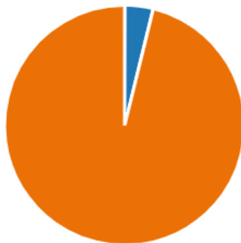
KUVIO 6. Onko vastaaja tehnyt itselleen edunvalvontavaltuutuksen.

Kyselyn tärkein ja aiheeseen lähimmin liittyvä kysymys oli viimeisenä. Kyselyn päätoiminen tarkoitus oli selvittää, kuinka moni nuori henkilö on tehnyt itselleen edunvalvontavaltuutuksen. Vastaaajista 4 % vastasivat kysymykseen ”kyllä”, mutta 96 % ilmoitti, ettei ole tehnyt itselleen edunvalvontavaltuutusta. Edunvalvontavaltuutuksen tehneistä kaikki paitsi yksi olivat naisia. Yksi 23–26-vuotias kertoi tehneensä edunvalvontavaltuutuksen, loput ”kyllä” vastanneista olivat iältään 27–29-vuotiaita. Koulutustausta edunvalvontavaltuutuksen tehneillä oli joko yliopisto tai ammattikorkeakoulu. Kaavion oranssi väri edustaa niitä, jotka eivät ole tehneet edunvalvontavaltuutusta ja sininen väri niitä, jotka ovat tehneet sen.