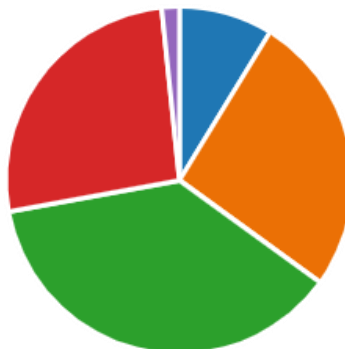
KUVIO 3. Vastaajien koulutustausta.

olevan ammattikorkeakoulu. Vastaajista 26 % oli käynyt yliopiston. Yliopiston käyneiden lisäksi myös ammattikoulun oli käynyt saman verran vastaajista, 26 %. Lukion oli käynyt 9 % vastaajista ja 2 % ilmoitti koulutustaustansa olevan ”muu”. Kaaviossa vihreä edustaa ammattikorkeakoulun, punainen yliopiston, oranssi ammattikoulun, sininen lukion ja violetti muun käyneitä.