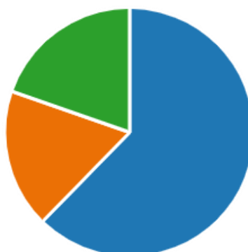
KUVIO 4. Vastaajien tietämys siitä, mikä on edunvalvontavaltuus.

Kyselyssä tiedusteltiin vastaajilta, tietävätkö he, mikä edunvalvontavaltuus on. 62 % vastaajista vastasi kysymykseen ”kyllä”, 20 % ”en ole varma” ja loput 18 % vastasivat ”en”. ”Kyllä” vastanneet ovat kaaviossa sinisellä, ”en ole varma” vihreällä ja ”en” oranssilla.