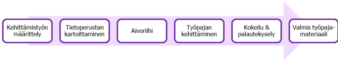
Kuvio 2. Opinnäytetyöni kehittämisprosessin vaiheet