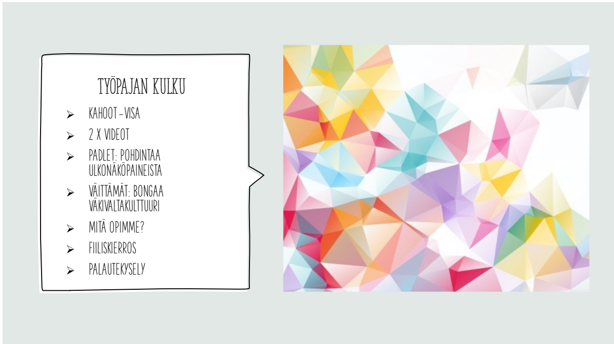
Kuva 2. Oppilaille pidettävän dialogisen työpajan Työpajan kulku -dia.

Menetelmäosion jälkeen kertaamme vielä, mitä aiheita olemme käsitelleet työpajassa ja lopuksi kysymme oppilaiden ajatuksia työpajasta. Työpajan materiaali ei muuttunut kovinkaan paljoa työpajakokeilujen jälkeen, koska työpaja koettiin jo toimivana kokonaisuutena. Tulevaisuudessa työpajaa voidaan jatkokehittää lisäämällä jo olemassa olevaan materiaaliin erilaisia menetelmiä tarpeen mukaan. Muutoksia saatetaan tehdä myös esimerkiksi menetelmissä käytettäviin työkaluihin, kuten Kahoot!- ja Padlet -työkaluihin, liittyen. Nämä työkalut ovat verkkopohjaisia, joten on aina mahdollista, että mahdollisuus niiden käyttöön loppuu, jolloin on otettava käyttöön uusia työkaluja. Tämän seurauksena työpajan toteutusmuoto voi muuttua.