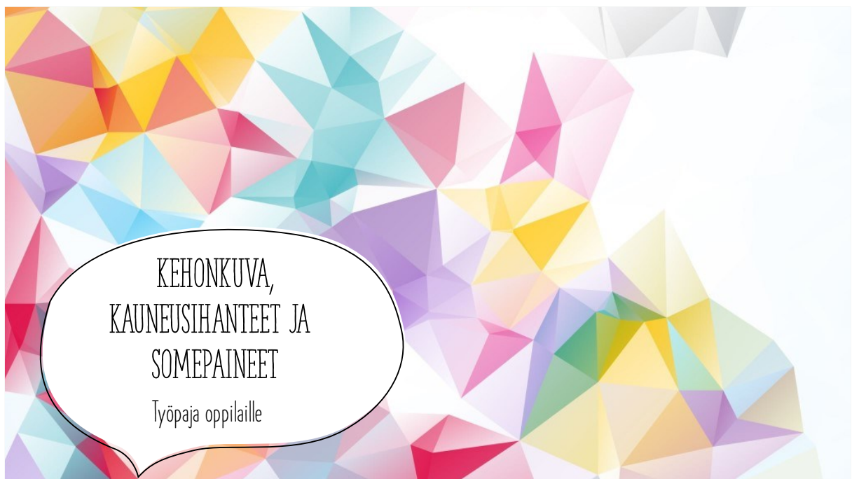
Kuva 1. Oppilaille pidettävän dialogisen työpajan aloitusdia.

Kehittämistyöni tuotoksena kehitin materiaalin dialogista työpajaa varten. Turun Tyttöjen Talon työntekijät voivat hyödyntää materiaalia koulujen kanssa tehtävässä yhteistyössä oppilaille työpajoja pitämällä. On mahdollista, että tulevaisuudessa myös vapaaehtoiset voivat pitää työpajoja kehittämäni materiaalin avulla. Lopullinen tuotos sisältää 24 diaa, joista yksi on otsikodia (Kuva 1), kuusi kertoo Tyttöjen Talon toiminnasta pohjustaen samalla työpajaa, yksi on sisältödiä (Kuva 2) ja yksi on lähdediä.