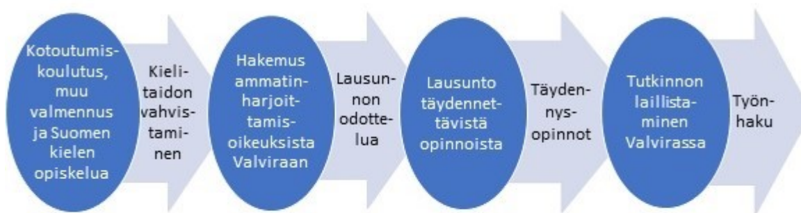
Kuva 2 Esimerkki tutkinnon laillistamisprosessista ammatinharjoittamisluvan saamiseksi

Maahanmuuttajien ohjaaminen ja kannustaminen tutkinnon tunnustamiseen tai ammatinharjoittamisluvan hakemiseen on ensiarvoisen tärkeää, jotta heidät saadaan edes kelpoisuusvaatimuksiltaan samalle lähtöviivalle suomalaisten työnhakijoiden kanssa. Osa ulkomailla suoritetuista sote-alan tutkinnoista on selkeämmin suomalaisille työmarkkinoille täydennettävissä (esim. sairaanhoitaja), osalle koulutusta vastaavan työn löytäminen on vaikeampaa (esim. mikrobiologi), jos maahanmuuttajalla ei ole täsmällistä kuvaa alansa työtehtävistä. (Kyhä 2006.) Opinto-, ura- ja pätevytymispolulle ohjaaminen ovat ohjaustyötä tekevien ydinosaamistaitoja, mutta onko heillä tähän riittävästi osaamista? Hidas prosessi turhauttaa maahanmuuttajia ja hukkaa yhteiskuntamme resursseja (kuva 2).