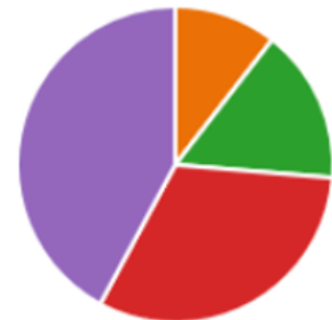
Kuvio 2: Ammattikorkeakoulun henkilöstön määrä.