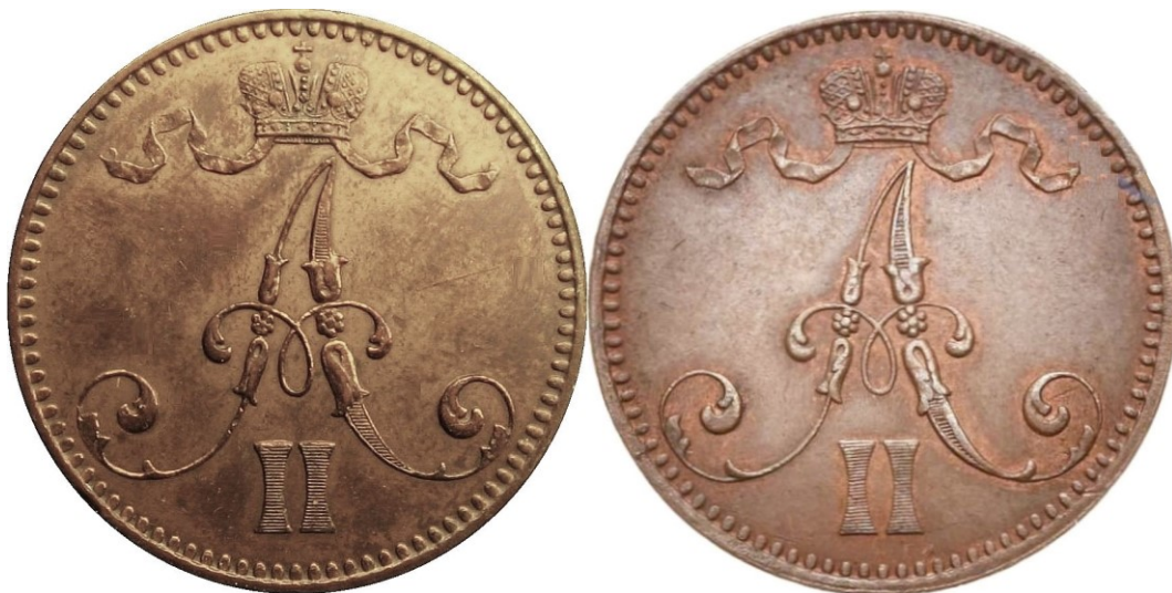
Kuva 3. 5 penniä 1867, uudet tunnuspuolen variantit . Arvopuolilla on