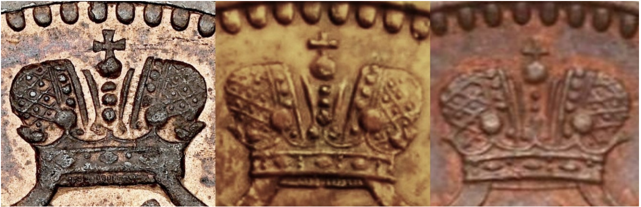
Kuva 5. 5 penniä 1867, tunnuspuolten kruunujen ja niiden ripojen vertailua. Kuvien yhdistely ja muokkaus Jorma J. Imppola, SeAMK.