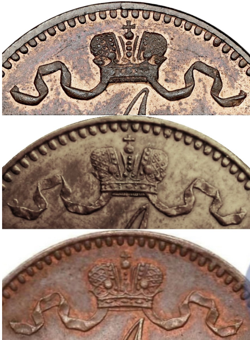
Kuva 4. 5 penniä 1867, tunnuspuolen varianttien kruunujen ja nauhojen vertailua. Ylinnä normaali, keskellä ja alinna alinna variantit. Kuvien yhdistely ja muokkaus Jorma J. Imppola, SeAMK.

Myös varianttien nauhat poikkeavat normaalirahan nauhasta erityisesti suuremmalla yksityiskohtaisuudellaan. Kuten seuraavasta kuvista 5 ja 6 käy ilmi, ovat varianttien kruunut normaalirahan kruunun levyisiä, mutta kruunun runko on varianteissa alempana.