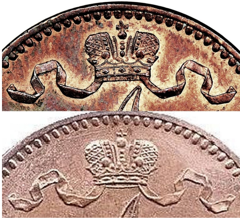
Kuva 7. 5 penniä 1870 tunnuspuolten kruunujen ja nauhojen vertailua. Ylinnä vuoden 1870 normaalirahan kruunu sekä nauhat ja alinna variantin kruunu sekä nauhat. Kuvien yhdistely ja muokkaus Jorma J. Imppola, SeAMK.

sisäosia ole vaakaviivoitettu. Variantti on siis miltei identtinen vuoden 1867 vastaavan variantin kanssa.