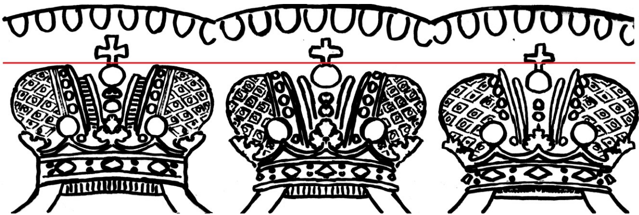
Kuva 6. 5 penniä 1867, tunnuspuolten kruunujen ja niiden ripojen vertailua piirroskuvan avulla. Vasemmalla normaali, keskellä ja oikealla uusi variantit. Kuvan luonti Jorma J. Imppola, SeAMK.

Kuvissa 5 ja 6 on vasemmalla normaali raha, jossa iso risti lähellä reunahelmiä ja suora ripa isoine timanttikuvioineen ja suoralla viivavarjostettuna alaosallas. Kruunun keskiosan sisäosat on myöskin vaakaviivoitettu. Keskellä on variantti jossa on siro risti reunahelmien lähellä ja kaarevampi ripa isoine timanttikuvioineen ja hieman kaarevalla viivavarjostettuna alaosalla. Oikealla on varianttiKuvien yhdistely ja muokkaus i hyvin pienine risteineen etäämpänä reunahelmistä ja kaarevine ripoineen siroilla timanttikuvioilla ja kaarevalla alaosalla. Varianttien kruunun runko on normaalirahan kruunun runkoa selkeästi alempana eikä kruunun keskiosan sisäosia ole vaakaviivoitettu.