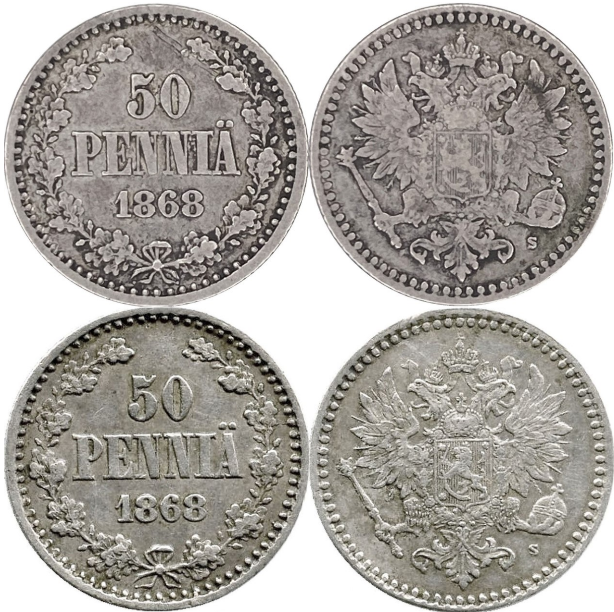
Kuva 3. 50 penniä 1868, ylempänä normaalinauhainen raha, alempana heiveröisemmät nauhat.

Tarkastelkaamme nauhoja hieman yksityiskohtaisemmin, josko jotain selkeitä seikkoja kävisi ilmi.