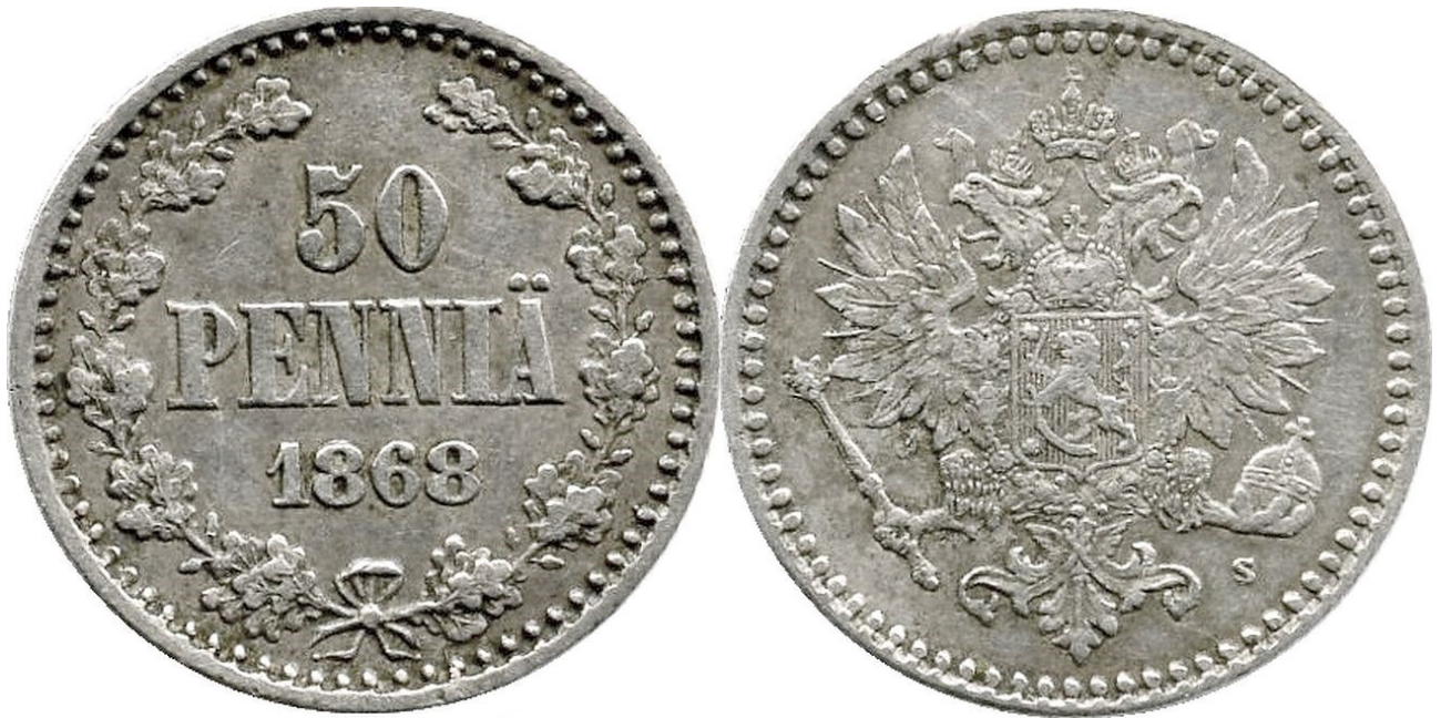
Kuva 2. 50 penniä 1868, tunnuspuolella vasemman pään yllä ja keskikruunun alla matalat ja hintelämmät nauhat. Kuvien yhdistely ja muokkaus Jorma J. Imppola, SeAMK

Onko kyse variantista, vai meistin kulumisesta tai täyttymisestä? Variantin tapauksessa olisi kyse ihan omanlaisesta meististä, mutta pelkkä meistin kuluminen tai täytyminen ei vielä tee poikkeamasta varsinaista varianttia. Tutkiessani omia 13 kappalettani ja netin kautta noin 20 muuta kappaletta vuoden 1868 50-pennisiä huomasin, että jakauma normaalin vahvojen nauhojen ja poikkeaman osin heiveröisten nauhojen suhteen oli melko tarkkaan puolet ja puolet. Näin ollen ei ehkä olekaan kyse vain meistin kulumisesta tai täyttymisestä, vaan ehkäpä uudesta variantista.