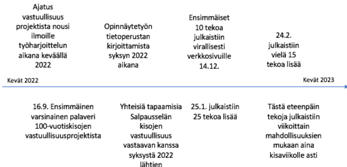
Kuvio 3. Prosessikuvaus

Projektin prosessi alkoi varsinaisesti keväällä 2022 työharjoittelun aikana Salpausselän kisojen järjestävässä organisaatiossa Salppuri Oy:ssä. Tällöin vuoden 2022 kilpailuiden suunnittelussa voitiin panna merkille organisaation vastuullisuuden tila sekä huomioida mahdollisia parannuskohtia. Ideoita toteutettiin joissakin määrin jo harjoittelun aikana, mutta varsinainen ajatustyö alkoi vasta kilpailuiden jälkeen, loppu kevästä. Opinnäytetyön projektin varsinaisesti alkaessa 16.9. yhdessä organisaation johdon kanssa mietittiin, kuinka tapahtuman vastuullisuutta saataisiin parannettua ja luotua vastuullisuusviestintä kaikille ymmärrettäväksi kokonaisuudeksi. Näin heräsi esiin 100 tekoa 100 vuoden kunniaksi. Yhdessä mietittiin tavoitteet, joihin kehittämistyöllä pyritään. Salpausselän kisojen vastuullisuus vastaava loi vastuullisuusohjelman, jossa tuodaan esille pääasiat yrityksen vastuullisuudesta ympäristövastuun sekä sosiaalisen vastuun aihepiireistä. Tämän pohjalta lähdettiin miettimään mitä asioita on tehty jo vastuullisesti, joita voisi nostaa 100 tekoon mukaan, sekä missä asioissa olisi hyvä parantaa tai tehdä muutoksia.