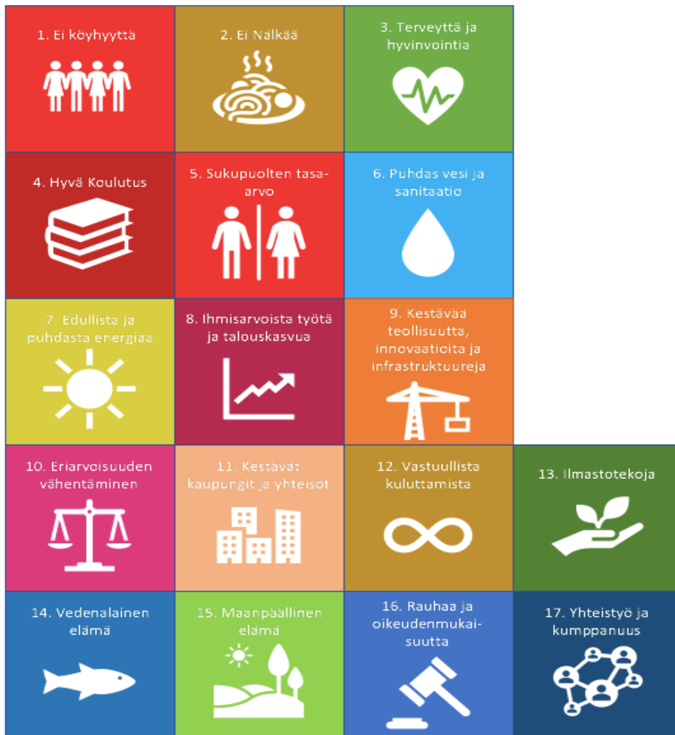
Kuvio 1. Kestävän kehityksen tavoitteet (Agenda 2030 – kestävän kehityksen tavoitteet. N.d.).