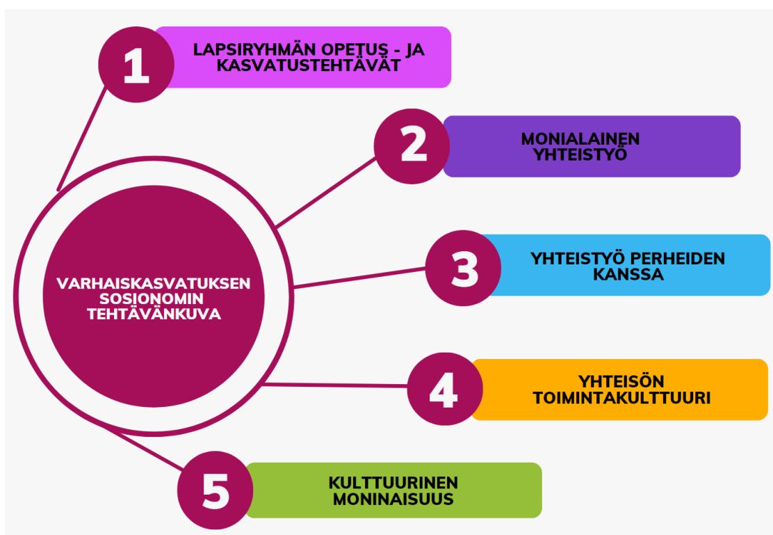
Kuva 2. Varhaiskasvatuksen sosionomin tehtäväkuva

Opetus- ja kulttuuriministeriön julkaisussa Varhaiskasvatuksen kehittämisen tiekartassa vuosille 2017–2030 (Karila, Kosonen, Järvenkallas 2017, 76) mainitaan varhaiskasvatuksen sosionomien erityiseksi osaamisalueeksi lasten ja perheiden arjen tuntemus ja arjesta nousevien tuen tarpeiden tunnistaminen, sekä lisäksi yhteistyö muiden sosiaali- ja terveysalan asiantuntijoiden kanssa. Sosionomin ammatilliset kompetenssit (Savonia-ammattikorkeakoulu 2022) sisältävät taidot tukea perheiden arkea ja perheenjäsenten keskinäisiä suhteita, sekä edistää yhdenvertaisuutta ja tasa-arvoa. Lisäksi varhaiskasvatuksen näkökulmasta oleellisia sosionomien ammatillisia kompetensseja ovat myös sekä hyvinvointia uhkaavien, että tukevien tekijöiden tunnistaminen ja ennaltaehkäisevän työn ja varhaisen tuen toteuttaminen. Kuvassa 3. esitetään varhaiskasvatuksen sosionomin tehtäväkuva Talentian (2022) laatiman oppaan mukaan.