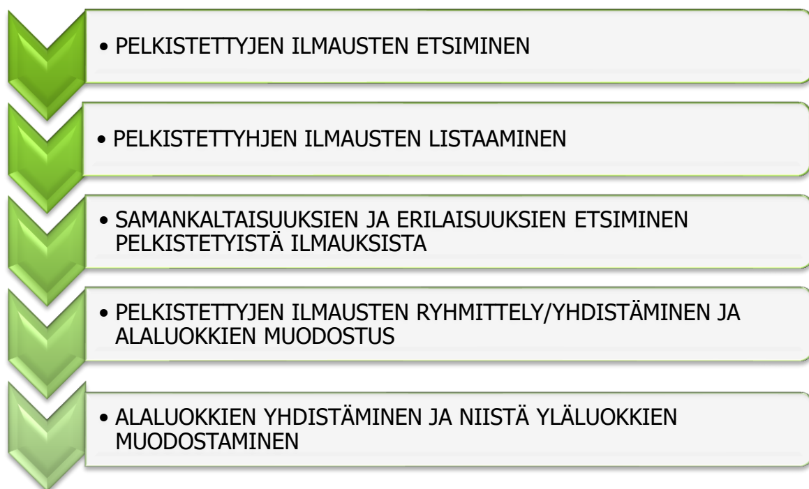
Kuva 3. Aineistolähtöisen sisällönanalyysin eteneminen (Muokattu lähteestä Tuomi & Sarajärvi 2018)

näkemykset, josta voidaan muodostaa johtopäätöksiä tutkitusta asiasta (Puusa 2020, 148). Sisällönanalyysi aloitetaan pelkistämällä aineistoa karsimalla sieltä epäolennainen pois ja etsimällä siitä olennaista, eli tutkimustehtävää kuvaavia alkuperäisilmauksia. Näistä muodostetaan pelkistettyjä ilmauksia, jotka listataan niin, että mitään olennaista aineistosta ei katoa. Pelkistämisen jälkeen aineisto klusteroidaan, eli ryhmitellään, jolloin aineistosta nousevat samaa ilmiötä kuvaavat käsitteet ryhmitellään ja yhdistetään eri luokiksi, joista muodostuvat alaluokat. Tämän jälkeen aineistoa käsitteellistetään, eli erotetaan aineistosta tutkimuksen kannalta olennainen tieto, jonka perusteella muodostetaan teoreettisia käsitteitä ja johtopäätöksiä. (Tuomi & Sarajärvi 2018, 123–125.) Kuvassa 4. esitetään aineistolähtöisen sisällönanalyysin etenemisen vaiheita.