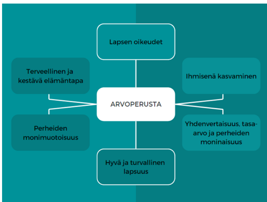
Kuva 1. Varhaiskasvatusta ohjaavat arvot (Muokattu lähteestä Varhaiskasvatussuunnitelman perusteet 2022, 16–17.)

Yhdenvertaisuus, tasa-arvo ja moninaisuus ovat arvoja, joita varhaiskasvatus vie eteenpäin. Taitojen kehittäminen sekä valintojen tekeminen tulee mahdollistaa lapsille sukupuoleen, syntyperään, kulttuuristaan tai henkilön muihin ominaisuuksiin katsomatta. Henkilöstön tehtävänä on moninaisuutta kunnioittavan ilmapiirin luominen. Varhaiskasvatus muodostuu moninaisesta kulttuuriperinnöstä, jota vuorovaikutus lasten, vanhempien ja henkilöstön välillä muovaa jatkuvasti. Monimuotoisiin perheisiin, kieliin, kulttuuriin, katsomukseen, uskontoon, perinteisiin ja näkemyksiin kasvatustavoista tulee suhtautua ammatillisesti ja avoimesti. Tämä antaa edellytykset suotuisalle yhteiselle kasvatustyölle. Lapsen suhdetta perheeseensä tulee myös tukea, jotta hän voi tuntea oman perheensä olevan arvokas. (Varhaiskasvatussuunnitelman perusteet 2022, 17.) Kuvassa 2 on esitetty varhaiskasvatusta ohjaavat arvot.