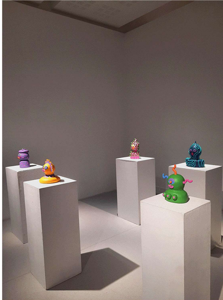
Kuva 13. Valmiit teokset Mältinrannan taidekeskuksessa 2023