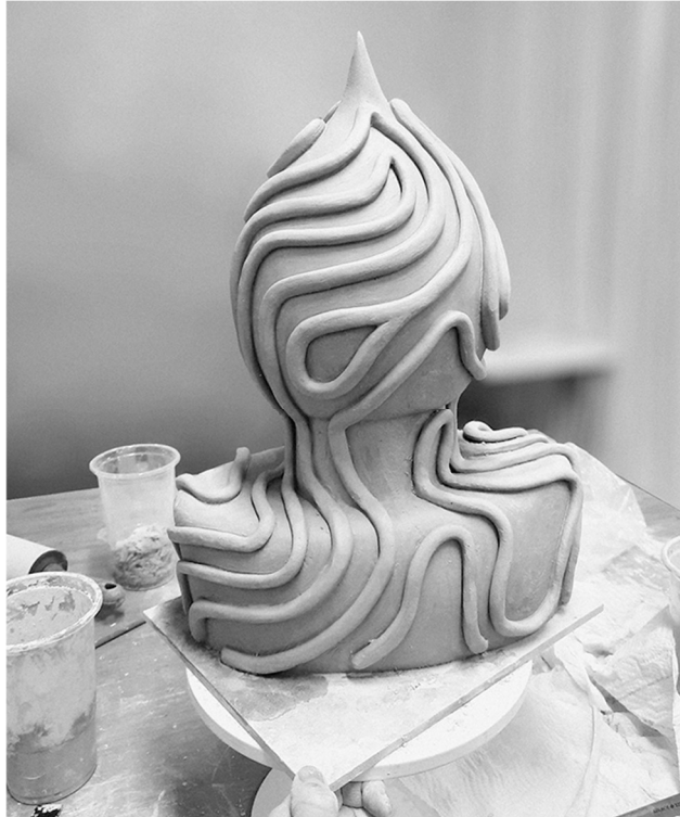
Kuva 10. Kiinnitetyt "nuudelit"