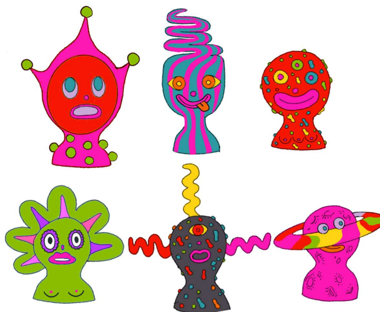
Kuva 2. luonnos

Kuten edellä mainitut lapsuuteni oliot, värien yltäkyläisyys ja hassuttelu pääsivät jälleen luonnoksissani henkiin. Päätin tehdä olennoista rintakuvaveistoksia ikään kuin ne olisivat jonkinlaisia ”palvontapatsaita” vaikka mitään palvonta-aspektia ei ole. Niistä tulee kuitenkin jonkinlainen uskonnollinen tai talismaalimainen tunnelma. Hahmoja tuli niin monta kuin sain ideoita, luonnostelin niitä kuusi, mutta lopullinen määrä valmistuneita teoksia oli kuitenkin viisi.