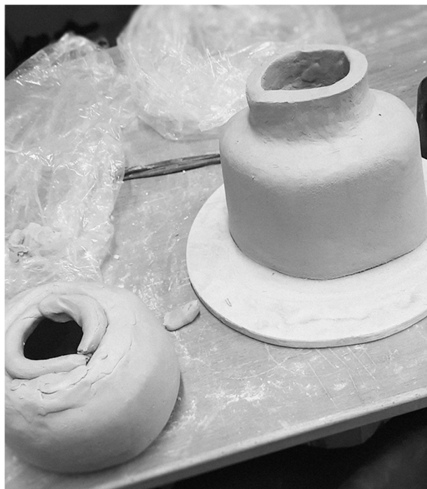
Kuva 3. Koverrus

Hahmon muotoilu alkaa aina pelkistetystä pohjamuodosta. Silloin määrittyy teoksen suurpiirteinen muoto ja koko. Pohjamuodon kovetuttua hieman leikkaan sen kahteen osaan. Pää ja torso. Sitten koverran niiden sisältä savea, tämä edistää teoksen kuivumista tehokkaasti. Koverruksen jälkeen yhdistän pään ja torson saviliejulla yhteen.