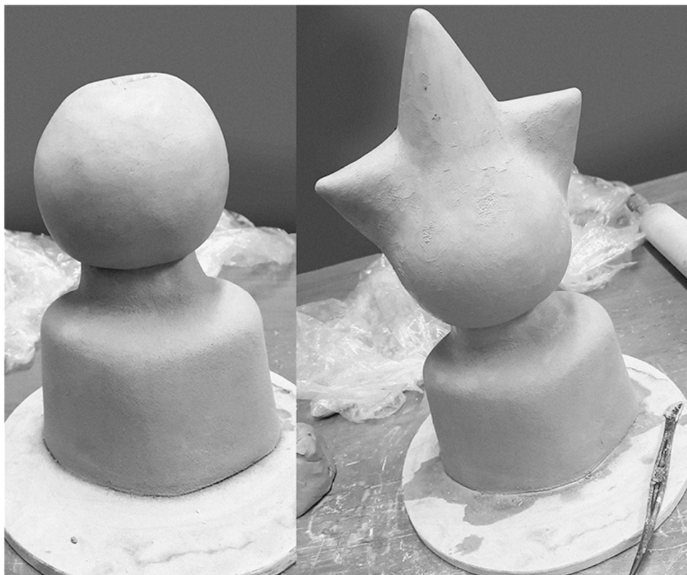
Kuva 4. Muodon rakentuminen

Tiedän, että kun teos on saanut viimeisen muotonsa, kaikki nämä asiat ja manifestointi kiteytyvät ja todellinen merkitys on syntynyt, joten en jää turhan merkityksellisesti pohtimaan tarkoituseriä ja keskityn prosessin aikajanaan.