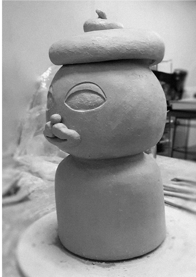
Kuva 7. Muuttunut ilme

Jo luonnoksesta tulee sellainen olo, että hän olisi jonkinlaisen hassuttelun ja irrottelen kiteytymä ja se ajatus on pysynyt melko samana teoksen valmistuttua, tosin saaden vielä spesifimmän tarkoituksen. Asiasta lisää luvussa Nimi-leikkejä.