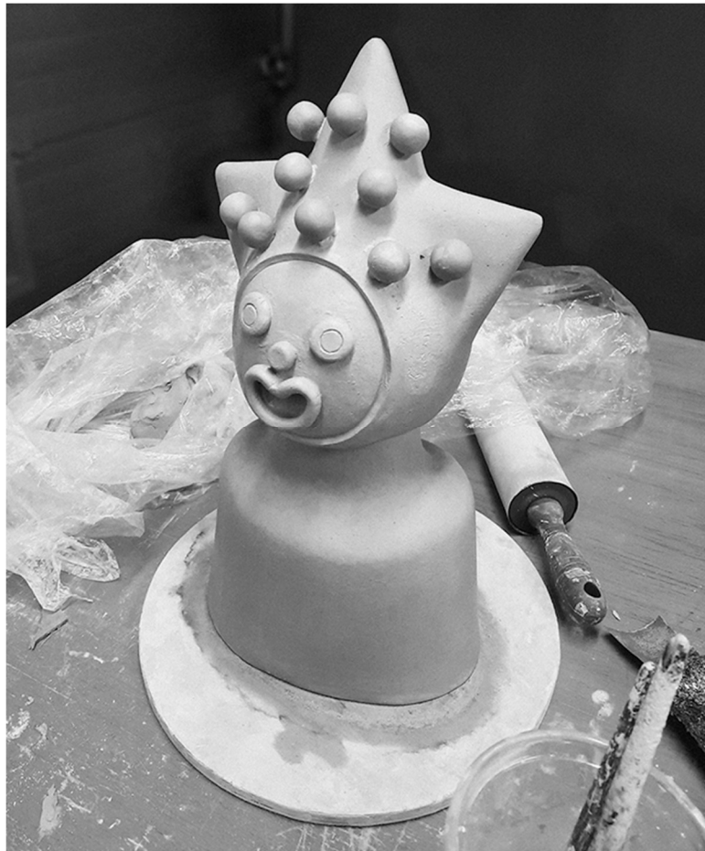
Kuva 5. Pallojen kiinnitys