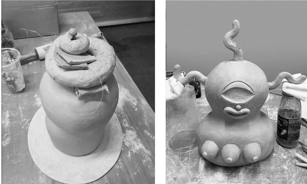
Kuva 6. Kuivumisasetteluja

Prosessin aikana osaamiseni saven käsittelyssä on kehittynyt ja työskentely nopeutunut.