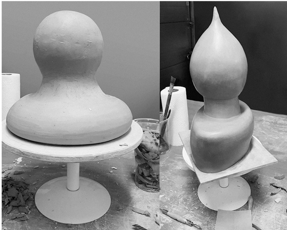
Kuva 9. Pohjamuodot

Pohjamuotoja tehdessä keskitin paljon aikaa niiden hiomiseen täydelliseksi ja sileäksi. Hiominen vei turhan paljon aikaa, varsinkin suippopään rakennuksessa, sillä ”nuudelimaisia” elementtejä kiinnittäessäni oli kuitenkin karhentava teoksen pintaa, jotta ne pysyisivät paikallaan. Saatan usein jumittua hienosäätämään kohtia, jotka voisi korjata myös myöhemmin tai jotka saattavat jäädä täysin näkymättömiin. Perfektionismistani tulee välillä rajoittavaa, se saa minut haaskaamaan aikaani loppujen lopuksi merkityksettömään hiomiseen.